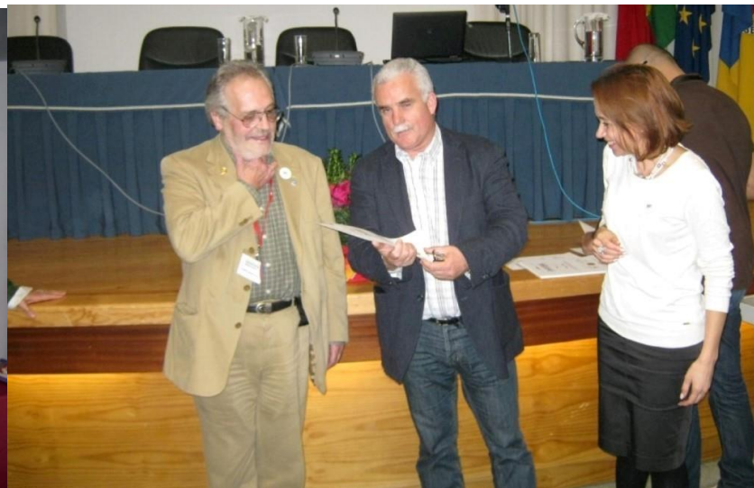
20º SEIA 2013