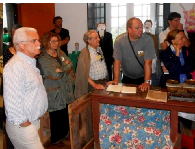
24º GRACIOSA 2015