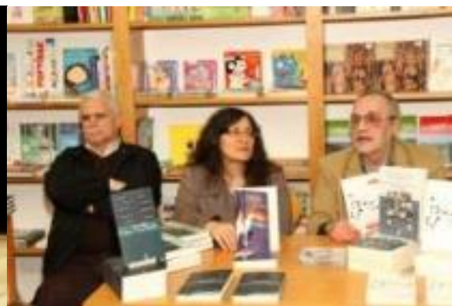
26º PDL 2013