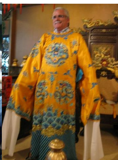
15º macau 2011