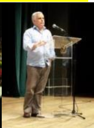
13º Floripa 2010