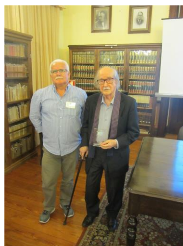
36º PDL 2022