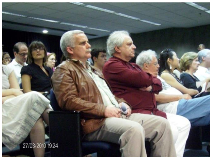
13º Brasília 2010