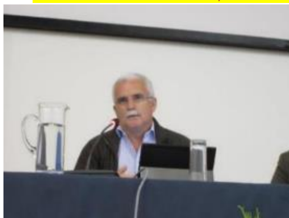
23º FUNDÃO 2015