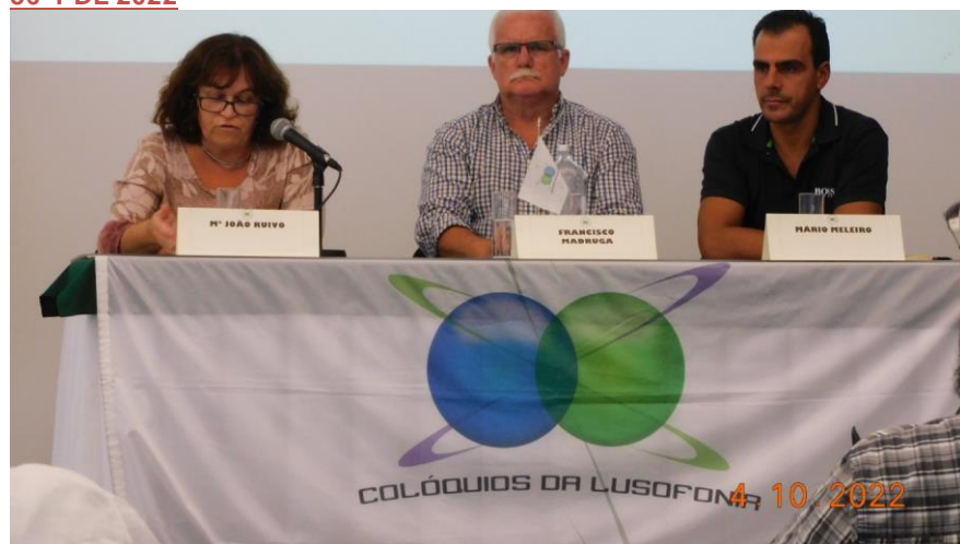
36º PDL 2022