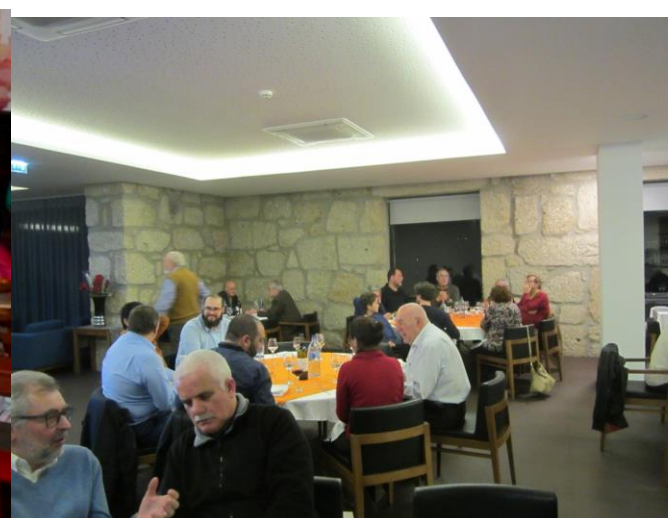
29º BELMONTE 2018