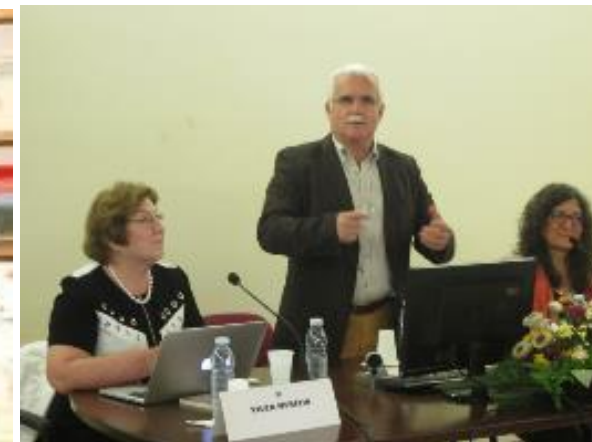
26º LOMBA DA MAIA 2016