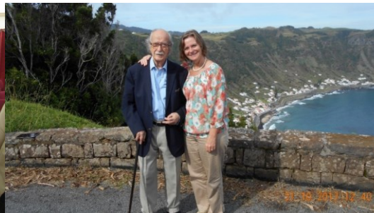
28º VILA DO PORTO 2017