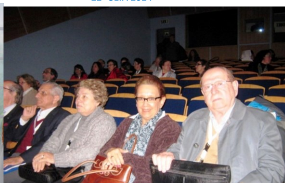
17º LAGOA 2009