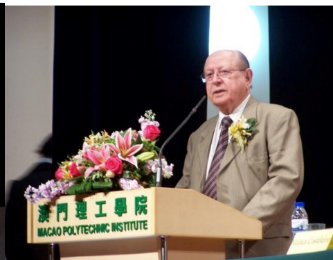
15º MACAU 2011