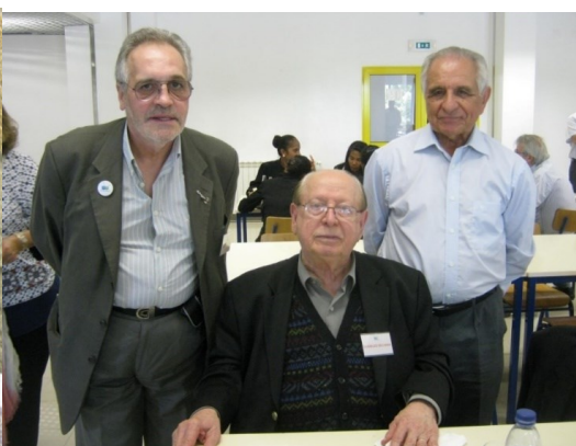
22º SEIA 2014