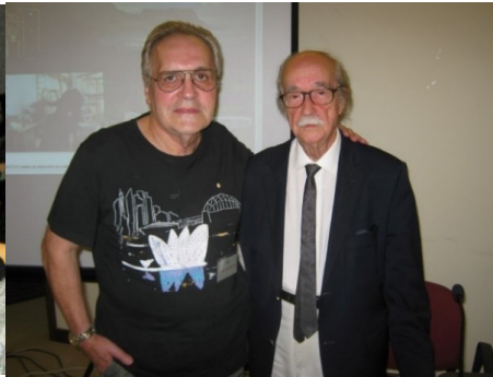
26º LOMBA DA MAIA 2016