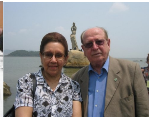
15º MACAU 2011