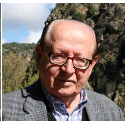
8º COLÓQUIO BRAGANÇA 2007