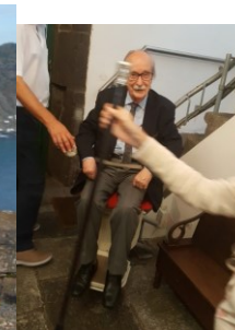
32º GRACIOSA 2019

Desempenhou, além da docência, diversos cargos, entre os quais o de subdiretor de uma escola técnica (Nuno Gonçalves) e diretor de outra (Cesário Verde).