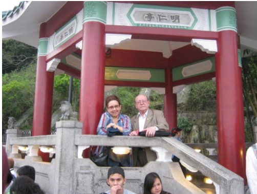
15º MACAU 2011