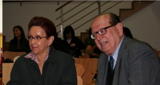
8º BRAGANÇA 2007