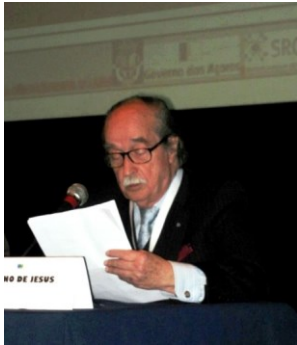
17º LAGOA 2012