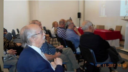
28º VILA DO PORTO 2017