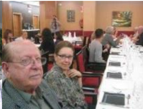
18º OURENSE, GALIZA 2012