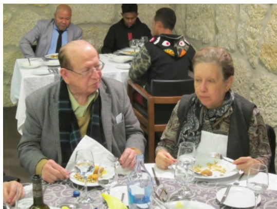
29º BELMONTE 2018