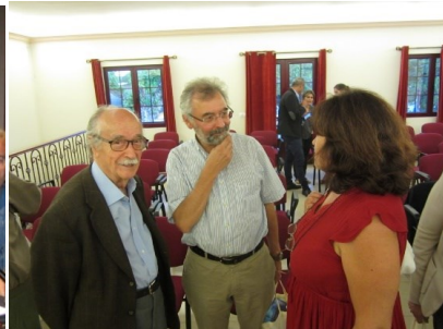
26º LOMBA DA MAIA 2016