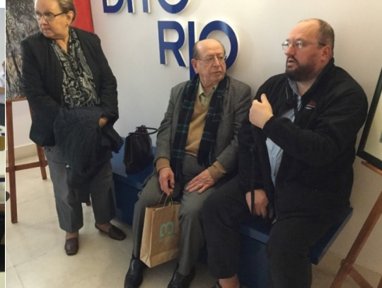
29º BELMONTE 2018