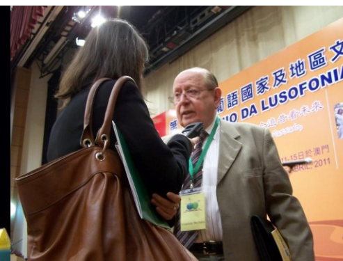
15º MACAU 2011

OUÇA-O AQUI NO 15º EM MACAU 2011 HTTPS://WWW.YOUTUBE.COM/WATCH?V=AJWYE2VM4X8&T=0S&INDEX=264&LIST=PLWJU9YOUWOKYMKAIEPZIF1C_4TVTKER