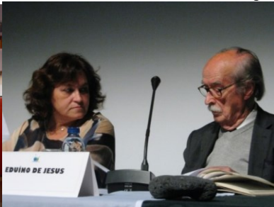
26º LOMBA DA MAIA 2016 32º GRACIOSA 2019