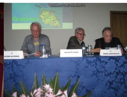
24º GRACIOSA 2015