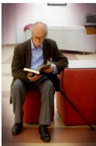
28º VILA DO PORTO 2017

No Ensino Técnico foi professor, primeiro, de Língua e História Pátria e depois, quando o Francês foi introduzido no Ensino Técnico Elemental, passou a lecionar Português e Francês, disciplinas de que também foi professor em colégios privados. Na Faculdade de Ciências Humanas da Universidade Nova de Lisboa lecionou Teoria da Literatura apenas no ano letivo de 1979-80 e na Faculdade de Letras da Universidade (Clássica) de Lisboa, durante mais de vinte anos, até ao ano 2000, História da Literatura Portuguesa e outros Cursos de Língua e Cultura Portuguesa para estudantes estrangeiros.