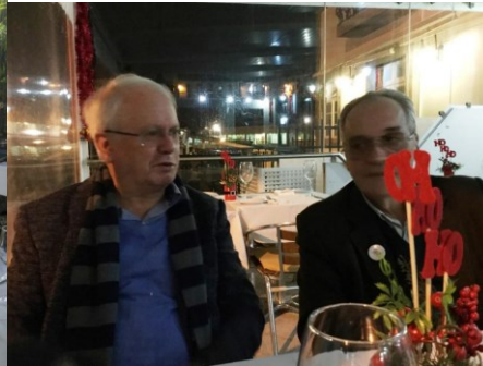
BGA ANGRA 2017