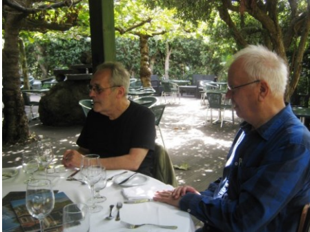
30ª PICO 2018