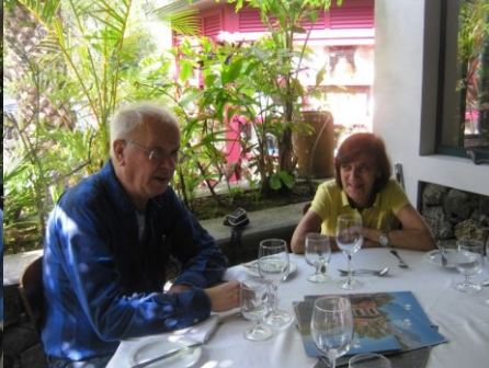
30ª PICO 2018