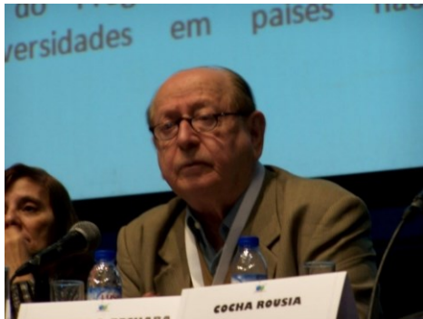
17º LAGOA 2012

Membro da ABL. Foi nomeado ACADÊMICO CORRESPONDENTE DA ACADEMIA GALEGA DA LÍNGUA PORTUGUESA em outubro 2012.