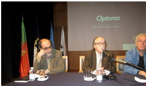
17º LAGOA 2012