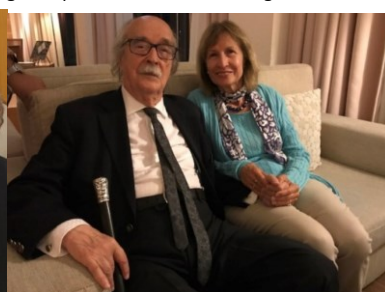
32º GRACIOSA 2019