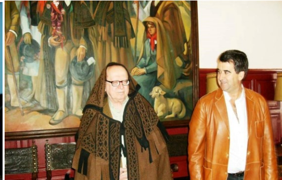
10º BRAGANÇA 2008