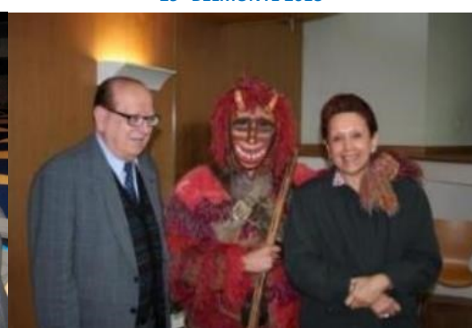
8º BRAGANÇA 2007