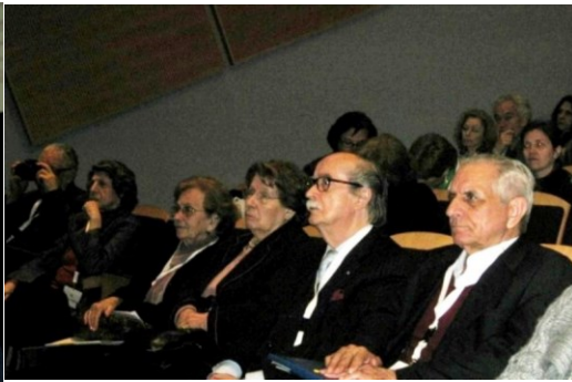
17º LAGOA 2012