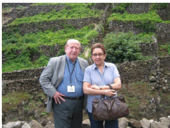
16º SANTA MARIA 2011