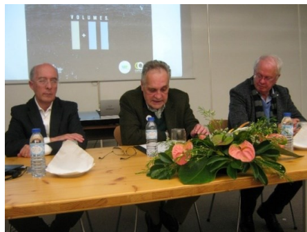
BGA ANGRA 2013