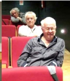
18º GALIZA 2012