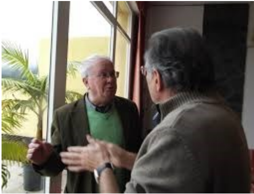
19º MAIA 2013