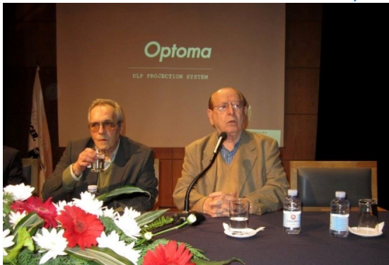
17º LAGOA 2012