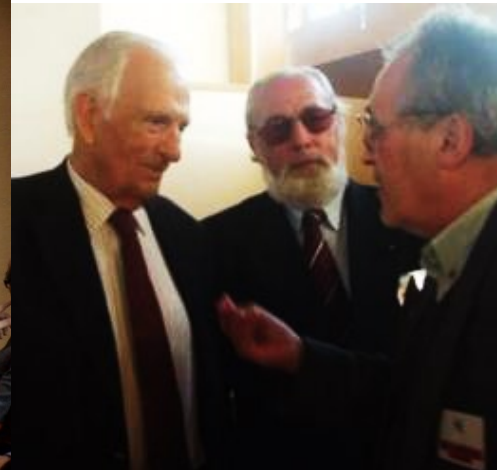
12º BRAGANÇA 2008