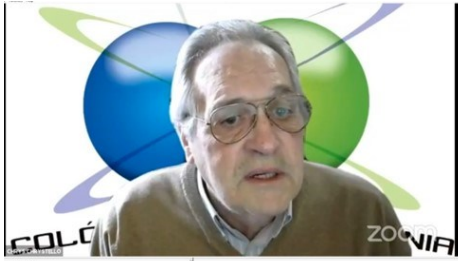
33º BELMONTE 2021