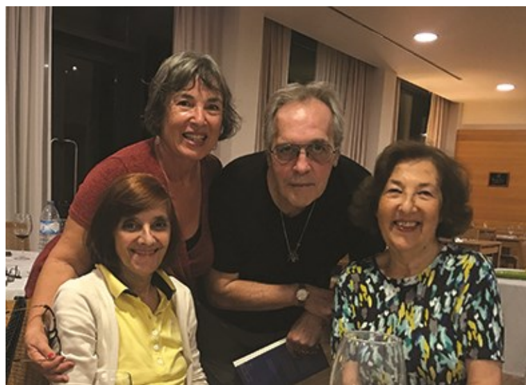
32º GRACIOSA 2019