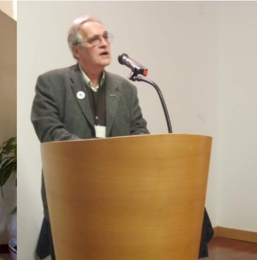
29º BELMONTE 2018