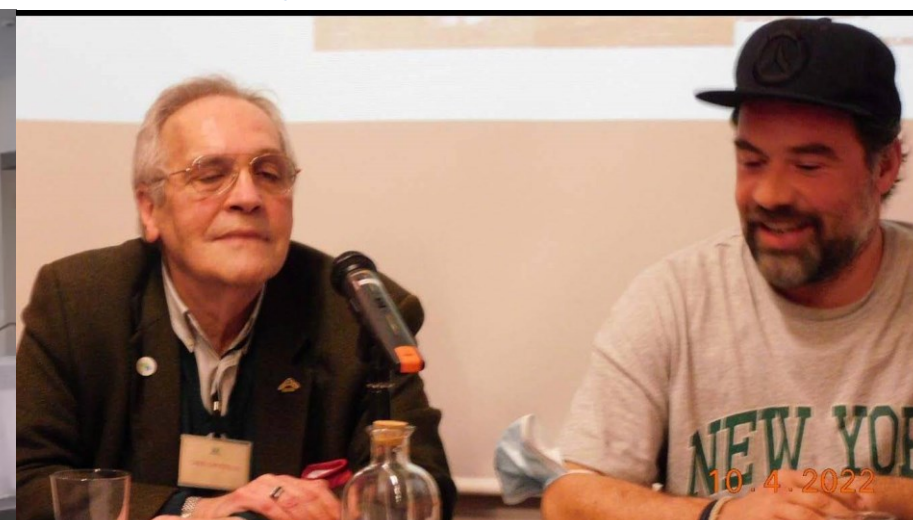
35º BELMONTE 2022