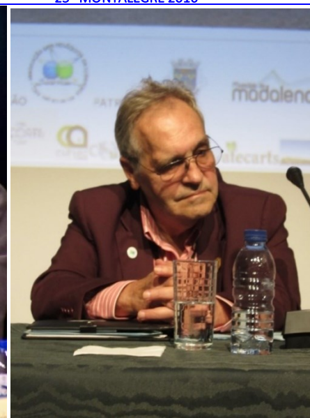
30º MADALENA DO PICO 2018