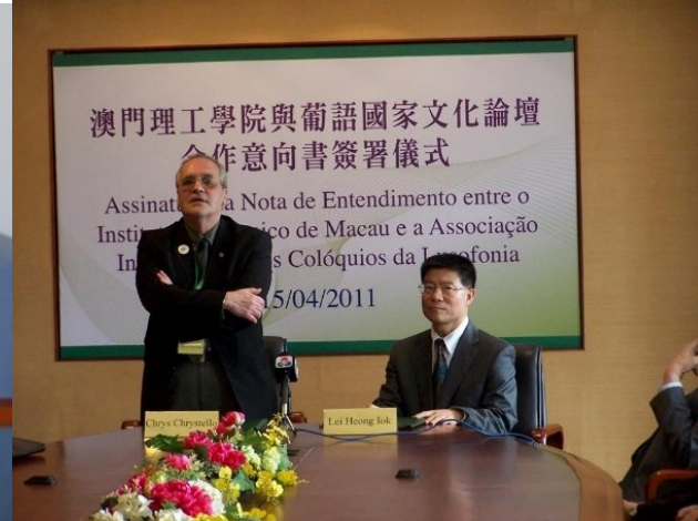
15º MACAU 2010