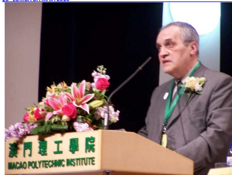
15º MACAU 2011