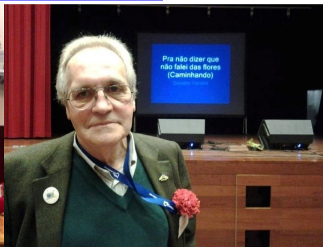
25º MONTALEGRE 2016