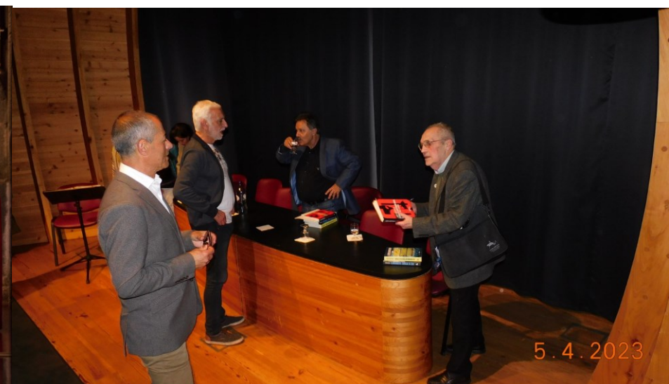
36º PDL 2022