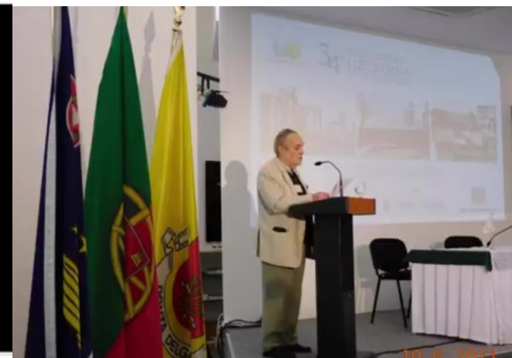
34º PDL 2021