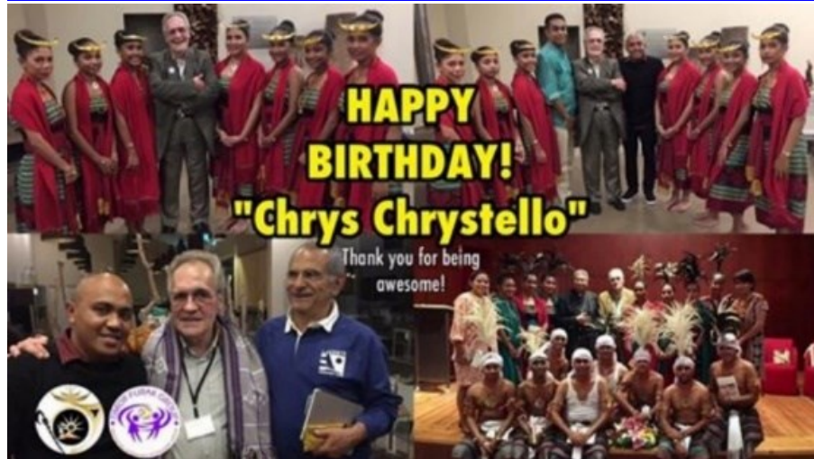
26º LOMBA DA MAIA 2016