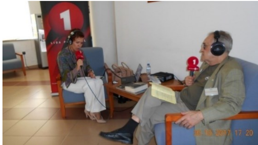
28º VILA DO PORTO 2017