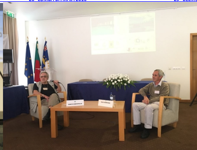
32º GRACIOSA 2019