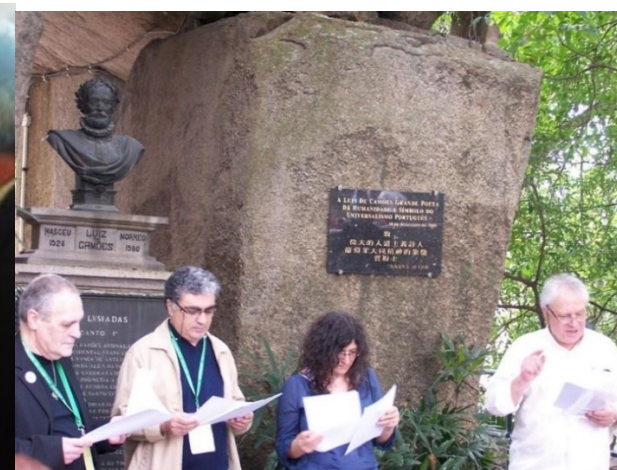
POESIA, GRUTA DE CAMÕES 15º COLÓQUIO MACAU 2011