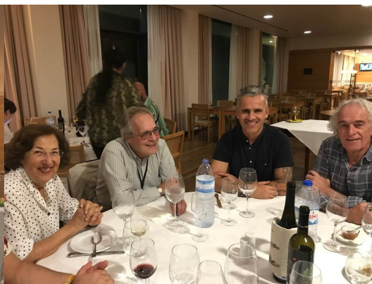
32º GRACIOSA 2019