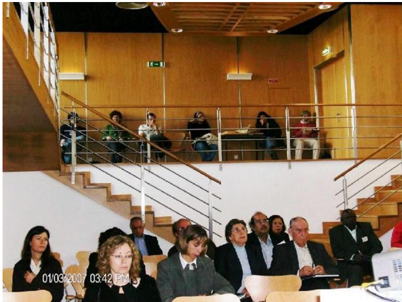
8º BRAGANÇA 2007