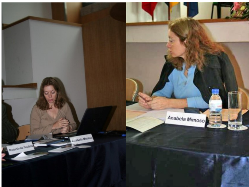
6º Bragança 2006