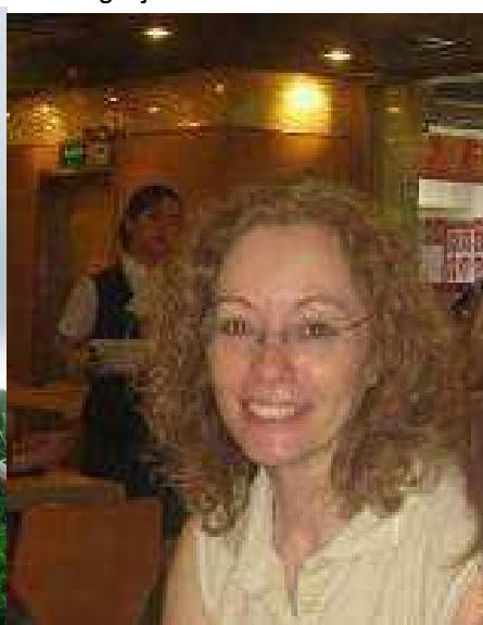
15º Macau 2011