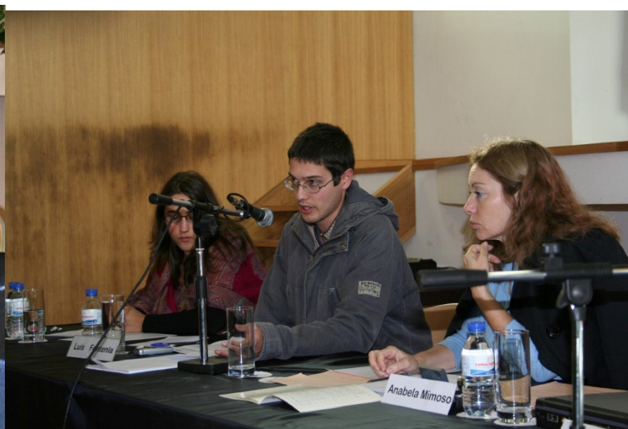
6º Bragança 2006