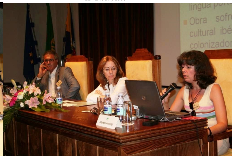
12ª BRAGANÇA 2009