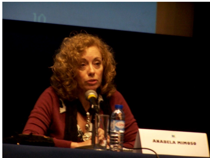
17º Lagoa 2012