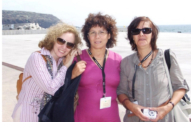
VILA DO PORTO 2011