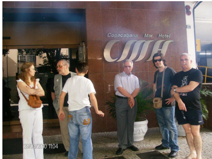
13º BRASIL 2010 (RIO)