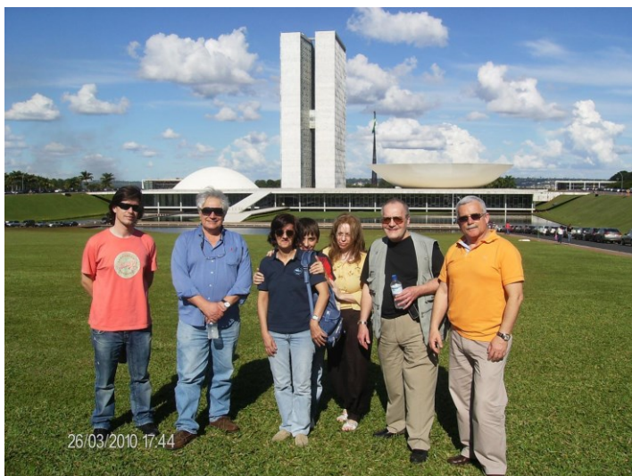
13ª BRASIL 2010 (BRASÍLIA)