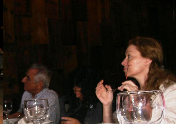
13º BRASIL 2010 (FLORIPA)