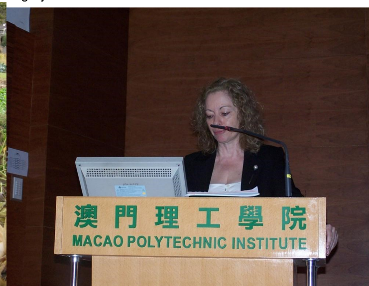
15º Macau 2011