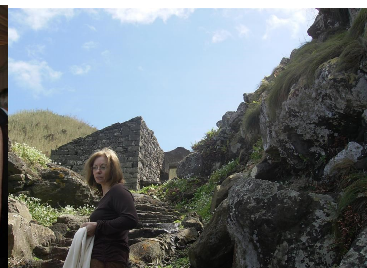
Praia da Viola, Lomba da Maia 2012

Tem uma vasta obra escrita que vai desde a literatura infantojuvenil (obras como: D. Bruxa Gorducha , Foz Côa – entre céu e rio ; As férias do caracol ; Aquela palavra mar... ), à literatura tradicional ( Contos tradicionais do povo açoriano de Teófilo Braga : introdução, seleção e notas) e a estudos sobre a Geração de 70 ( S. Cristóvão de Eça de Queirós – introdução ), além de inúmeros artigos de revistas, participações em congressos nacionais e internacionais, conferências, de manuais para o ensino da Língua Portuguesa para os 2º e 3º ciclos, é autora de um razoável número de livros de literatura infantojuvenil: