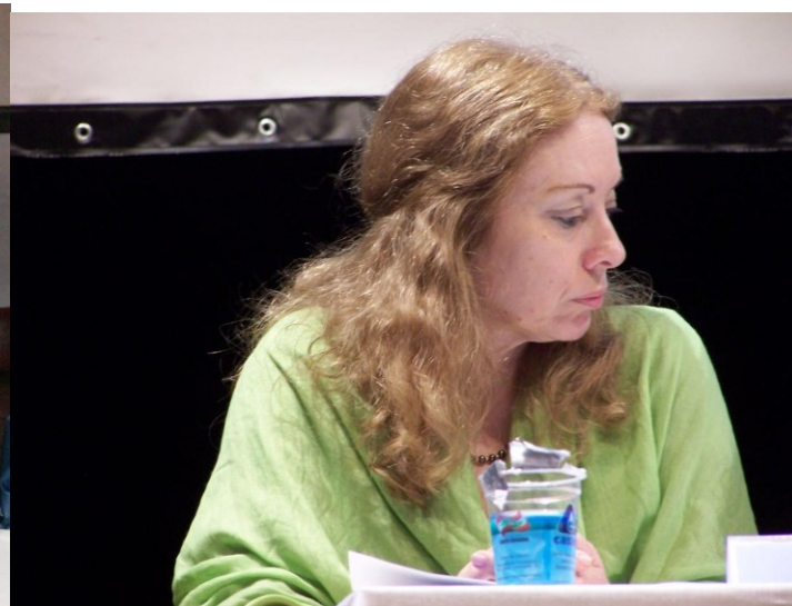
13º BRASIL 2010 (FLORIPA)