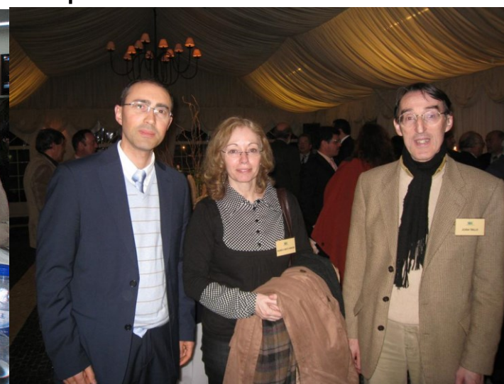
17º Lagoa 2012