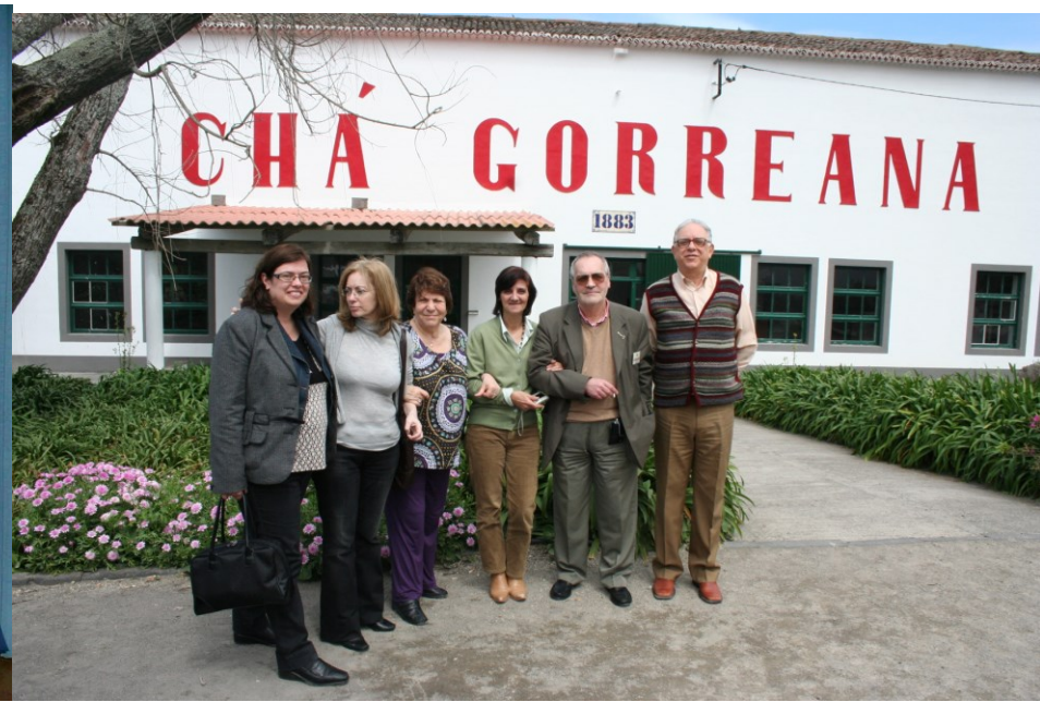
11ª LAGOA) 2009