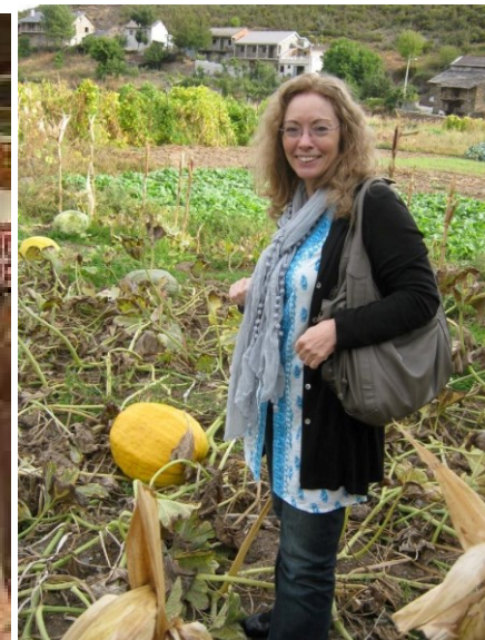
14º Bragança 2010