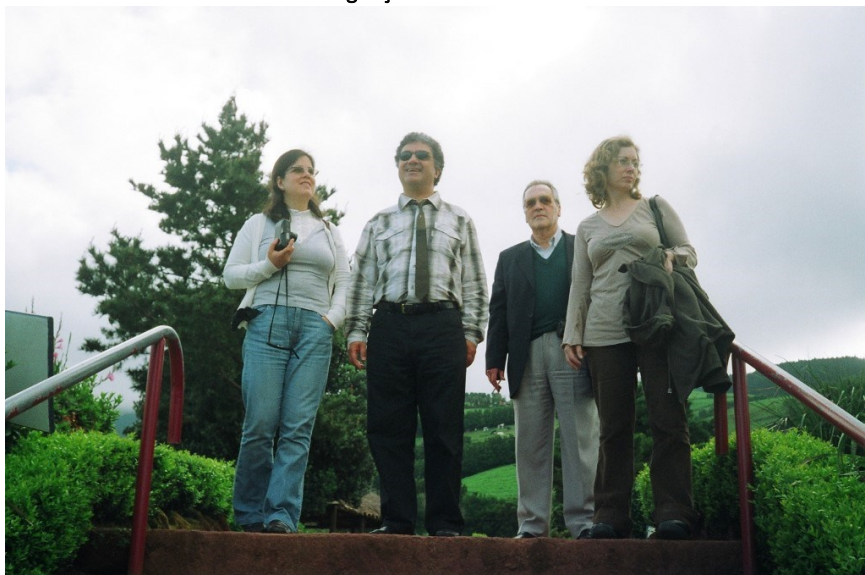
7º Ribeira Grande 2007