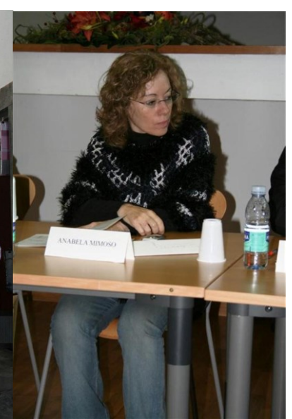
8º BRAGANÇA 2007