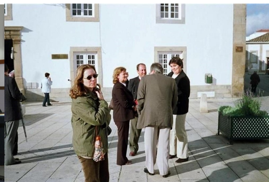
6º Bragança 2006