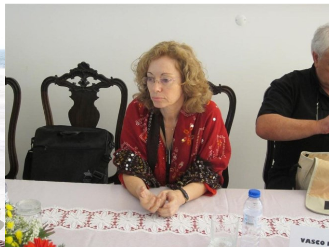
VILA DO PORTO 2011