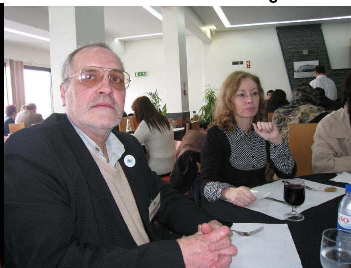
17º Lagoa 2012