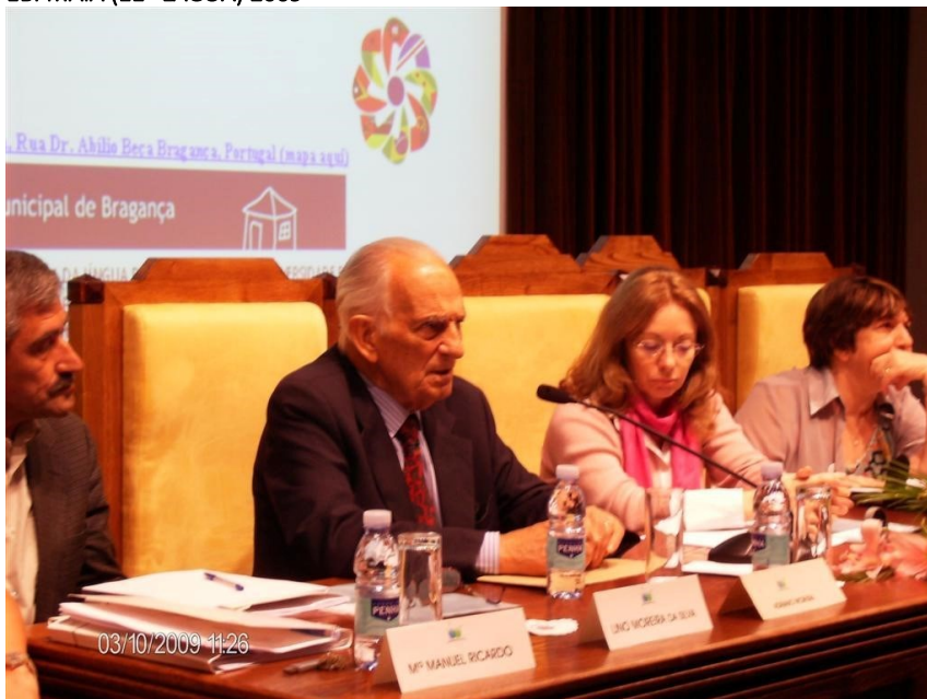
12ª BRAGANÇA 2009