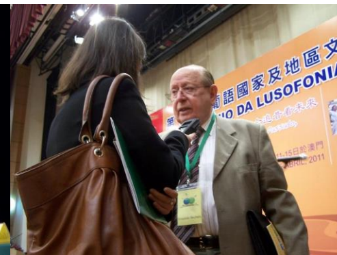
15º MACAU 2011

OUÇA-O AQUI NO 15º EM MACAU 2011 HTTPS://WWW.YOUTUBE.COM/WATCH?V=AjWYEzVMx8&t=0s&index=264&list=PLWJUYRYOUWOKYMKAIEPZIF1C_4TVTKER