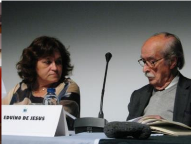
26º LOMBA DA MAIA 2016 32º GRACIOSA 2019