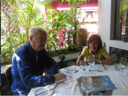
30ª PICO 2018