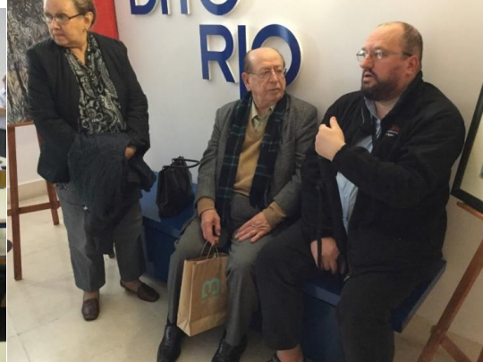
29º BELMONTE 2018