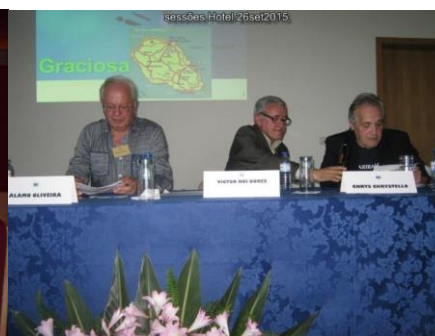
24º GRACIOSA 2015