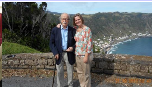
28º VILA DO PORTO 2017