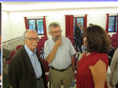
26º LOMBA DA MAIA 2016