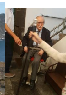
32º GRACIOSA 2019

Desempenhou, além da docência, diversos cargos, entre os quais o de subdiretor de uma escola técnica (Nuno Gonçalves) e diretor de outra (Cesário Verde).