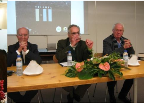
BGA ANGRA 2017