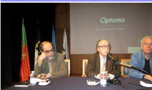
17º LAGOA 2012