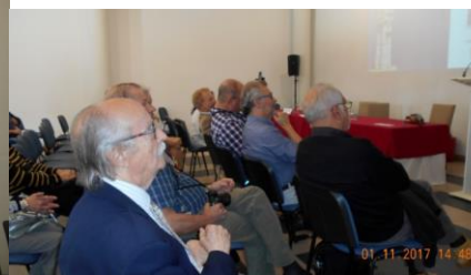
28º VILA DO PORTO 2017