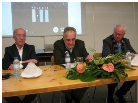
BGA ANGRA 2013