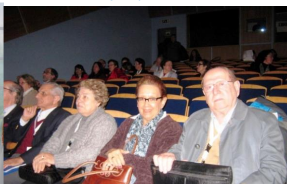
17º LAGOA 2009