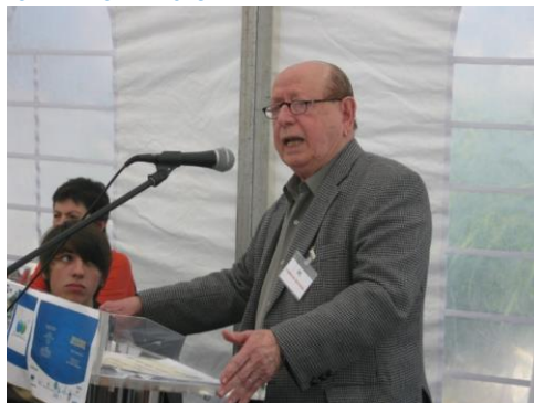
21º MOINHOS 2014