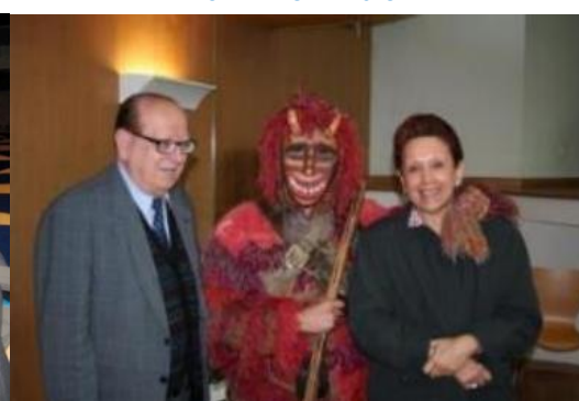
8º BRAGANÇA 2007