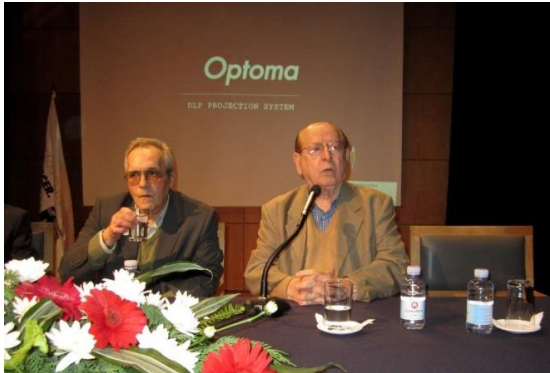
17º LAGOA 2012