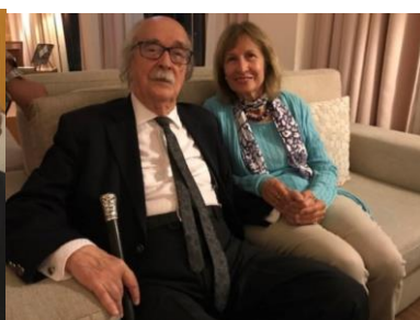
32º GRACIOSA 2019