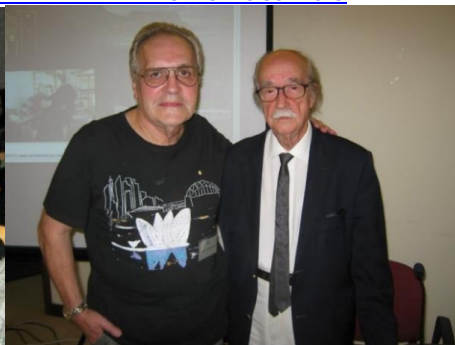
26º LOMBA DA MAIA 2016