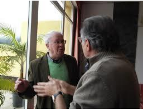
19º MAIA 2013