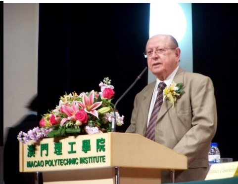
15º MACAU 2011