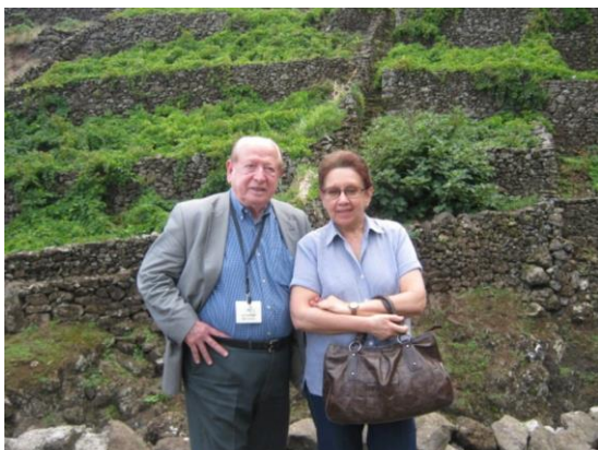
16º SANTA MARIA 2011