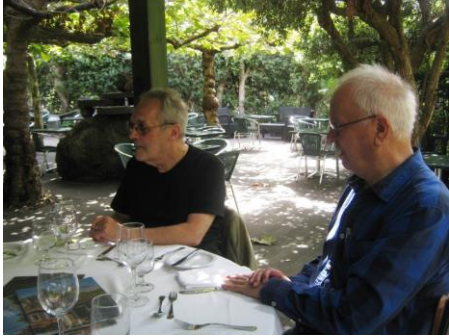
30ª PICO 2018