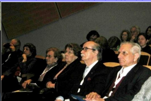
17º LAGOA 2012