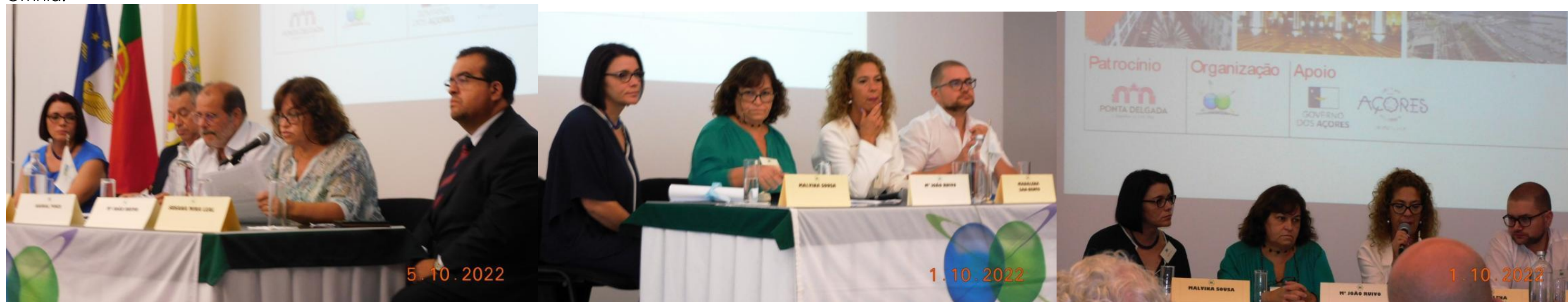
36° PDL 2022