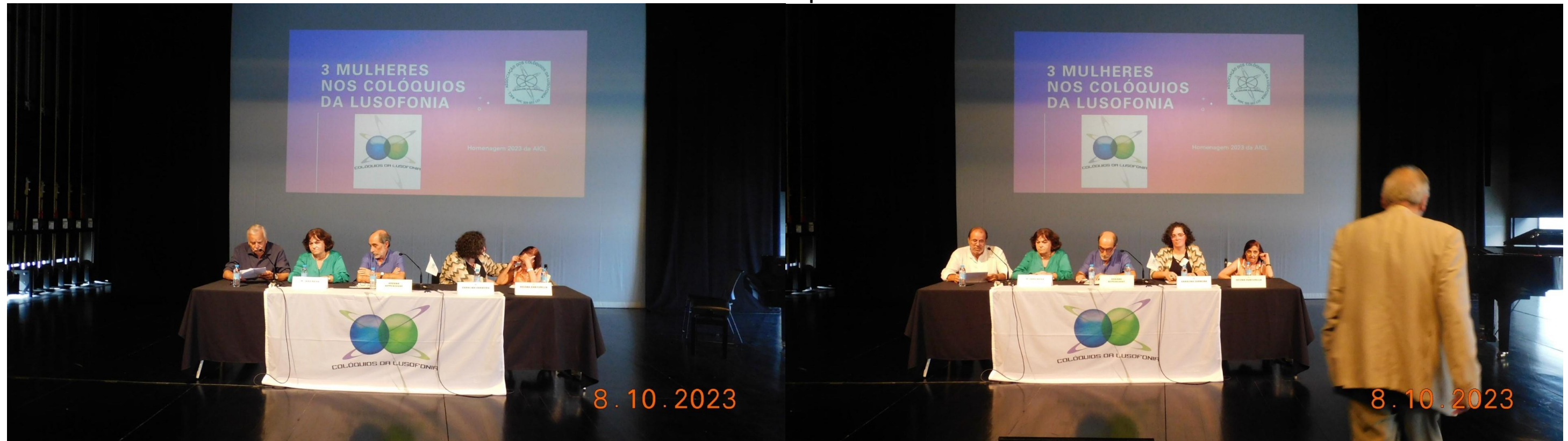
38° Ribeira Grande 2023