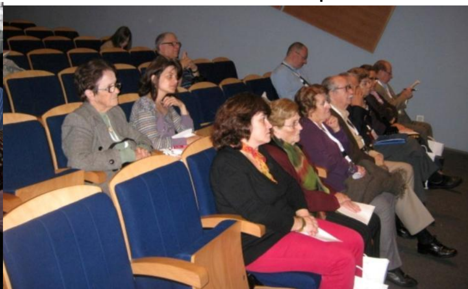
17º LAGOA 2012