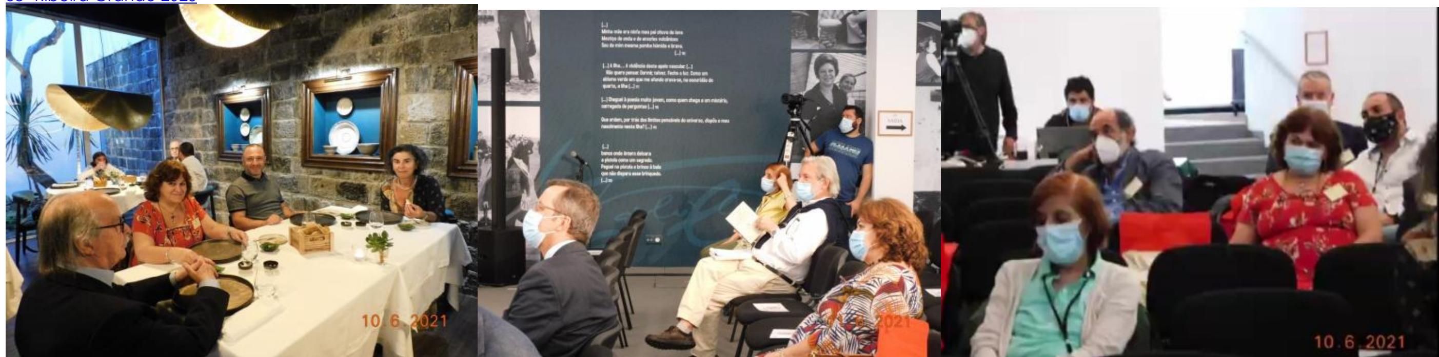
34° PDL 2021