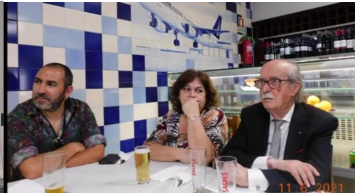
36° PDL 2022