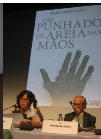
30º PICO 2018