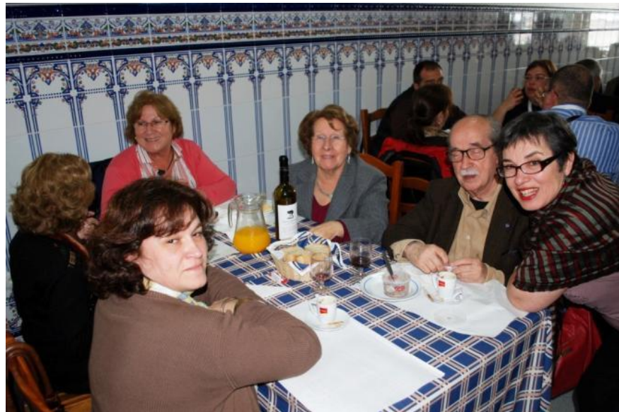
17º LAGOA 2012