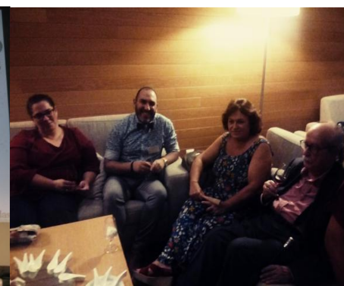
32º GRACIOSA 2019