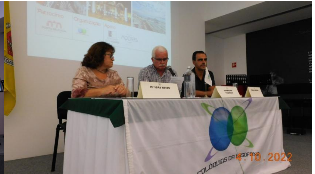
36° PDL 2022