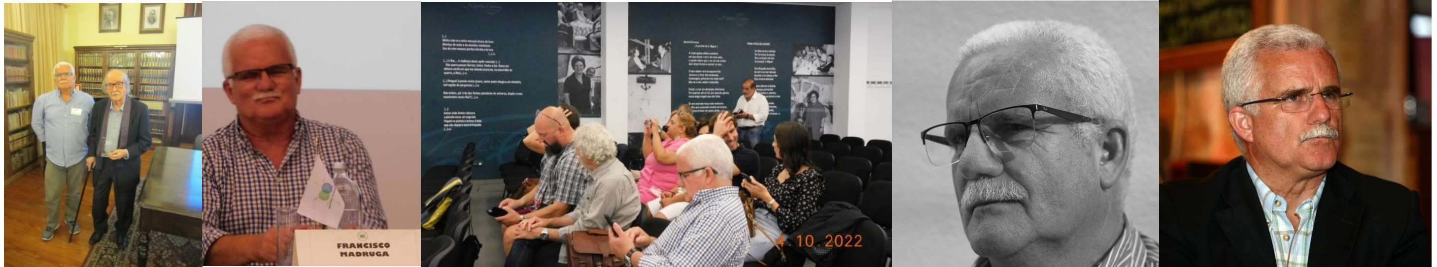
36º PDL 2022