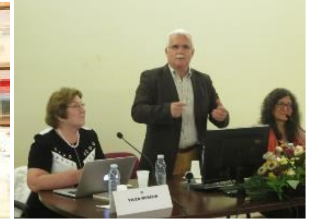
26º LOMBA DA MAIA 2016