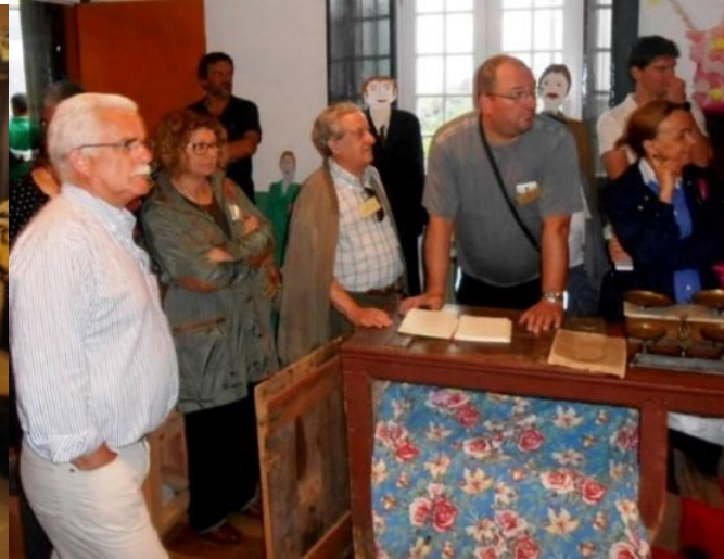
24º GRACIOSA 2015