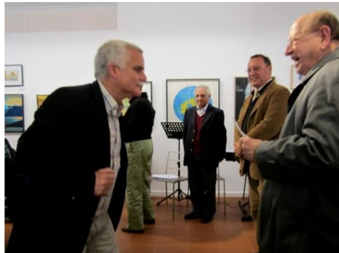
17º LAGOA 2012