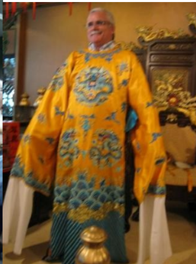
15º Macau 2011