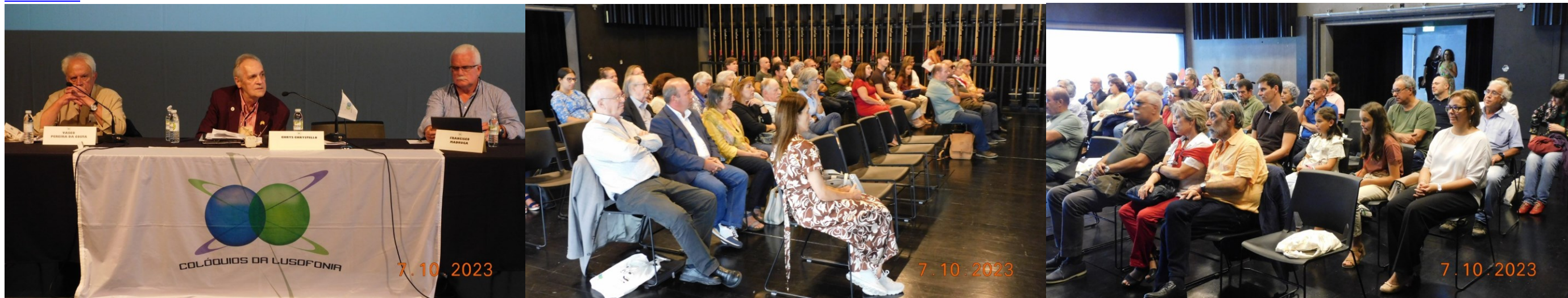
38º Ribeira Grande 2023