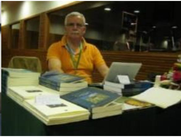
15º Macau 2011