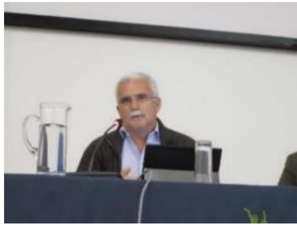
23º FUNDÃO 2015