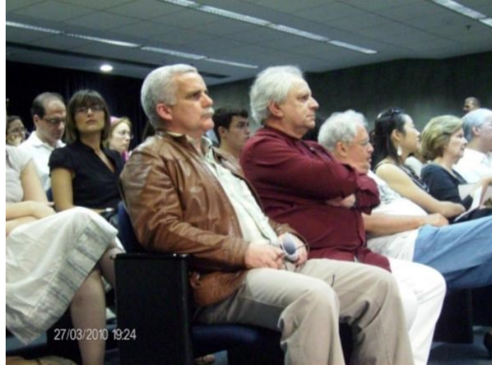
13º Brasília 2010