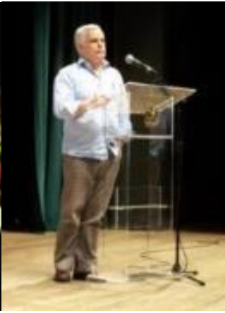
13º Floripa 2010