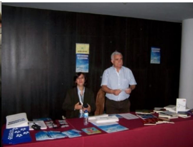
18º GALIZA 2012