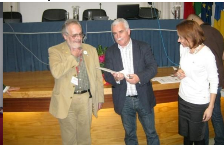
20º SEIA 2013