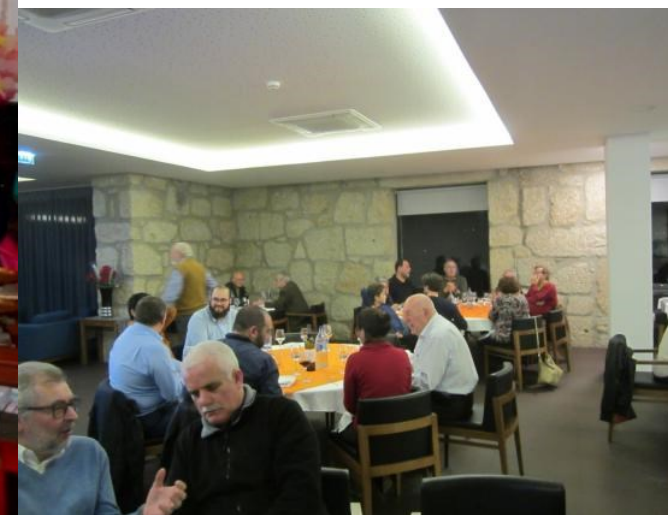
29º BELMONTE 2018