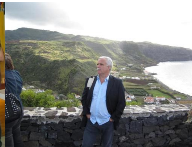
VILA DO PORTO 2011

Foi membro da Direção da APEL - Associação Portuguesa de Editores e Livreiros durante 2 mandatos.