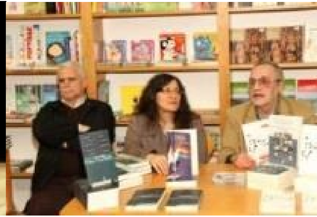
26º PDL 2013