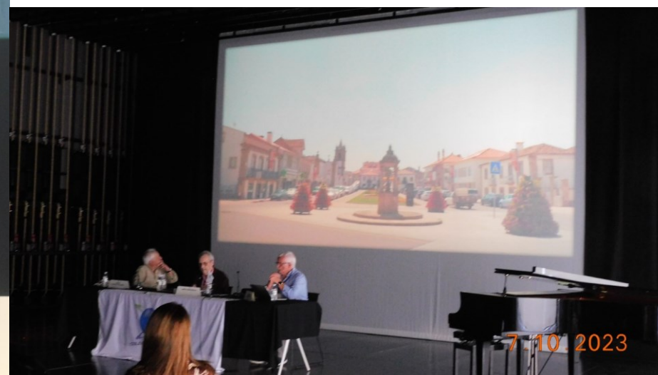
38º Ribeira Grande 2023