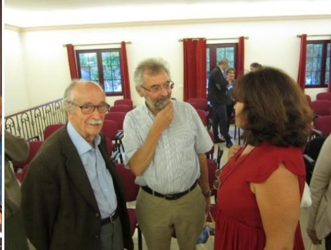
26º LOMBA DA MAIA 2016