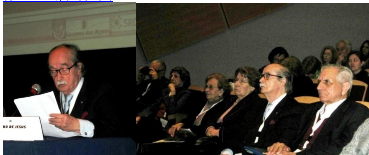
17º LAGOA 2012