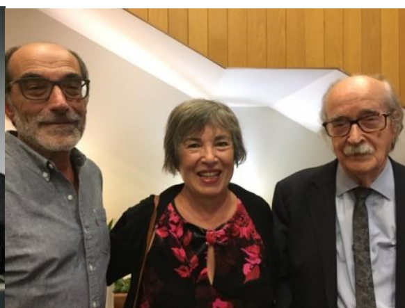
32º GRACIOSA 2019