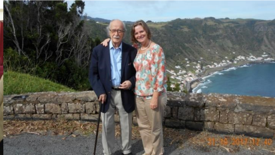
28º VILA DO PORTO 2017