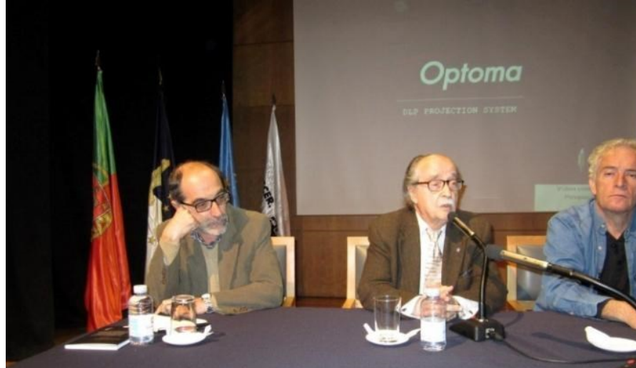
17º LAGOA 2012