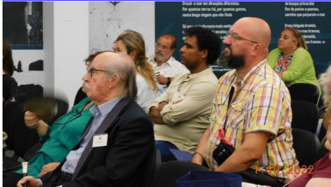
36º Ponta Delgada 2022-