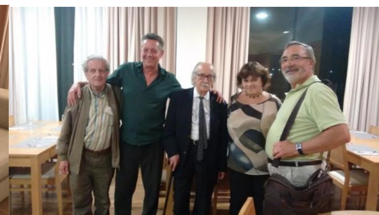
32º GRACIOSA 2019