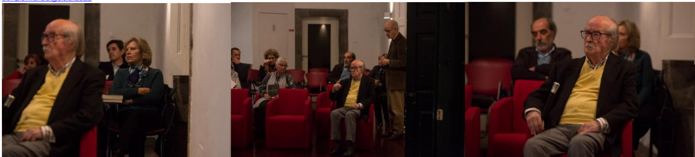
50 anos de vida literária do chrys nov 2022