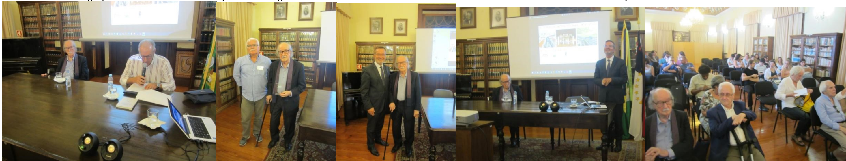
36º ponta delgada 2022

Presidente da delegação de Lisboa da "Associação dos Antigos Alunos do Liceu Antero de Quental" e Presidente da A.G. da Casa dos Açores em Lisboa