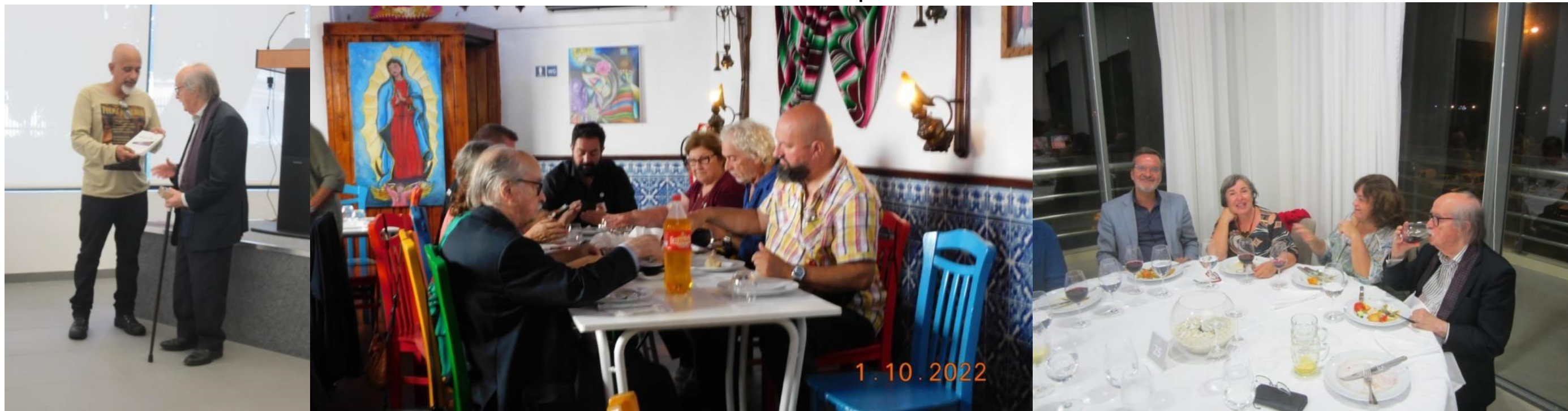
36º Ponta Delgada 2022

. (2021) COMO TENUÍSSIMA ESPUMA DE LUZ, POÉTICA FRAGMENTÁRIA. ILUST. ARTUR BOAL, ED. NONA POESIA