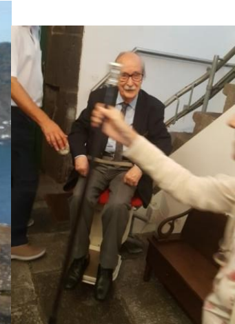
32º GRACIOSA 2019