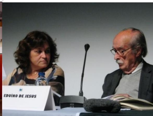
26º LOMBA DA MAIA 2016