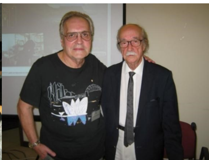
26º LOMBA DA MAIA 2016