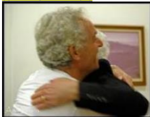
vila do porto 2011