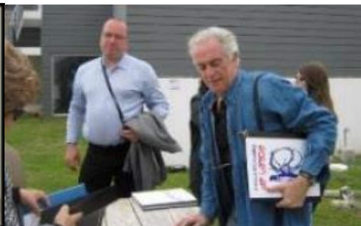
17º Lagoa 2012