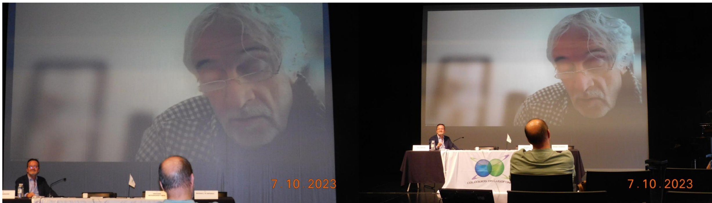
38º RIBª GRANDE 2023