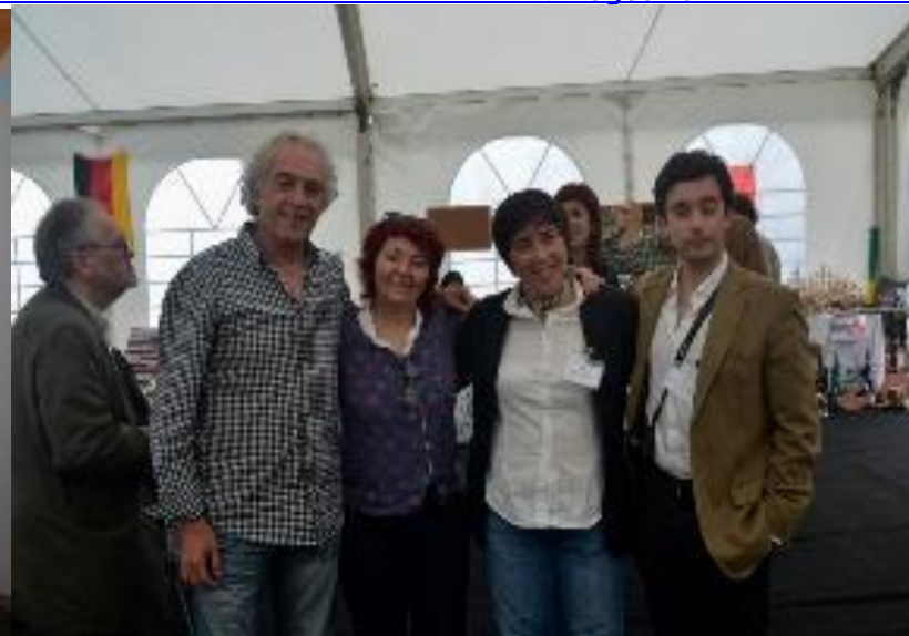
PORTO FORMOSO 2014