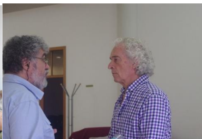
VILA DO PORTO 2017