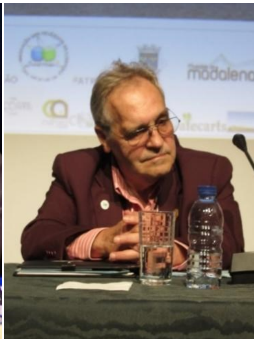
30º MADALENA DO PICO 2018