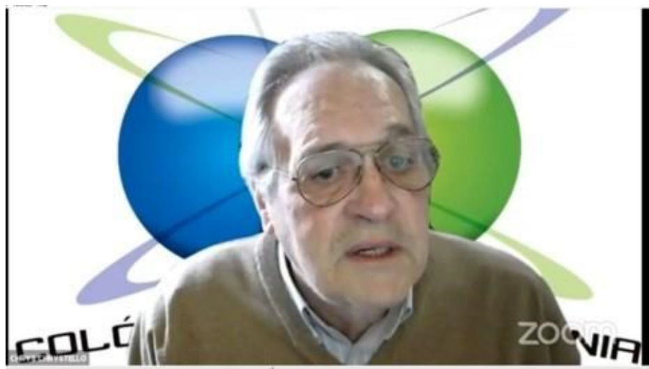
33º Belmonte 2021