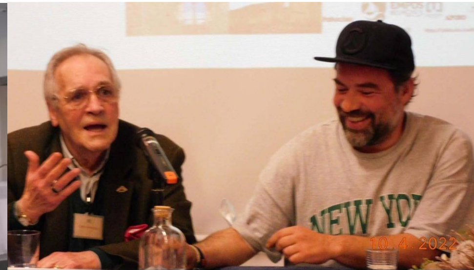
35º BELMONTE 2022