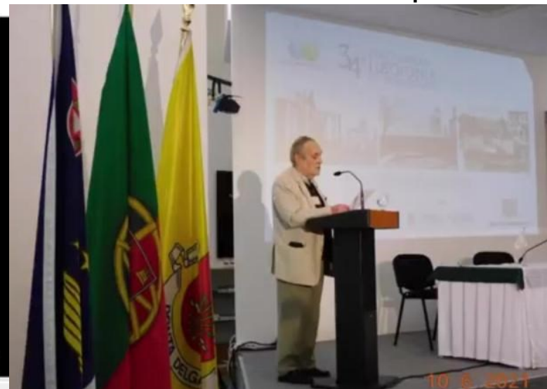
34º PDL 2021