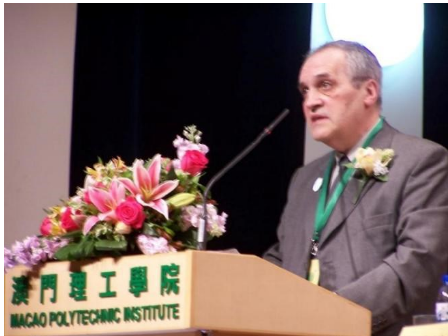
15º MACAU 2011