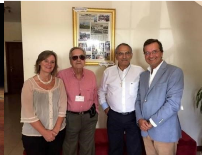
26º LOMBA DA MAIA 2016