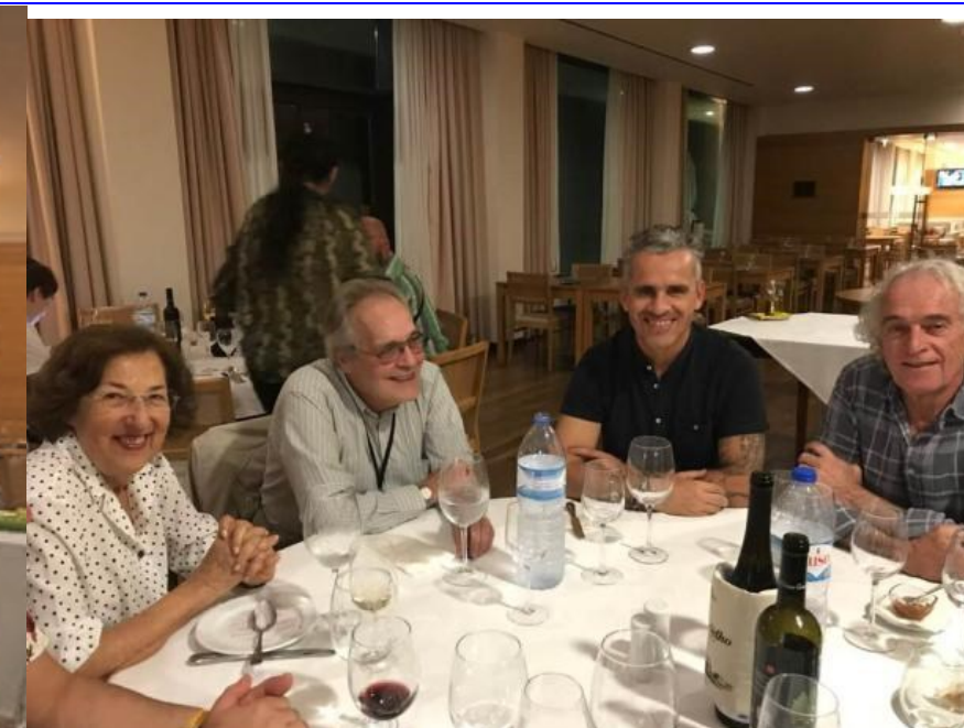
32º GRACIOSA 2019