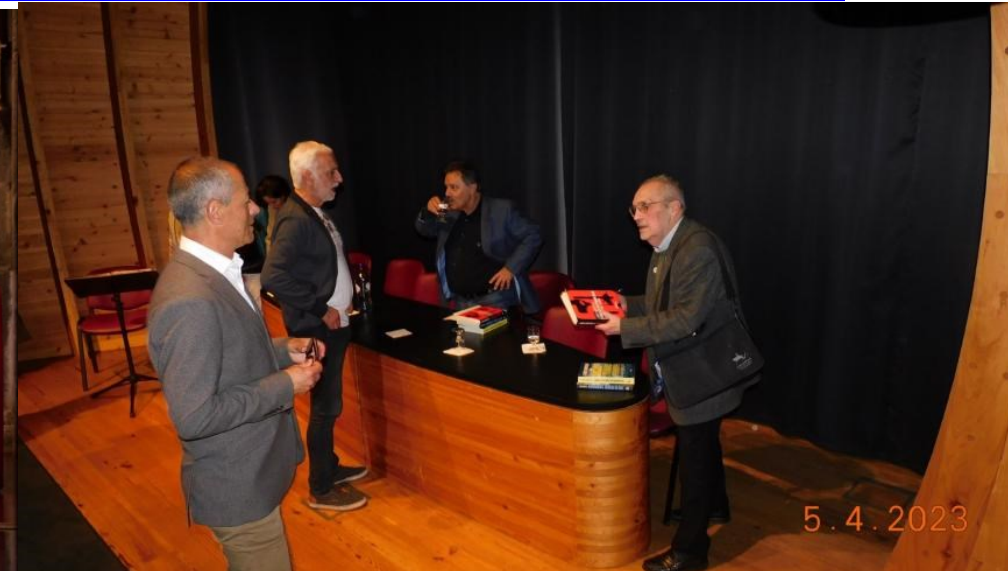
PICO, LAJES, 50 ANOS DE VIDA LITERÁRIA