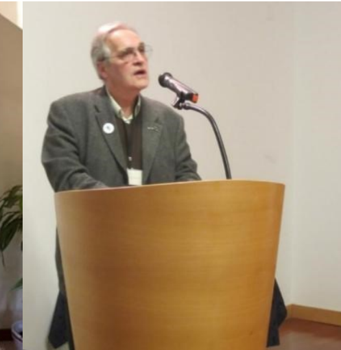
29º BELMONTE 2018