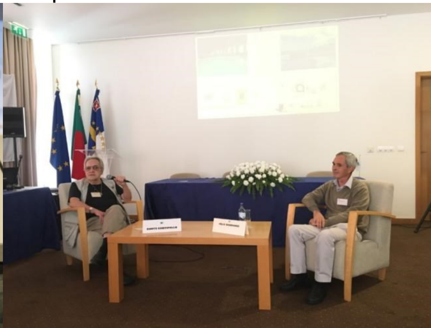
32º GRACIOSA 2019