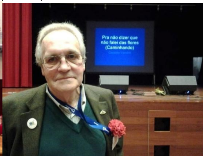
25º MONTALEGRE 2016