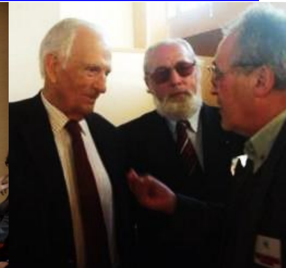
12º BRAGANÇA 2008