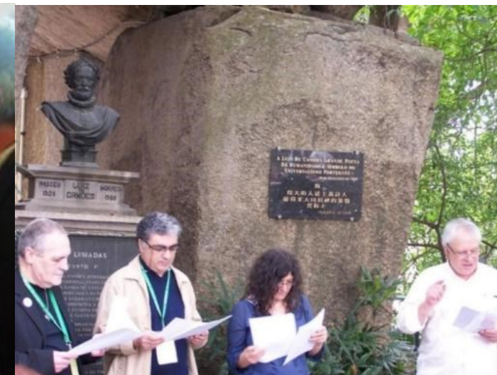
POESIA, GRUTA DE CAMÕES 15º colóquio Macau 2011