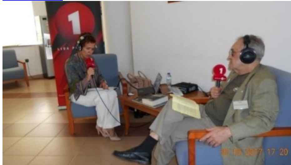
28º VILA DO PORTO 2017