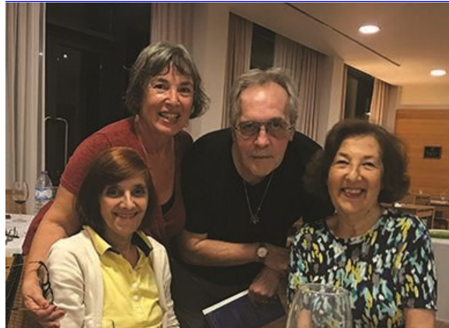
32º GRACIOSA 2019