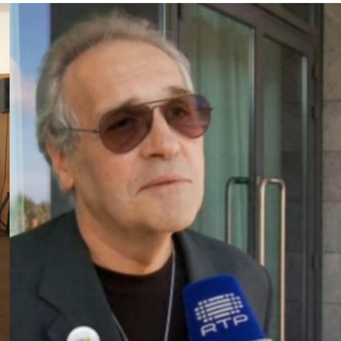
24º Graciosa 2015

Foi Mentor dos finalistas de Literatura da ACL da University of Brighton (UK 2000-2012);