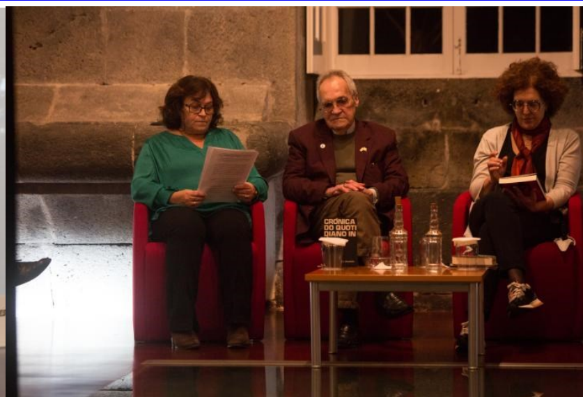
BPARD PDL 50 ANOS DE VIDA LITERÁRIA