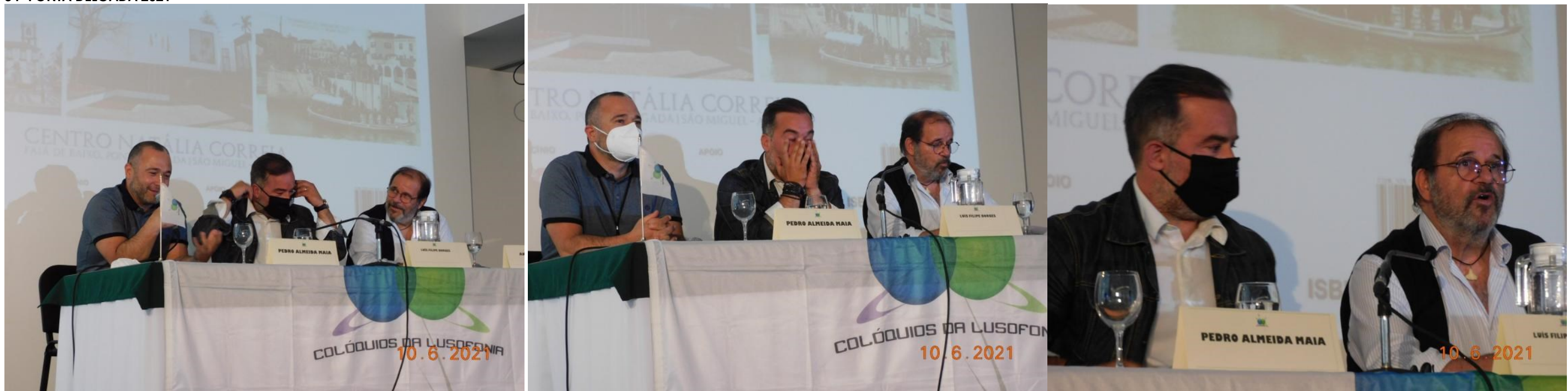
34º PONTA DELGADA 2021