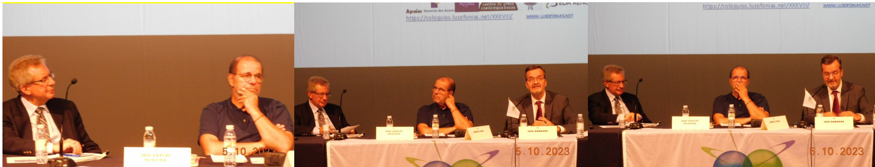
38º Ribeira Grande 2023