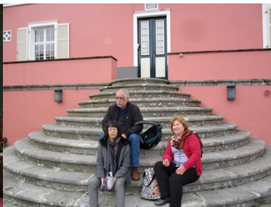
19º MAIA 2013