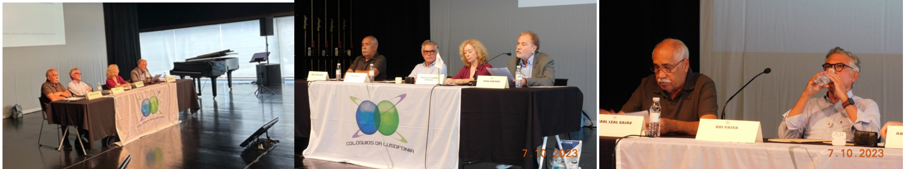
38º RIBEIRA GRANDE 2023