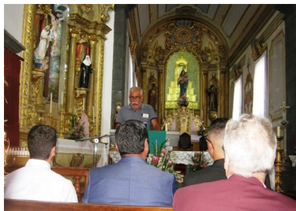
30º MADALENA DO PICO 2018