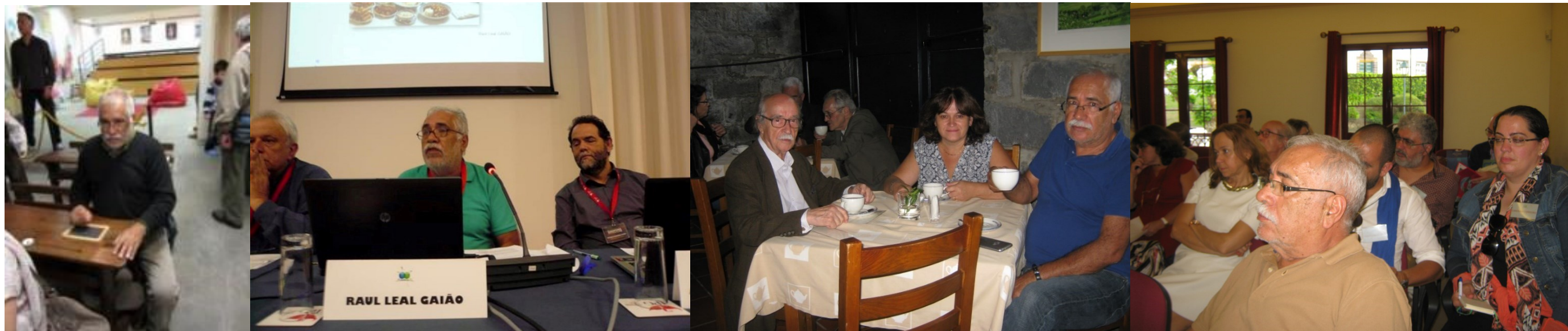
22º SEIA 2014