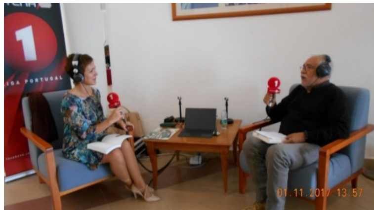
28º VILA DO PORTO 2017