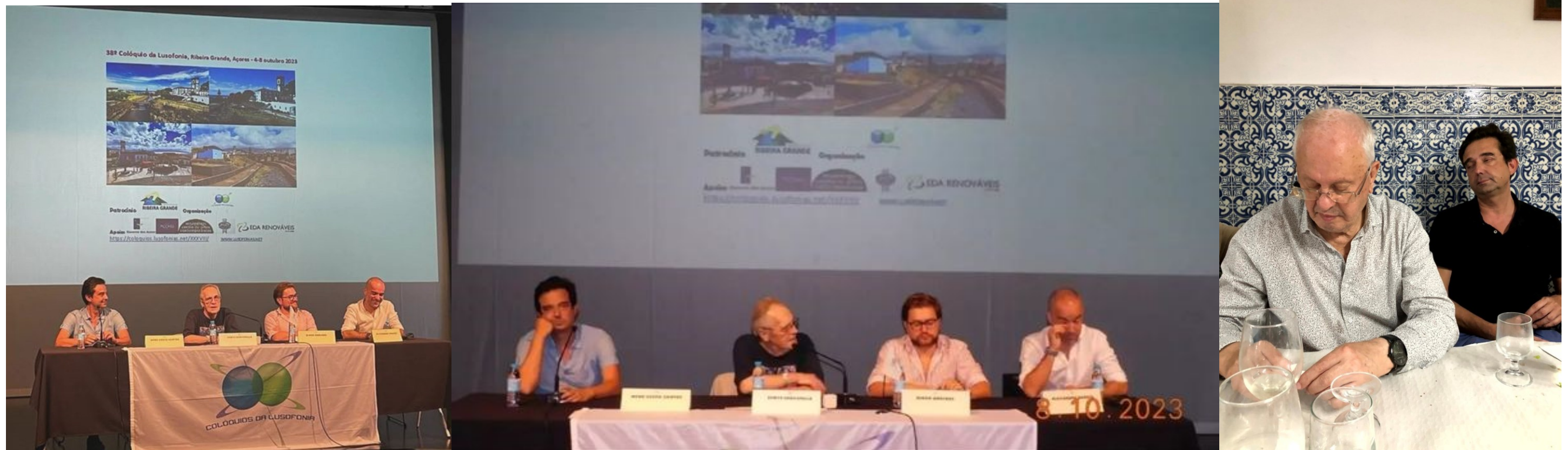
38º Ribeira Grande 2023

"Céu Nublado com Boas Abertas", escolhido para representar Portugal, em 2017, no Festival do Primeiro Romance (Chambery, França).