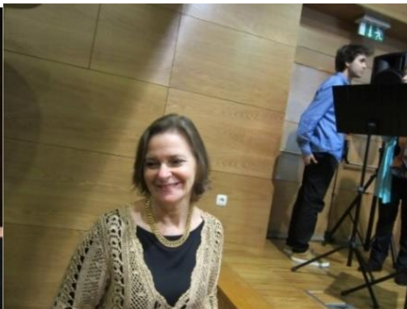
29º BELMONTE 2018