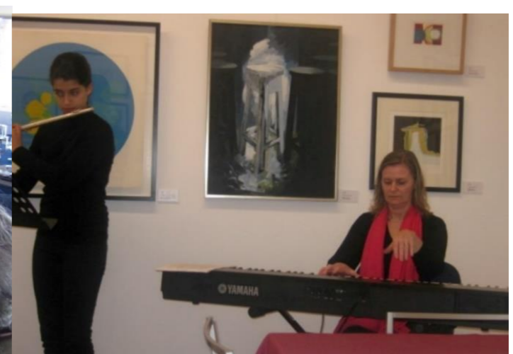
17º LAGOA 2012