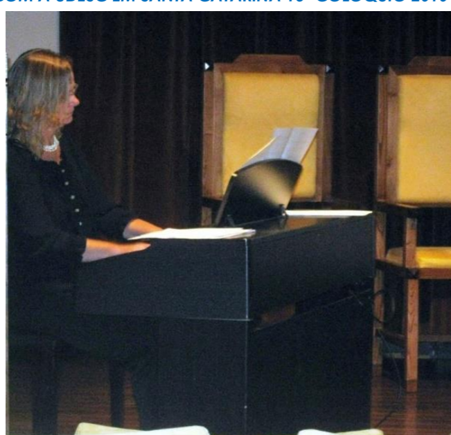
12º BRAGANÇA 2009