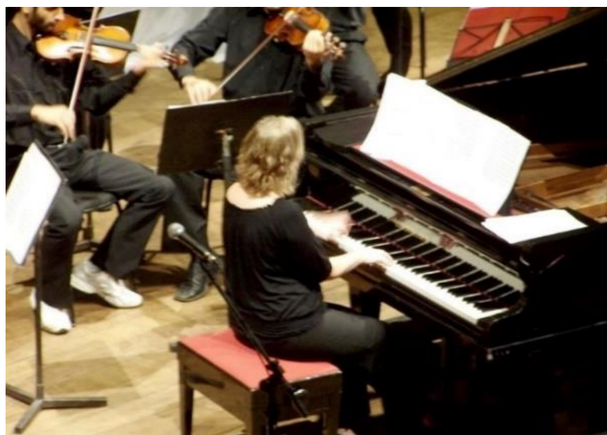
COM A UDESC EM SANTA CATARINA 13º COLÓQUIO 2010