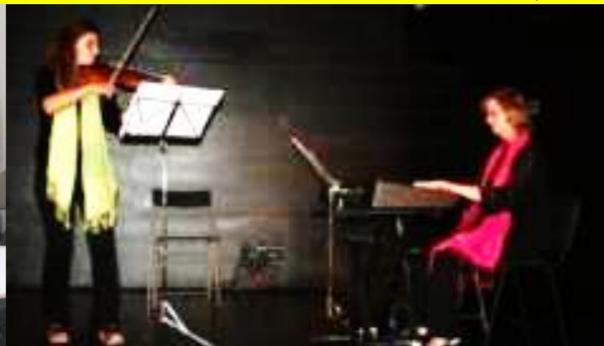
18º GALIZA 2012