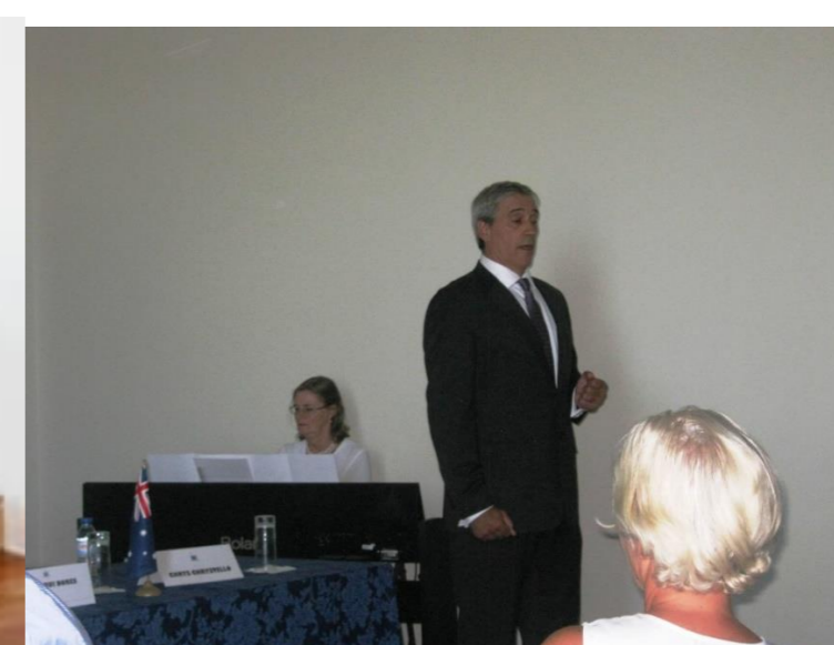
24º Graciosa 2015