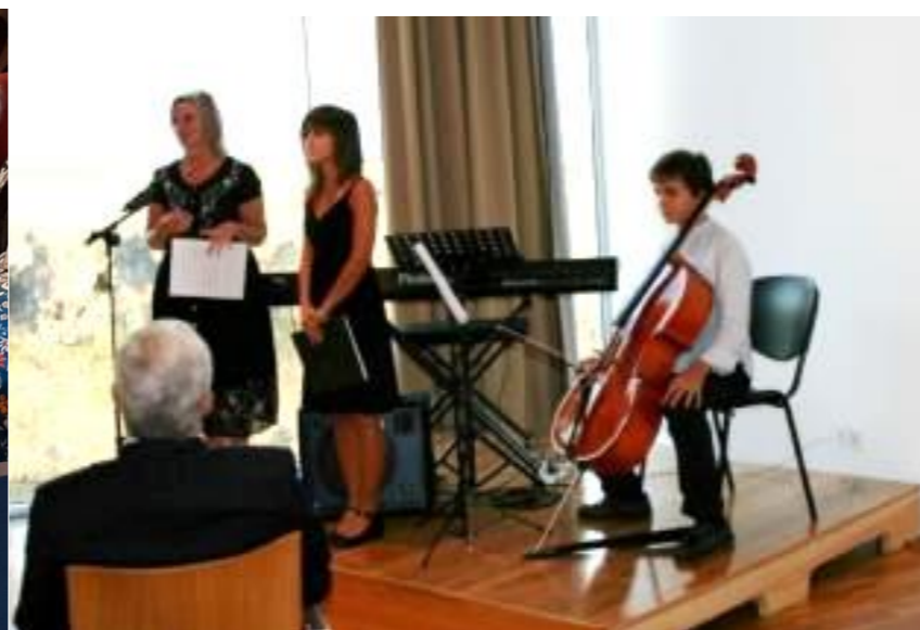
16º STA Mª 2011