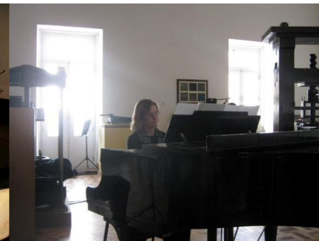
23º FUNDÃO 2015