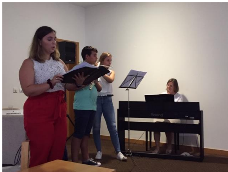
32º GRACIOSA 2019