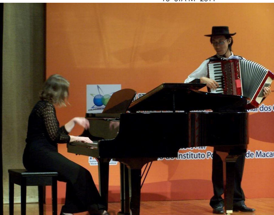
15º COLÓQUIO IPM (MACAU) 2011