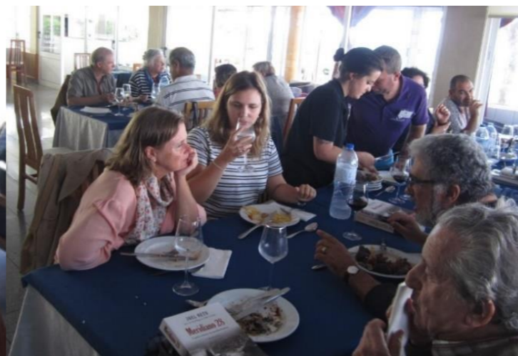
30º MADALENA DO PICO 2018