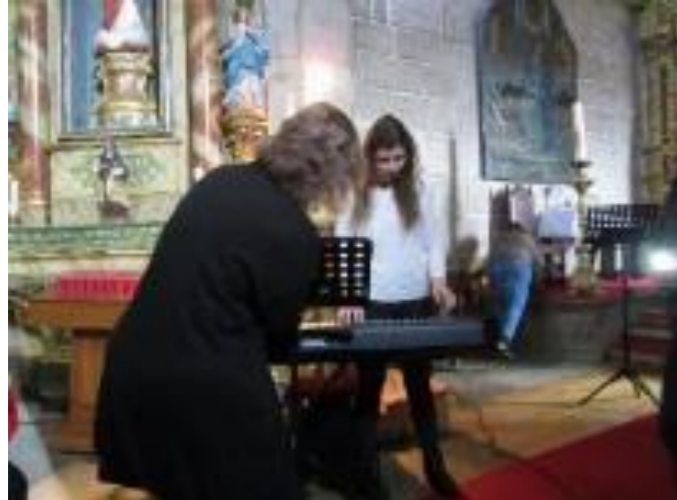
25º MONTALEGRE 2016

https://www.lusofonias.net/documentos/aicl-imagens-sons-dos-col%C3%B3quios/1351-20%2BA-2013-seia-7-m%C3%BAsica-ilhas-de-bruma.html https://studio.youtube.com/#/video/rX46kTudgRQ/analytics https://studio.youtube.com/#/video/d-aWci0FKN0/analytics https://studio.youtube.com/#/video/DhLaweHFsX0/analytics https://studio.youtube.com/#/video/H1sKSQ-vK2U/analytics https://www.youtube.com/watch?v=H1sKSQ-vK2U&t=1s&index=16&list=PLwUyRyOUwOKiC_SKWjM3dQrE3-GiG17a https://www.youtube.com/watch?v=rX46kTudgRQ&t=0s&index=15&list=PLwUyRyOUwOKiC_SKWjM3dQrE3-GiG17a https://www.youtube.com/watch?v=G8-FfRk2S&t=0s&index=17&list=PLwUyRyOUwOKiC_SKWjM3dQrE3-GiG17a https://www.youtube.com/watch?v=DhLaweHFsX0&t=0s&index=18&list=PLwUyRyOUwOKiC_SKWjM3dQrE3-GiG17a https://www.youtube.com/watch?v=0tOshvYW6G8&t=1s&index=85&list=PLwUyRyOUwOKyMkaiepZif1C_4vtkeRI