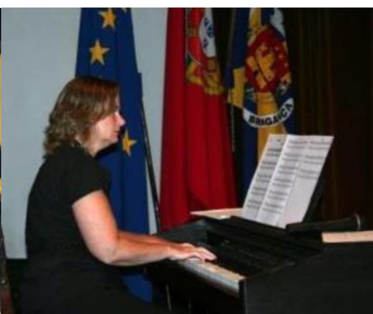
14º BRAGANÇA 2010