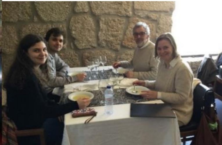
29º BELMONTE 2018