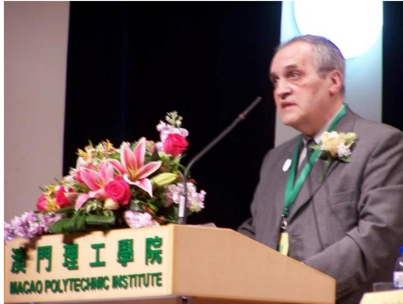
15º MACAU 2011