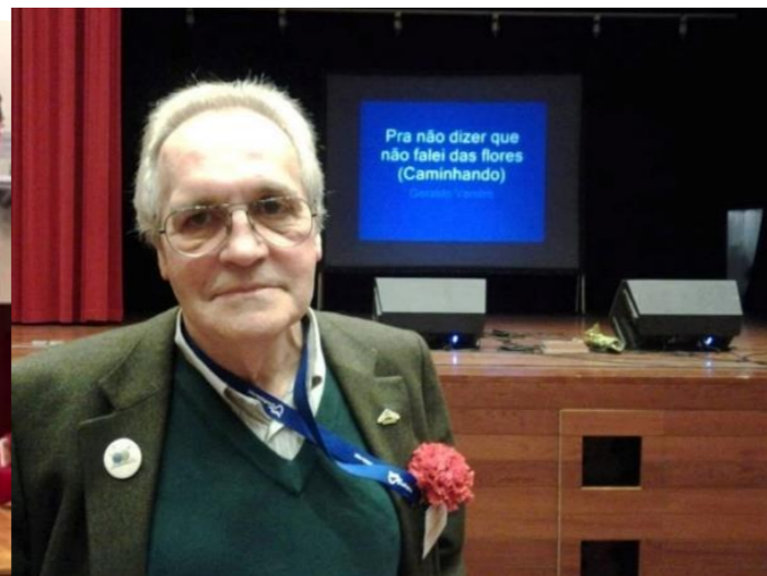
25º MONTALEGRE 2016