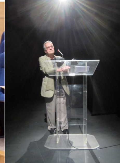
30º MADALENA DO PICO 2018