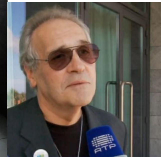
24º GRACIOSA 2015