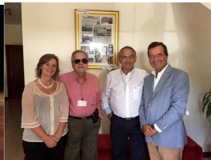
29º BELMONTE 2018