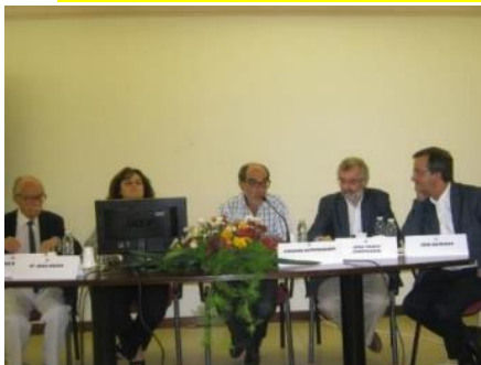
LOMBA DA MAIA 2016