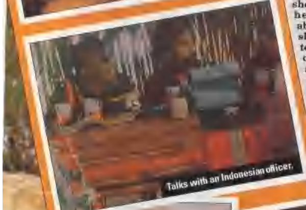
Talks with an Indonesian officer.