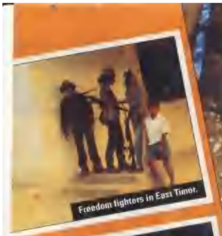
Freedom fighters in East Timor.