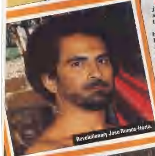
Revolutionary Jose Ramos-Horta.