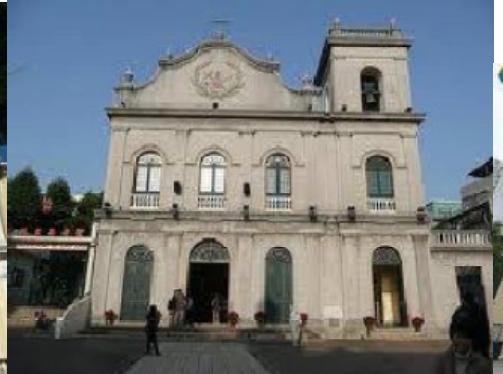
igreja são lázaro