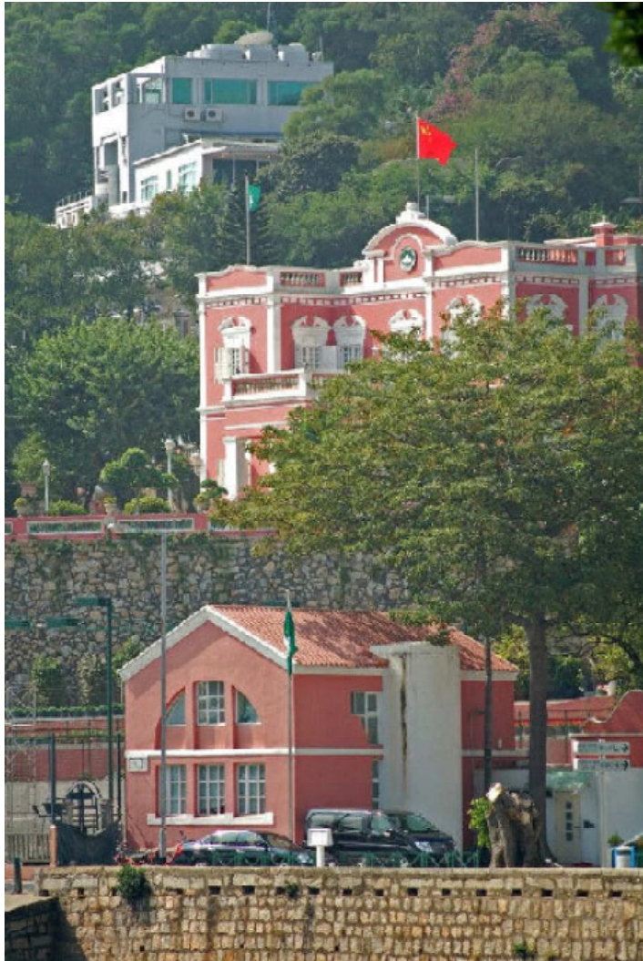
palacete Santa Sancha, sede do governo da RAEM