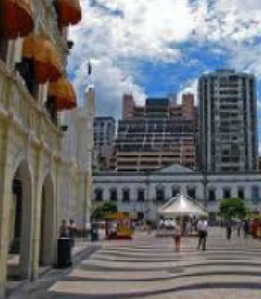
largo do senado