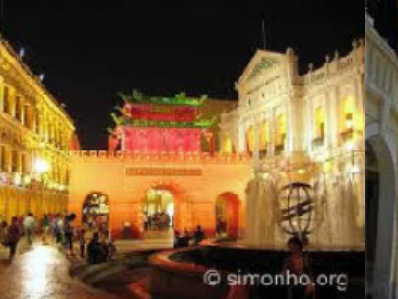
largo do senado