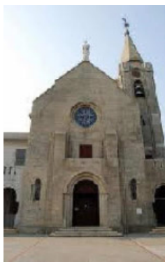
igreja da penha