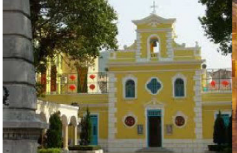
largo do senado