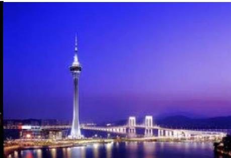
torre de macau