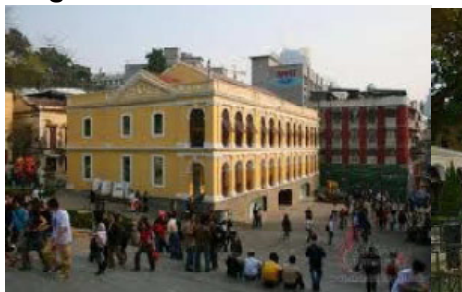
largo do senado