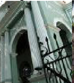
teatro dom pedro v