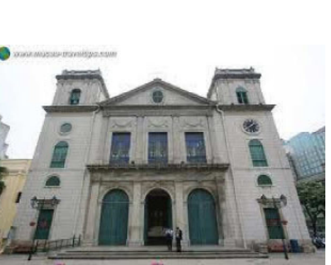
catedral de macau