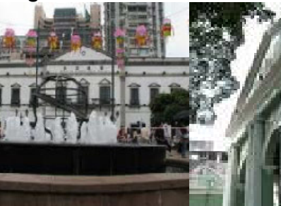
largo do senado