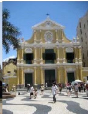
igreja são domingos