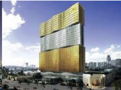
grand macau casino