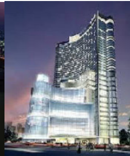
crown macau casino