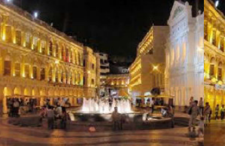
largo do senado