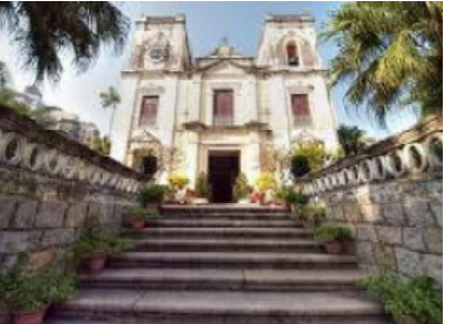
igreja são lourenço