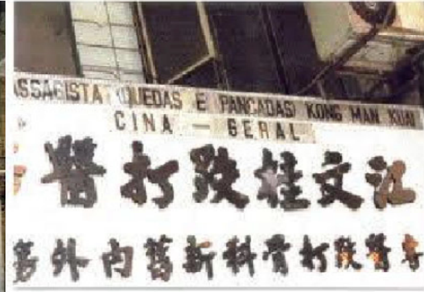
Massagista de quedas e pancadas