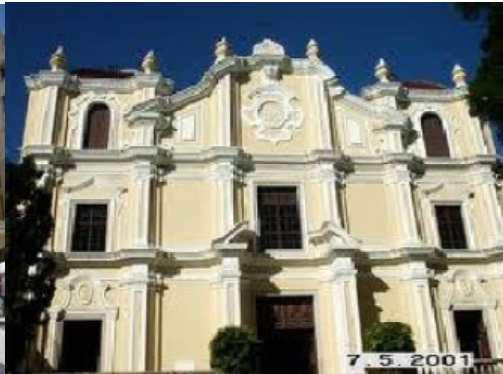
seminário de são josé