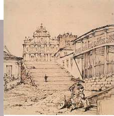
Ruínas de São Paulo, George Chinnery (1774-1852) construída em 1602 e destruída por um incêndio em 1835. Somente a fachada sul chegou aos dias de hoje.