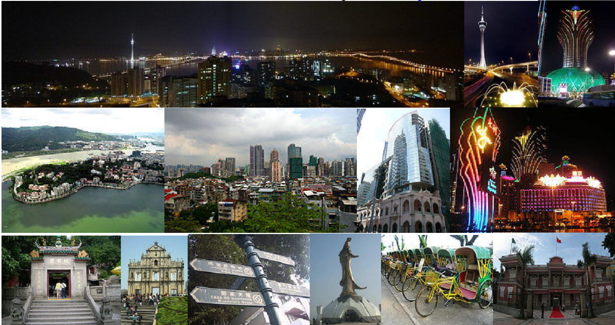
tempo de A'Ma