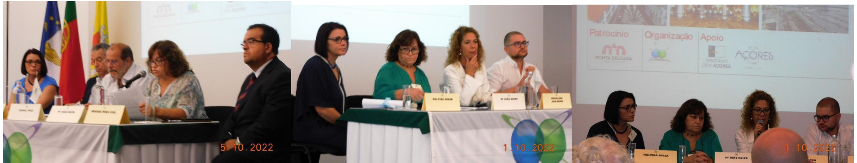
36° PDL 2022