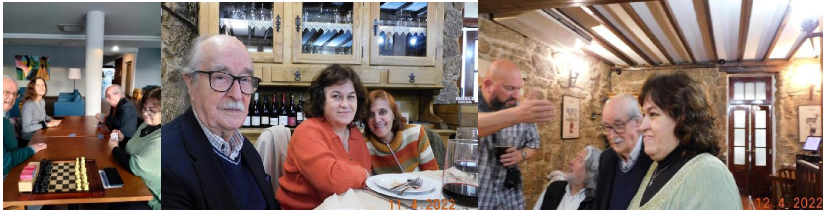
35º Belmonte 2022

(2022). Pré-apresentação de "Crónica do Quotidiano Inútil, vols 1 a 6, 50 anos de vida literária" de J Chrys Chrystello, Atas do 34º colóquio da lusofonia Ponta Delgada