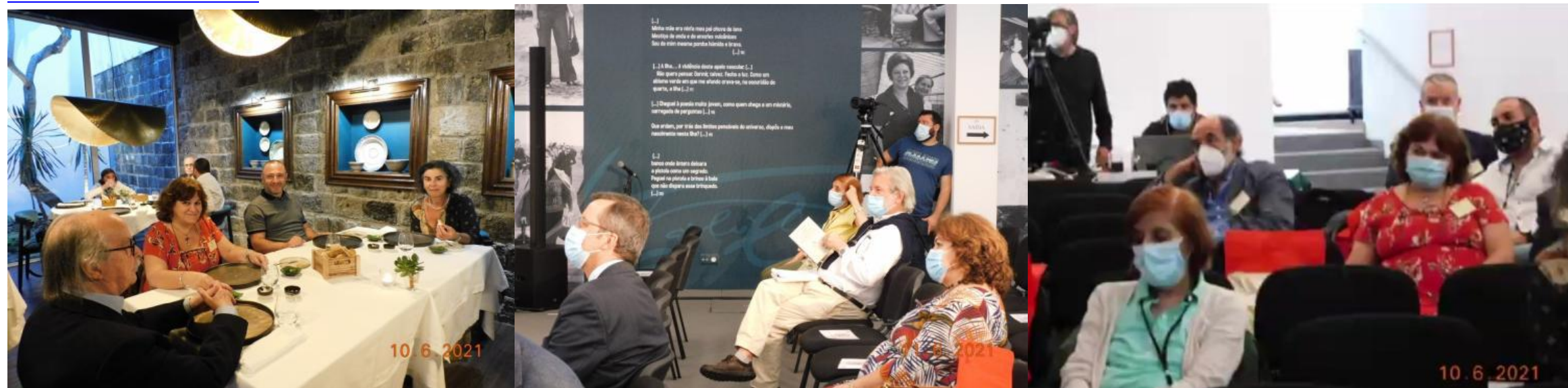
34º PDL 2021