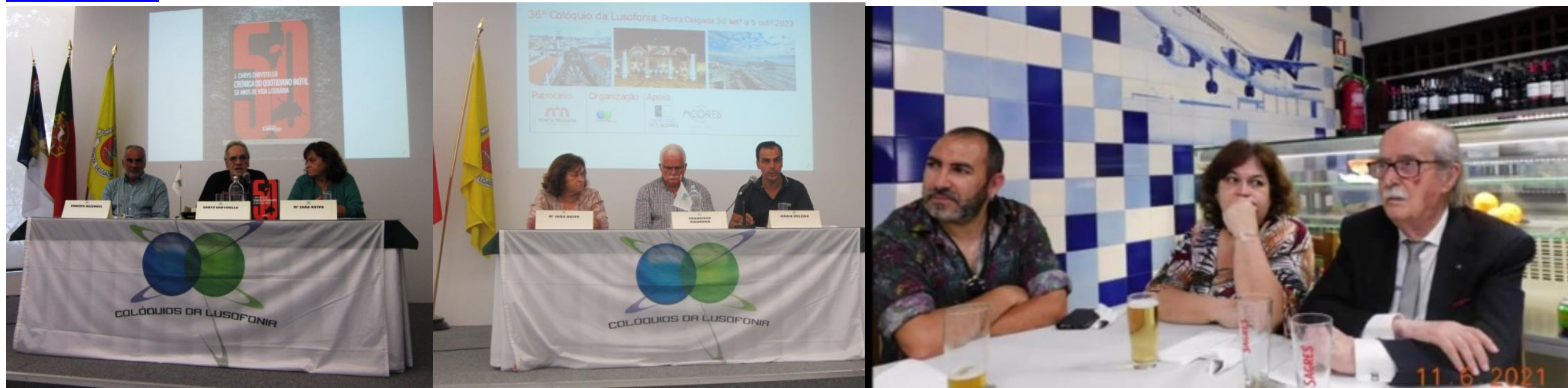
36º PDL 2022