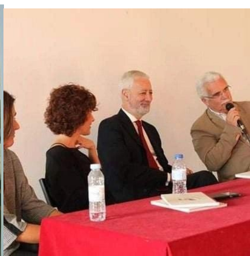
29º BELMONTE 2018