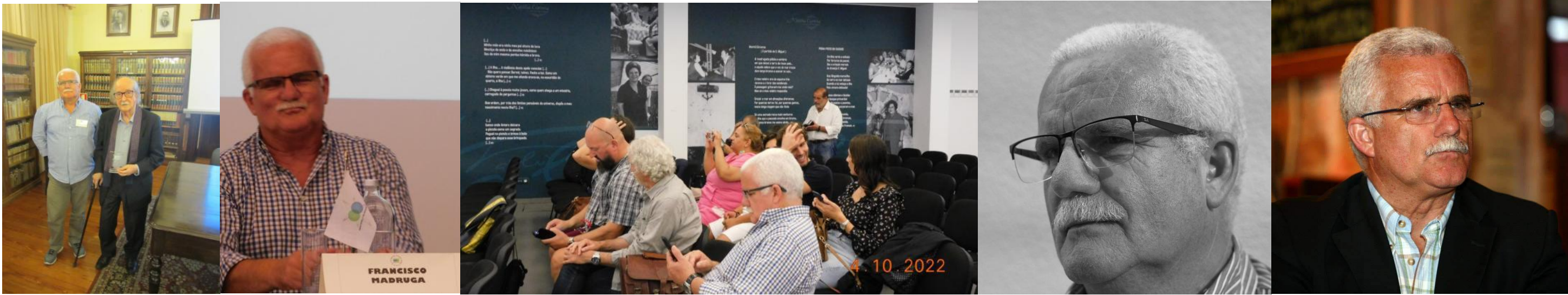
36º PDL 2022