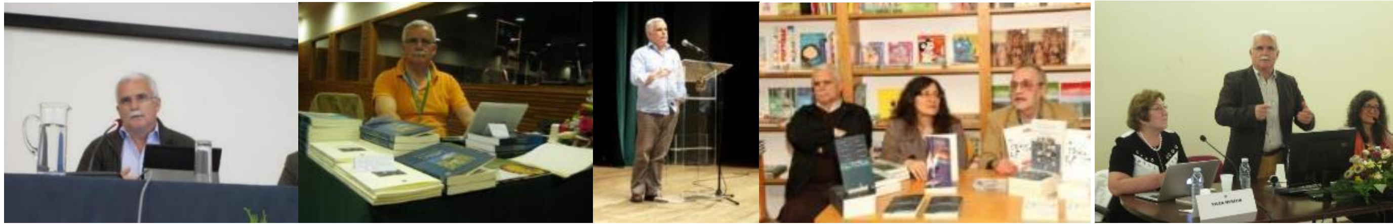
23º FUNDÃO 2015