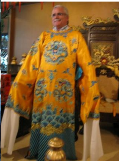
15º Macau 2011