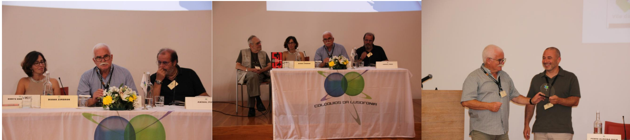
39º STA Mª 2024