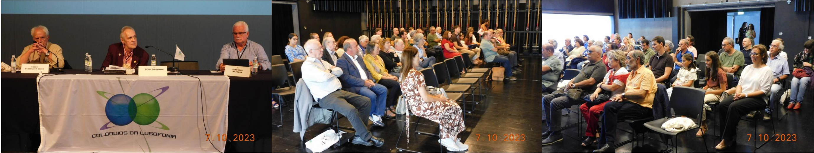
38º Ribeira Grande 2023