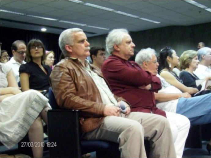
13º Brasília 2010