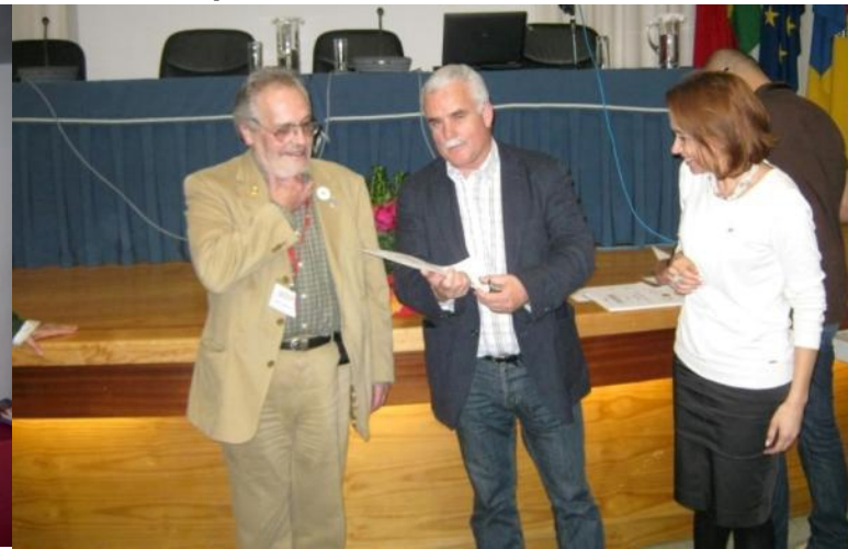
20º SEIA 2013