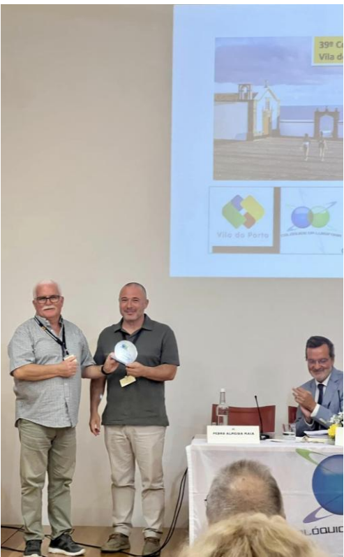
39º Santa Maria 2024