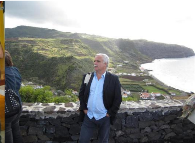
16º VILA DO PORTO 2011