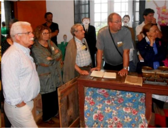
24º GRACIOSA 2015