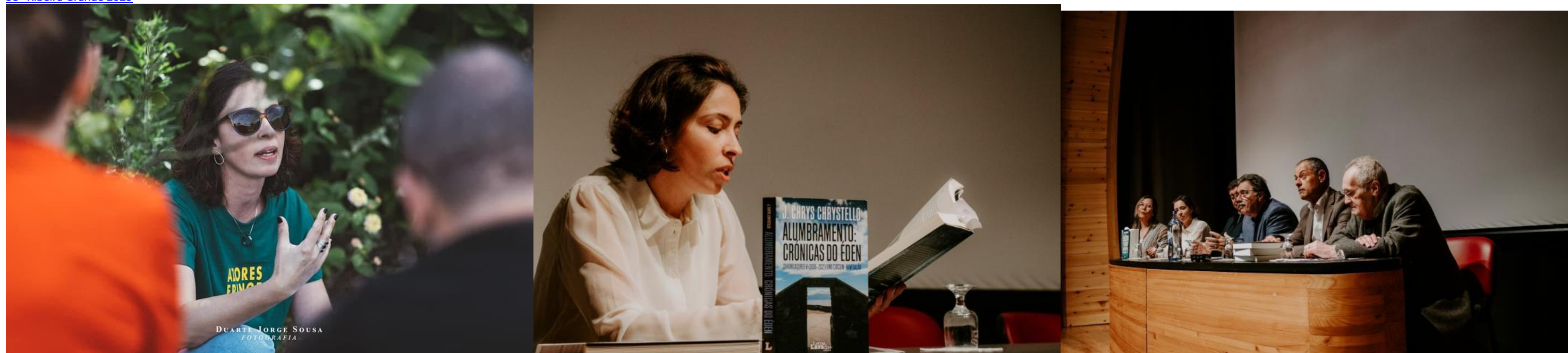
APRESENTAÇÃO 50 anos de vida literária do chrys pico, lajes 5 abr 2023

Diana Zimbron nasceu em 1984, na ilha Terceira.