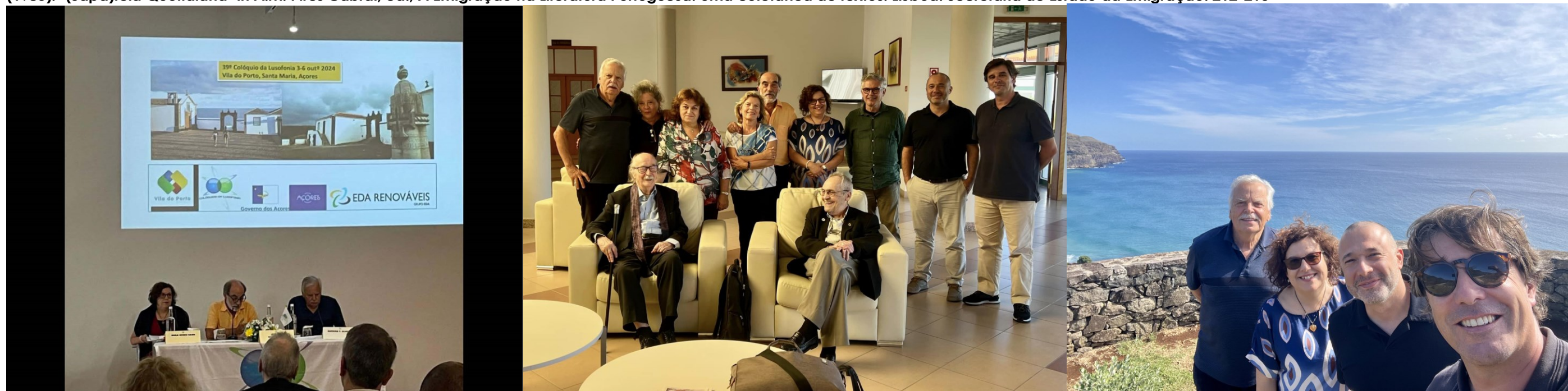
39º STA Mº 2024

(1985). "(Sapa)teia Quotidiana" in A.M. Pires Cabral, ed., A Emigração na Literatura Portuguesa: Uma coletânea de textos . Lisboa: Secretaria de Estado da Emigração: 212-215