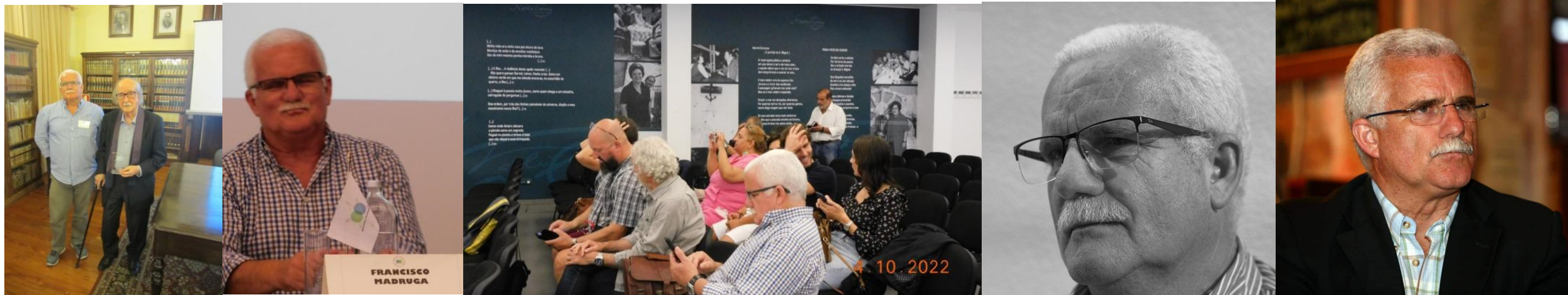
36º PDL 2022