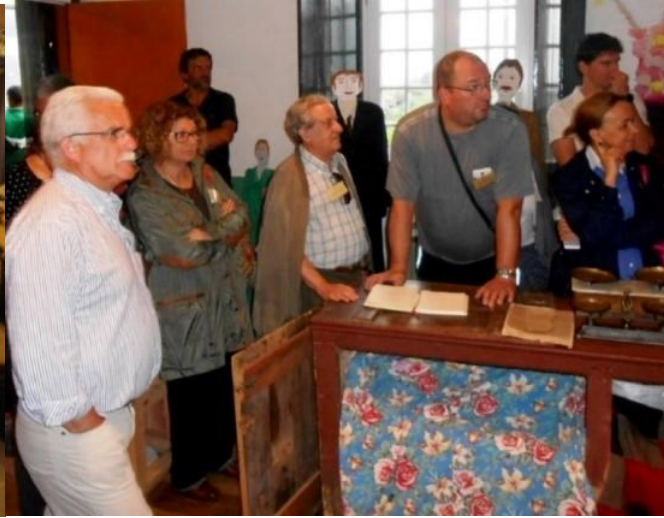
24º GRACIOSA 2015