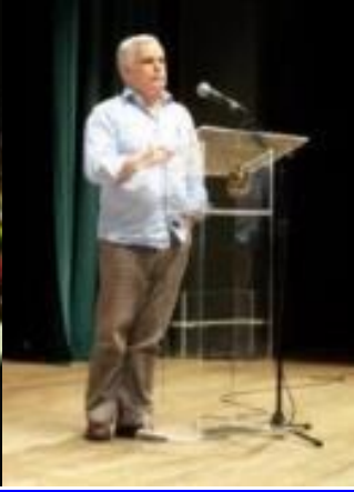
13º Floripa 2010