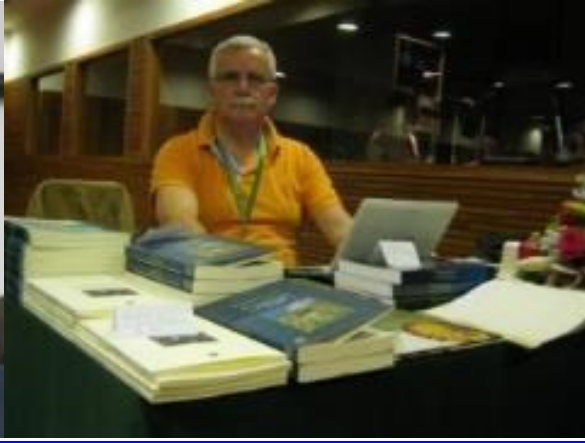
15º Macau 2011