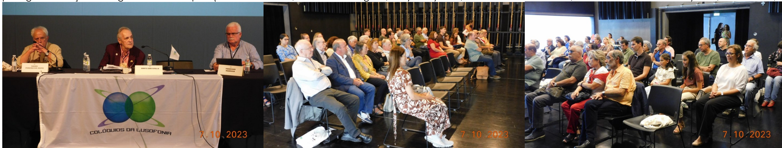
38º Ribeira Grande 2023