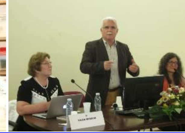
26º LOMBA DA MAIA 2016