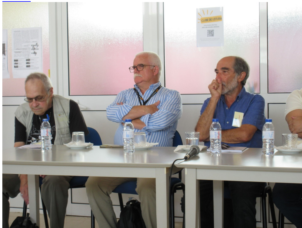
39° STA M° 2024