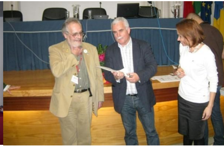
20° SEIA 2013