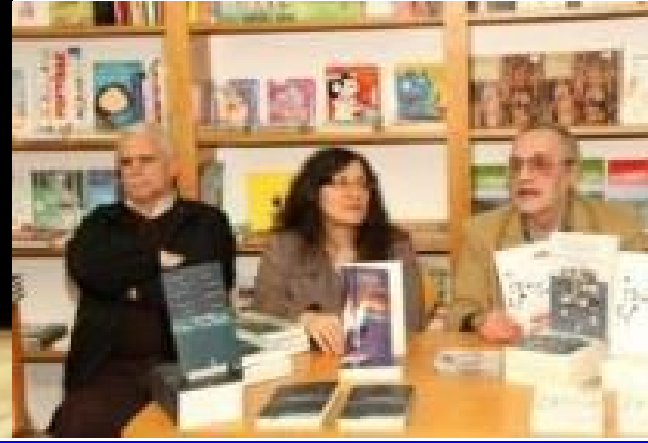
26º PDL 2013