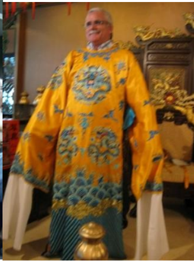
15º Macau 2011