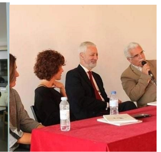
29º BELMONTE 2018

PARTICIPOU NA HOMENAGEM A HELENA CHRYSTELLO