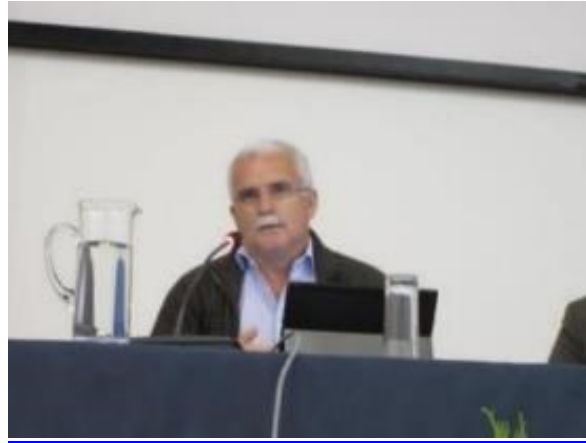
23º FUNDÃO 2015