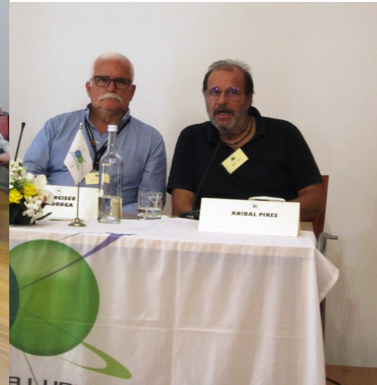
39º Santa Maria 2024