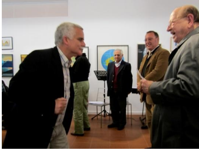
17° LAGOA 2012