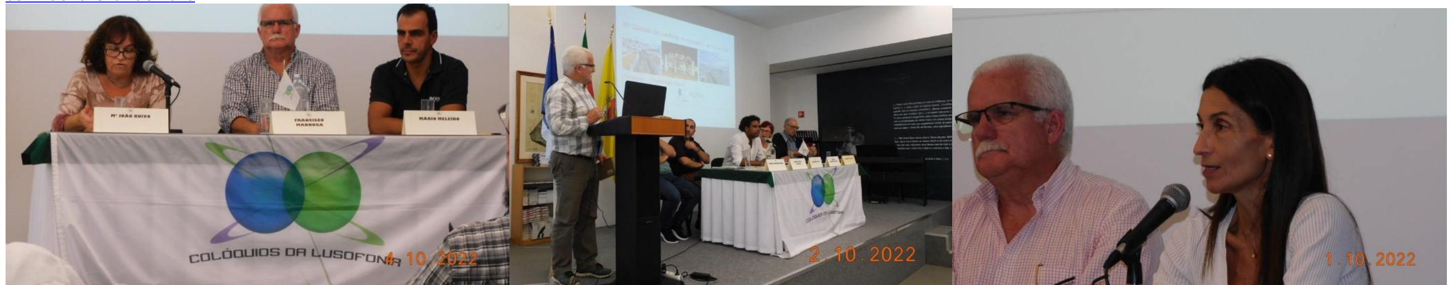
36° PDL 2022