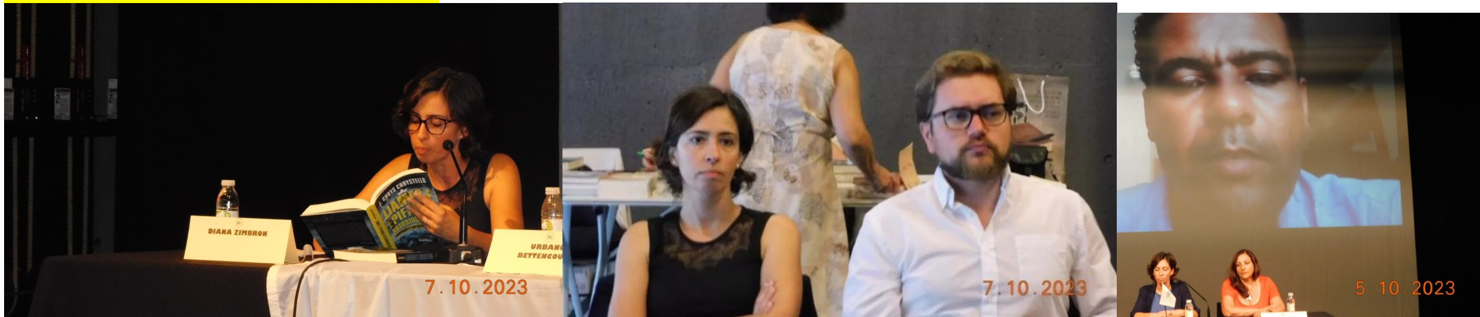
38º Ribeira Grande 2023