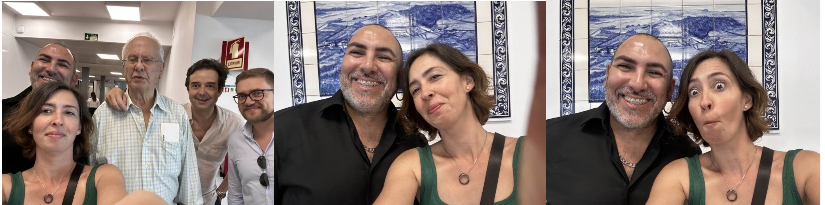
39º Santa Maria 2024