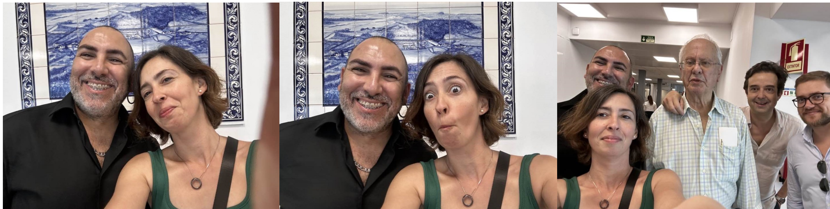
39º STA Mª 2024