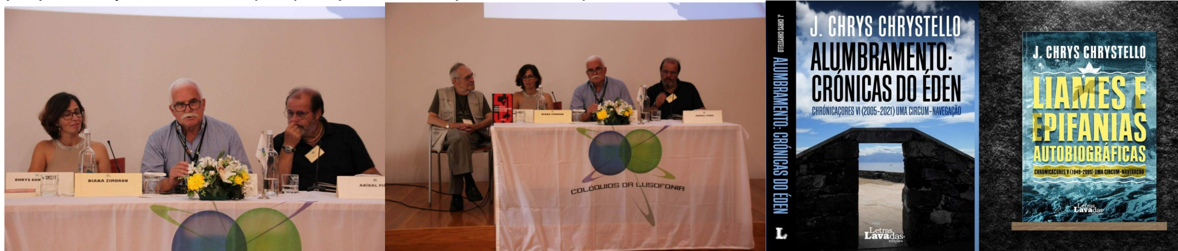
39º Santa Maria 2024