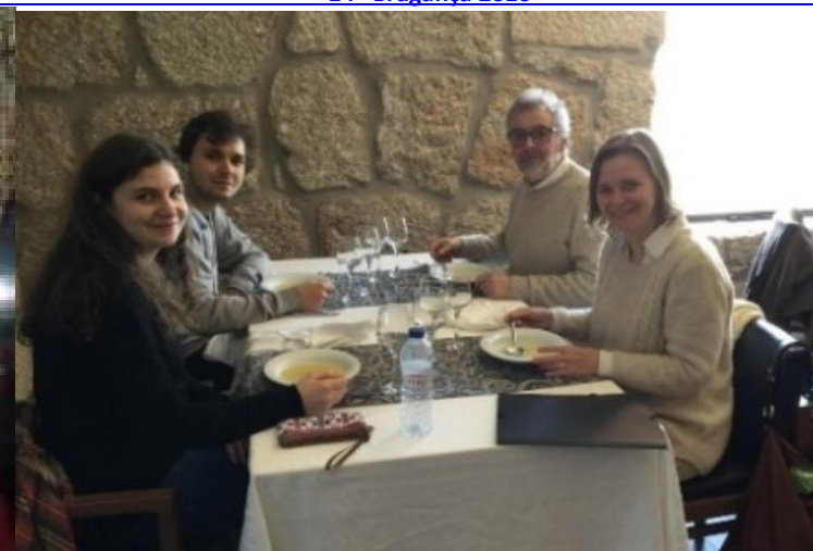
29º BELMONTE 2018