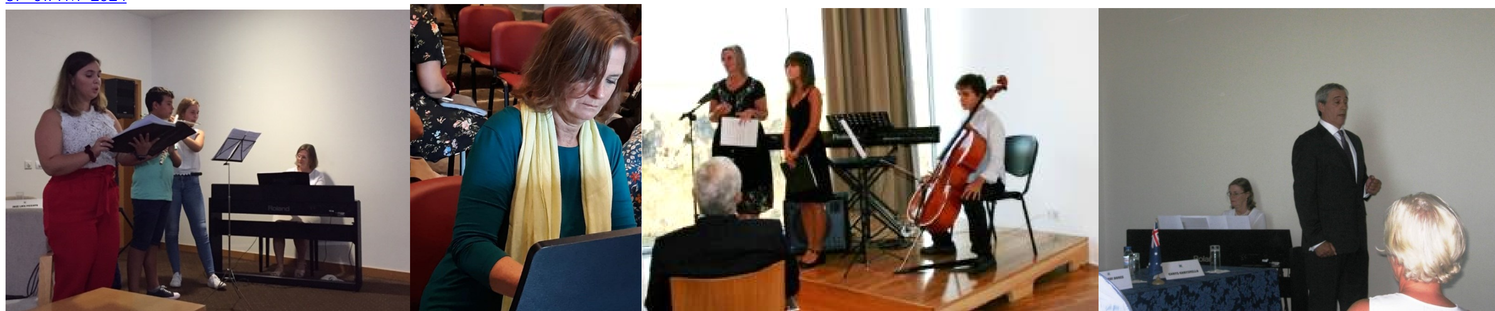
32º GRACIOSA 2019