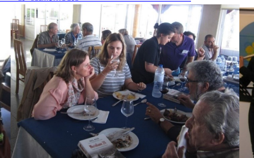
30º MADALENA DO PICO 2018