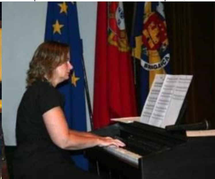
14º Bragança 2010