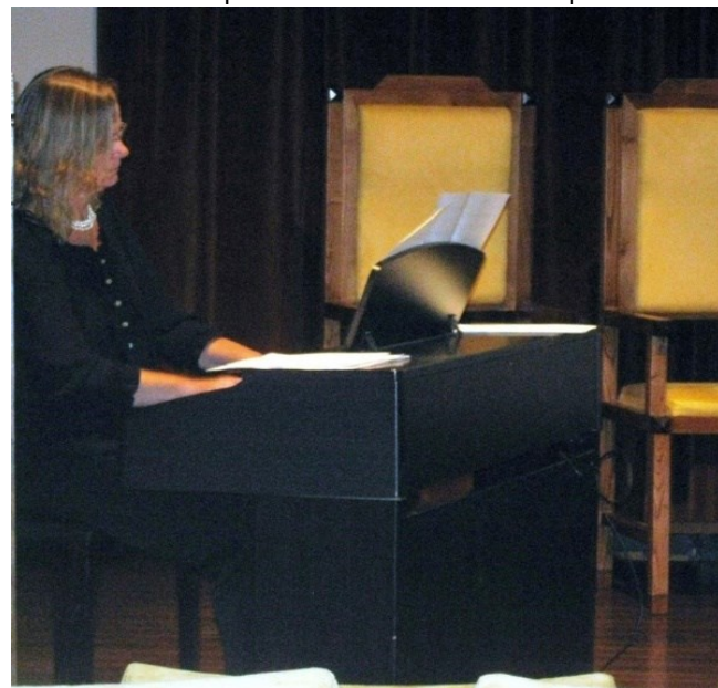
12º BRAGANÇA 2009

Em janeiro e em maio de 2006 acompanhou o grupo vocal Quatro Oitavas em digressões ao Uruguai e ao Brasil a convite da Direção Regional das Comunidades. Integra, desde 1988, o corpo docente do Conservatório de Ponta Delgada, onde tem lecionado as disciplinas de Piano, Órgão, Análise e Técnicas de Composição, Composição e Coro Infantil. Em 1990, participou num concerto na universidade SMU (nos Estados Unidos), tocando como solista, com a orquestra daquela universidade. Entre 2005 e 2019, desempenhou as funções de presidente do conselho executivo. Em 2010 foi a pianista convidada para o XIII Colóquio da Lusofonia em Florianópolis, Santa Catarina, Brasil, onde deu um concerto acompanhada da Orquestra (de cordas) da UDESC.