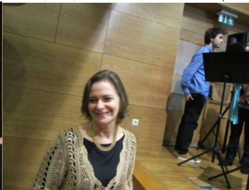
29º BELMONTE 2011