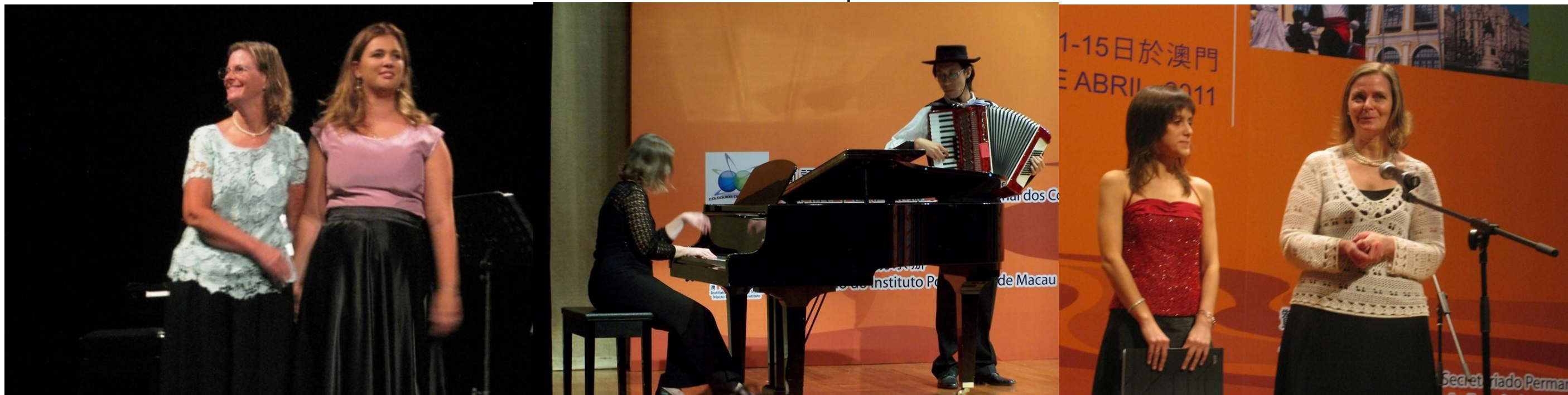
30° MADALENA DO PICO 2018