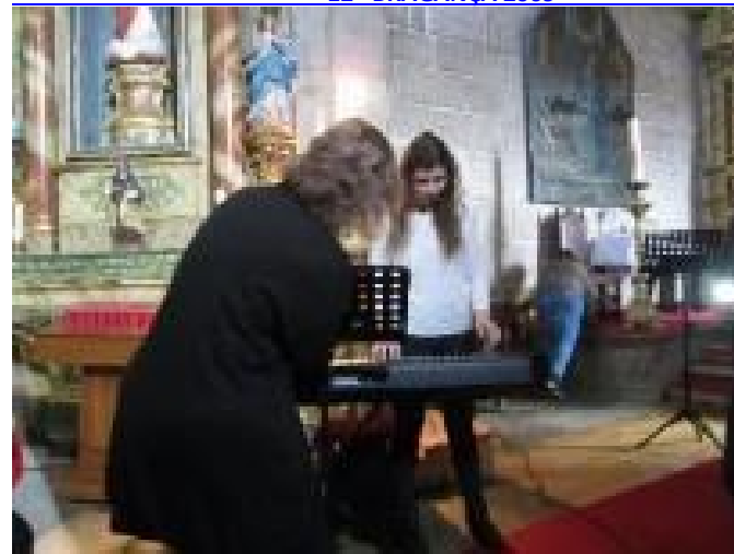
25º MONTEALEGRE 2016