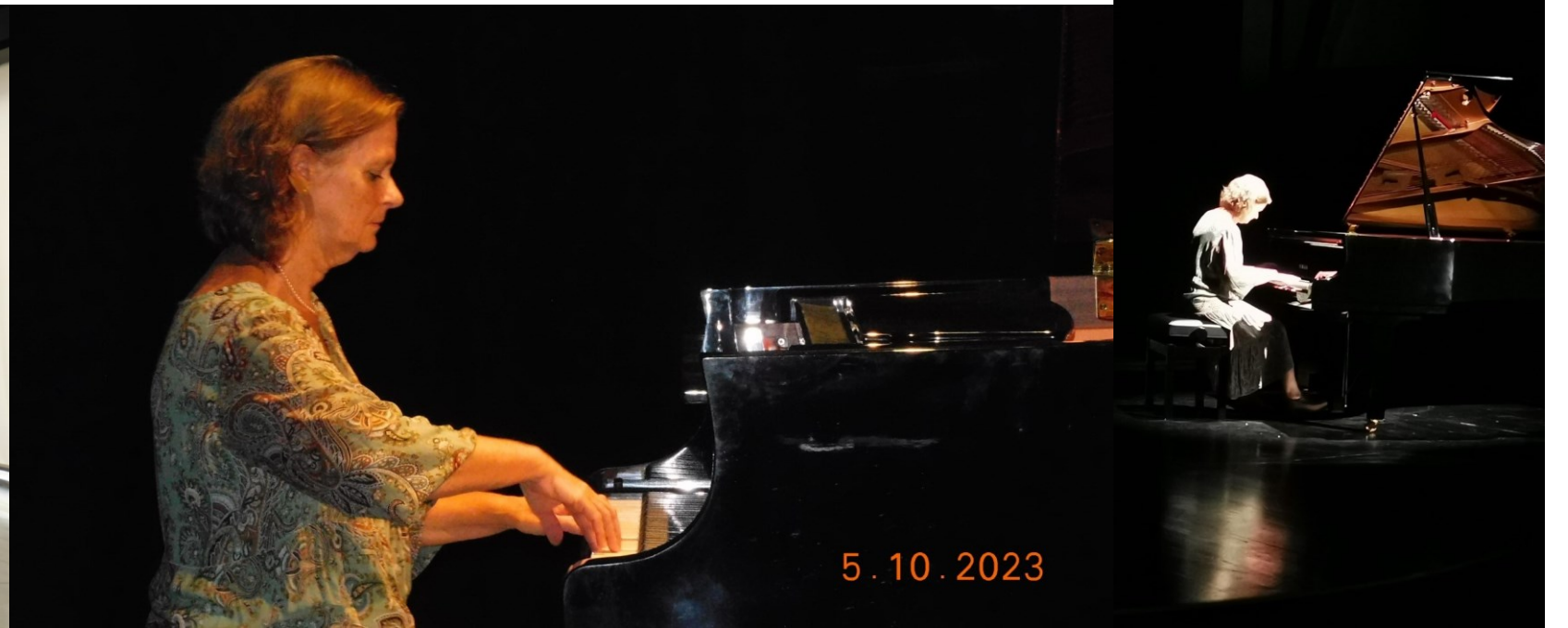
38° Ribeira Grande 2023