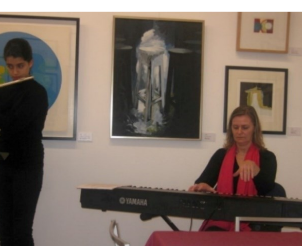
17º lagoa 2012

Em 2011 acompanhou o 15º Colóquio a Macau onde atuou com artistas chineses em execução de obras açorianas.