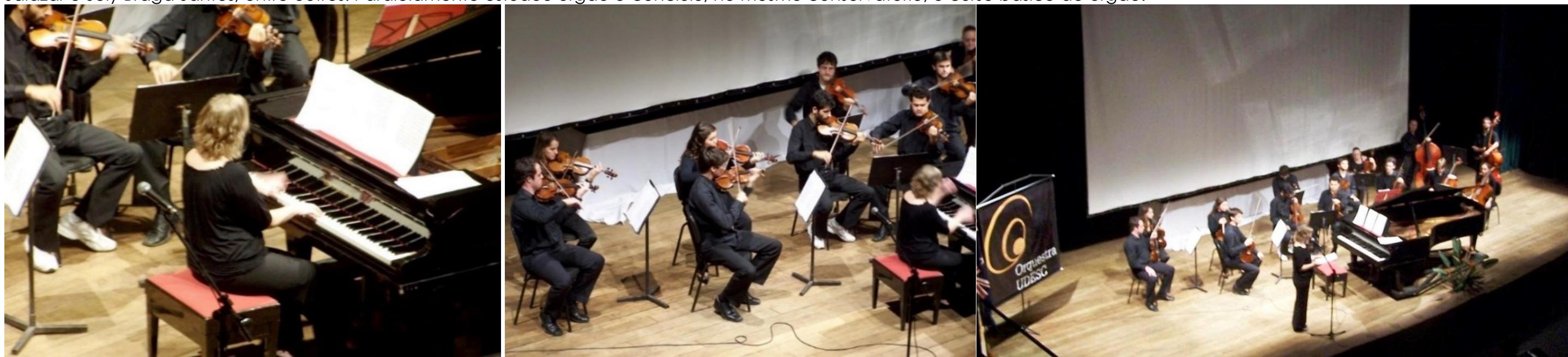
COM A UDESC EM SANTA CATARINA 13° COLÓQUIO 2010

Em 1987 terminou o curso superior de piano no conservatório nacional (Lisboa), e no ano seguinte o curso superior de composição, tendo sido aluna dos compositores C. Bochmann, Álvaro Salazar e Joly Braga Santos, entre outros. Paralelamente estudou órgão e concluiu, no mesmo conservatório, o curso básico de órgão.