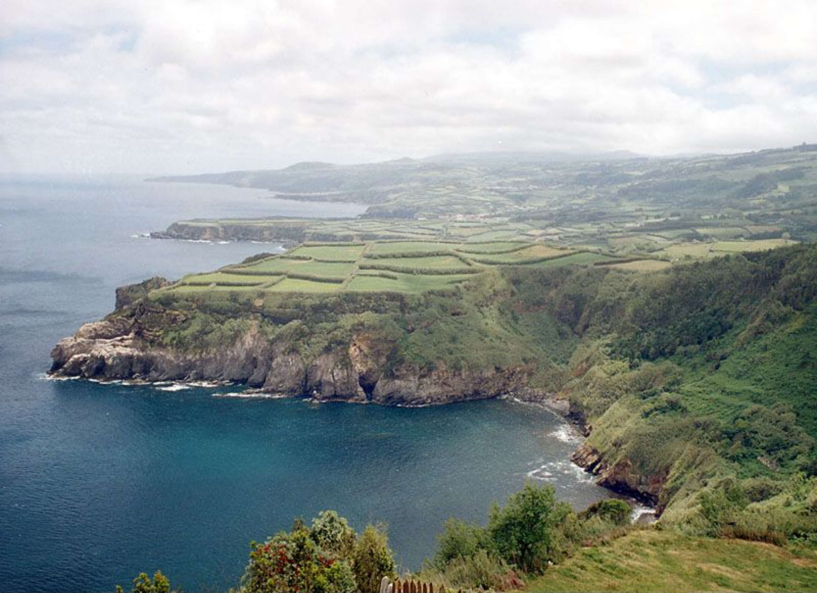
Miradouro Santa Iria