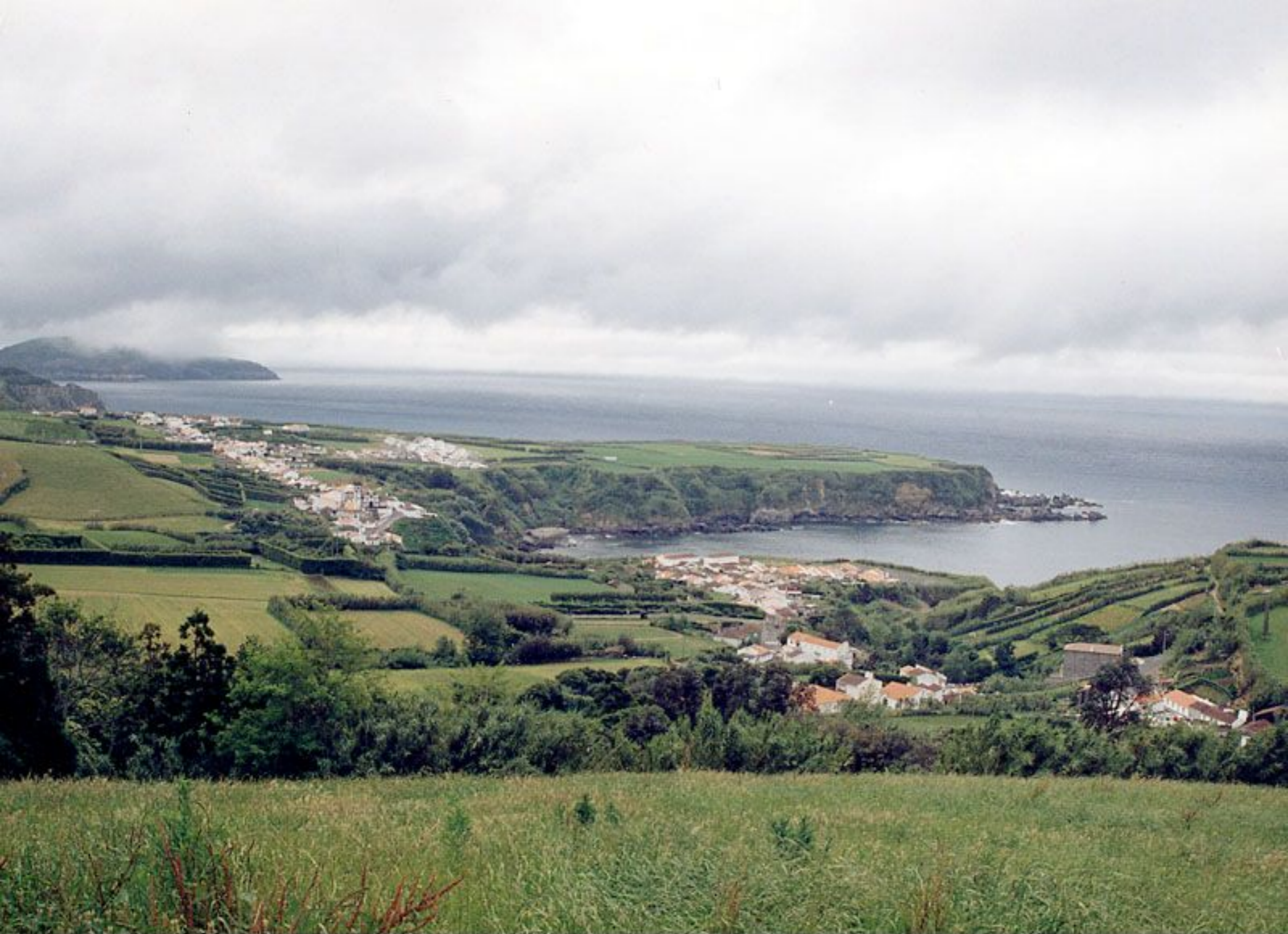
Vista Panorâmica de Porto Formoso