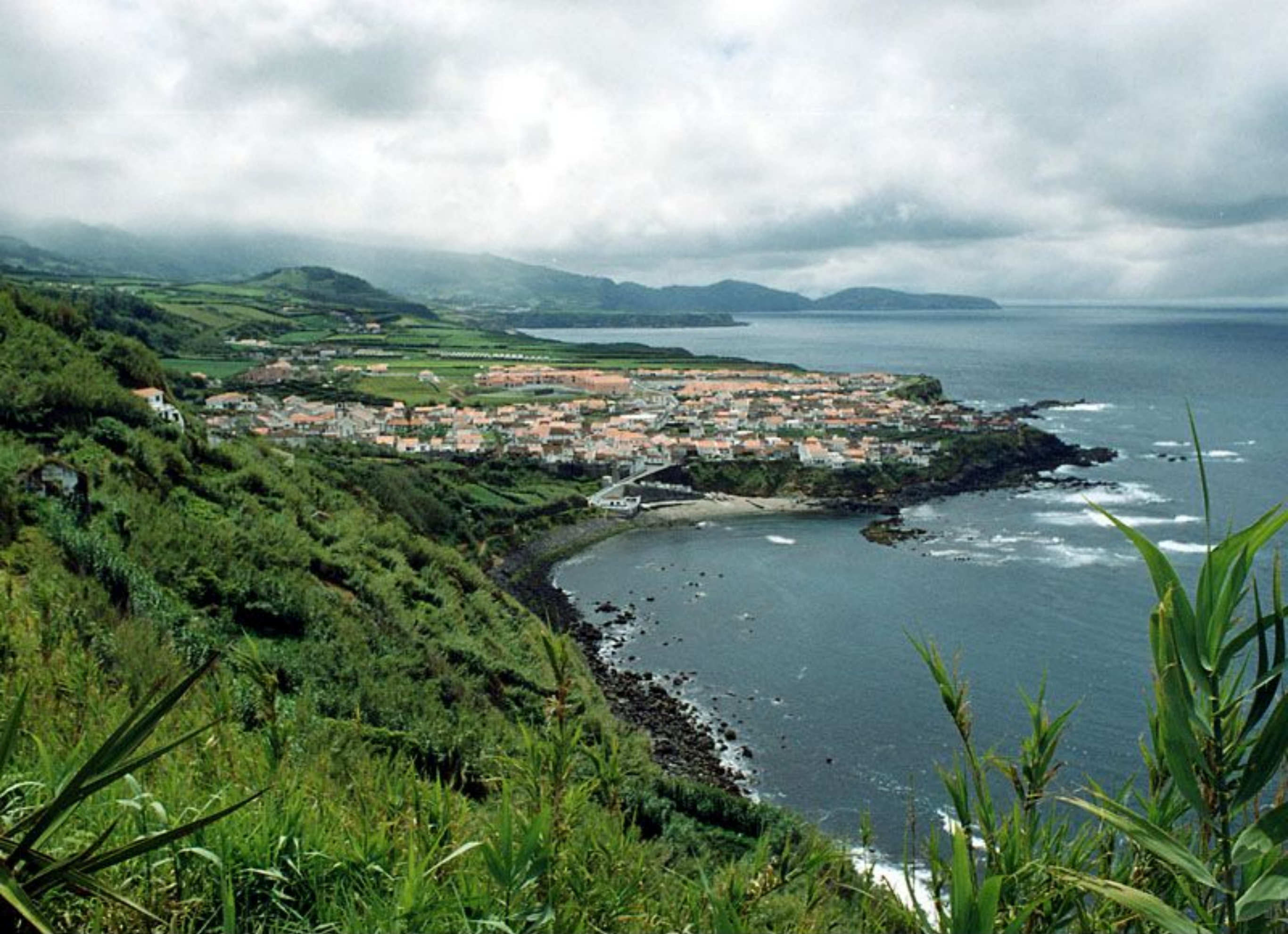
Vista Geral da Freguesia