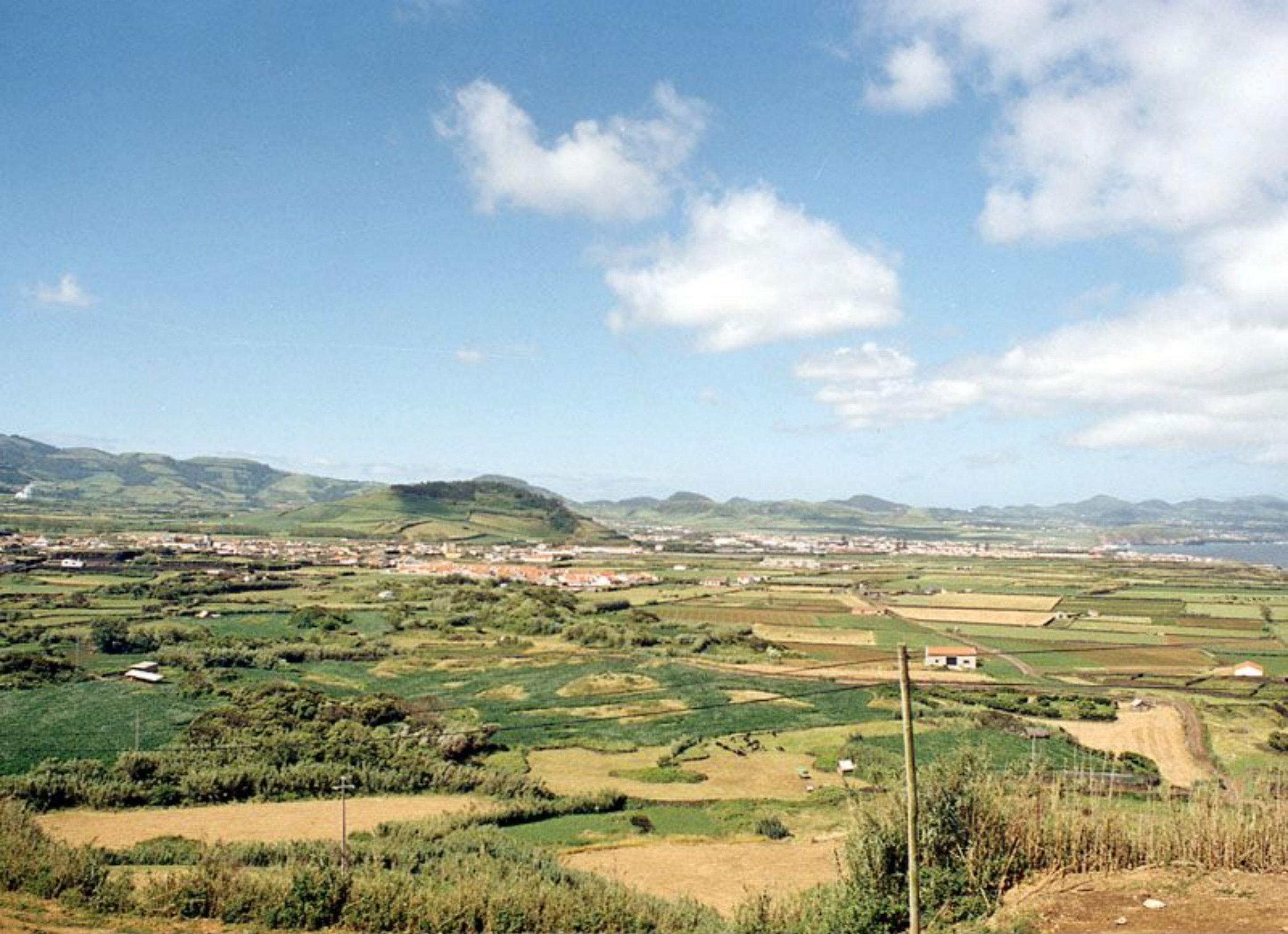
Vista Geral de Ribeirinha