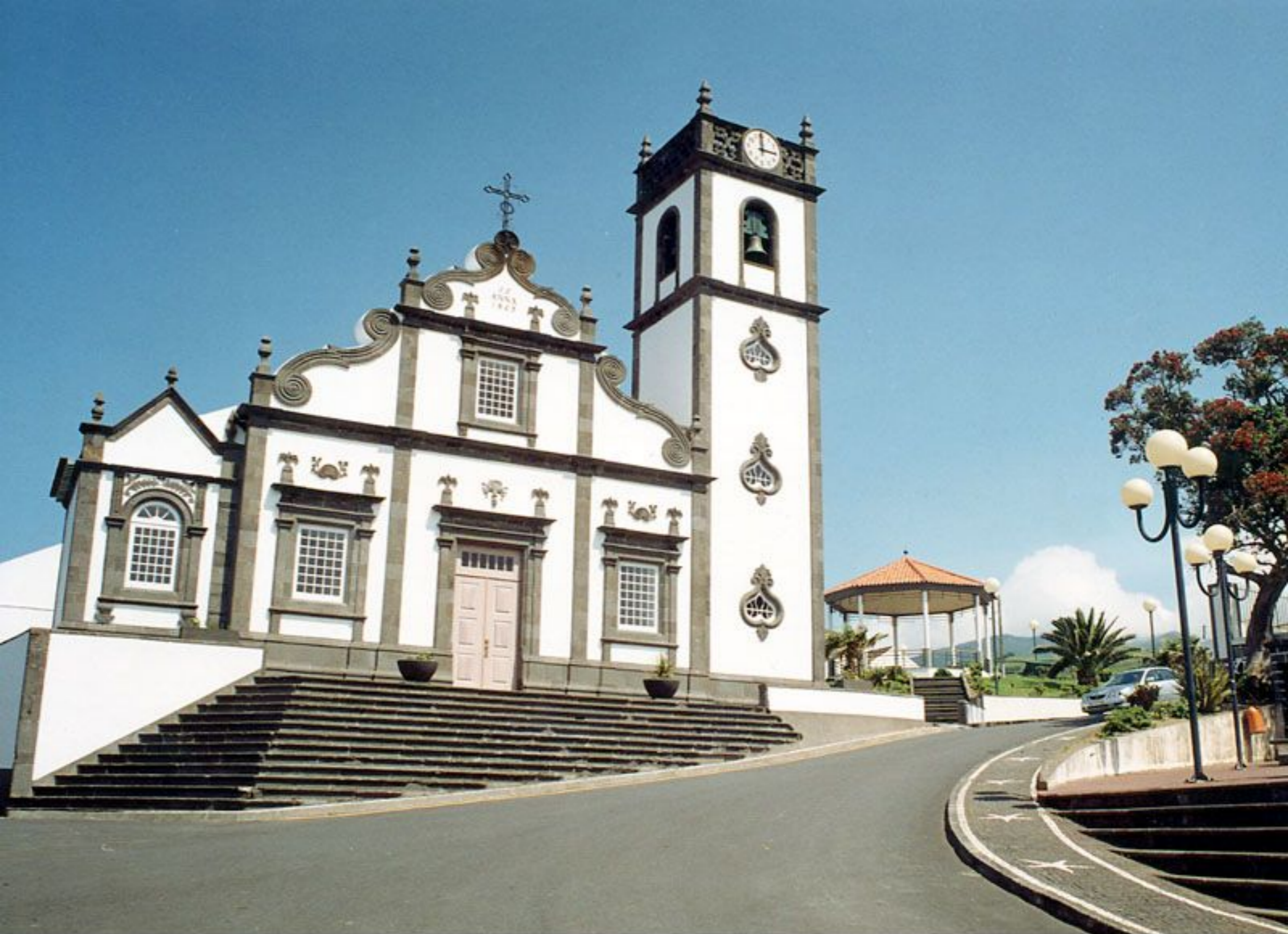
Igreja Matriz de Santana