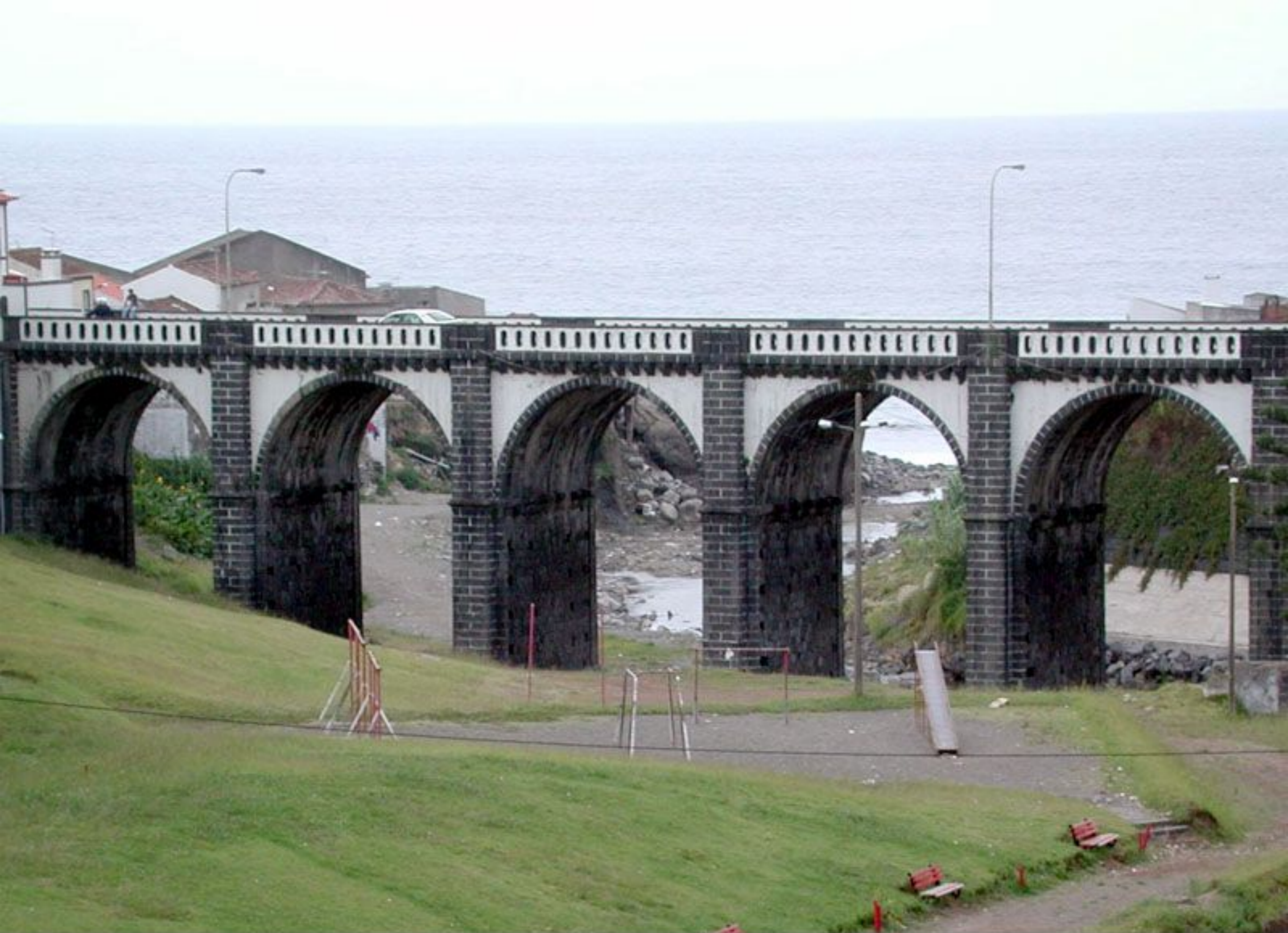
Ponte de Ribeira Grande