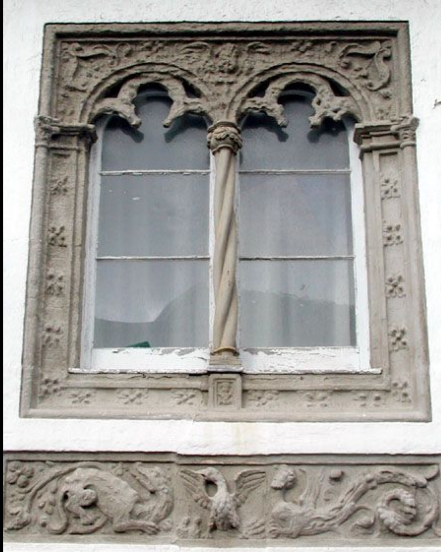
Janela Manuelina e Friso Renascença Edifício da Câmara Municipal de Ribeira Grande