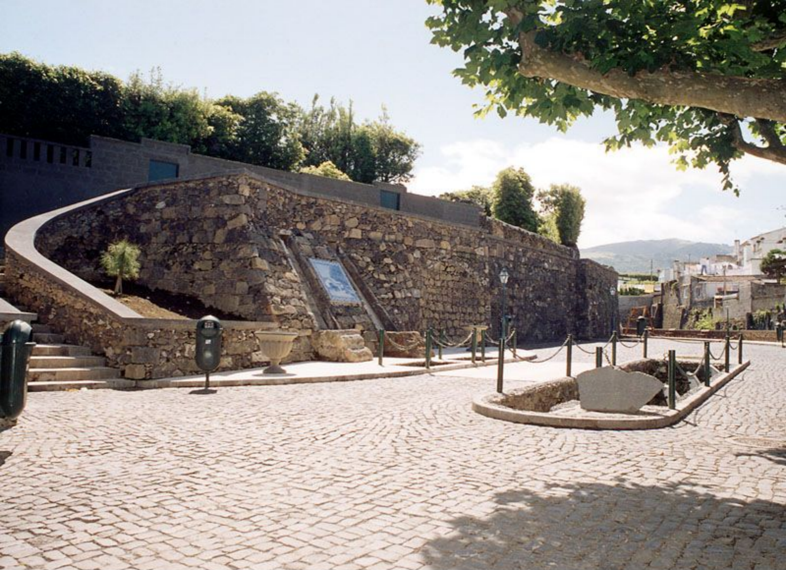
Jardim do Moinho