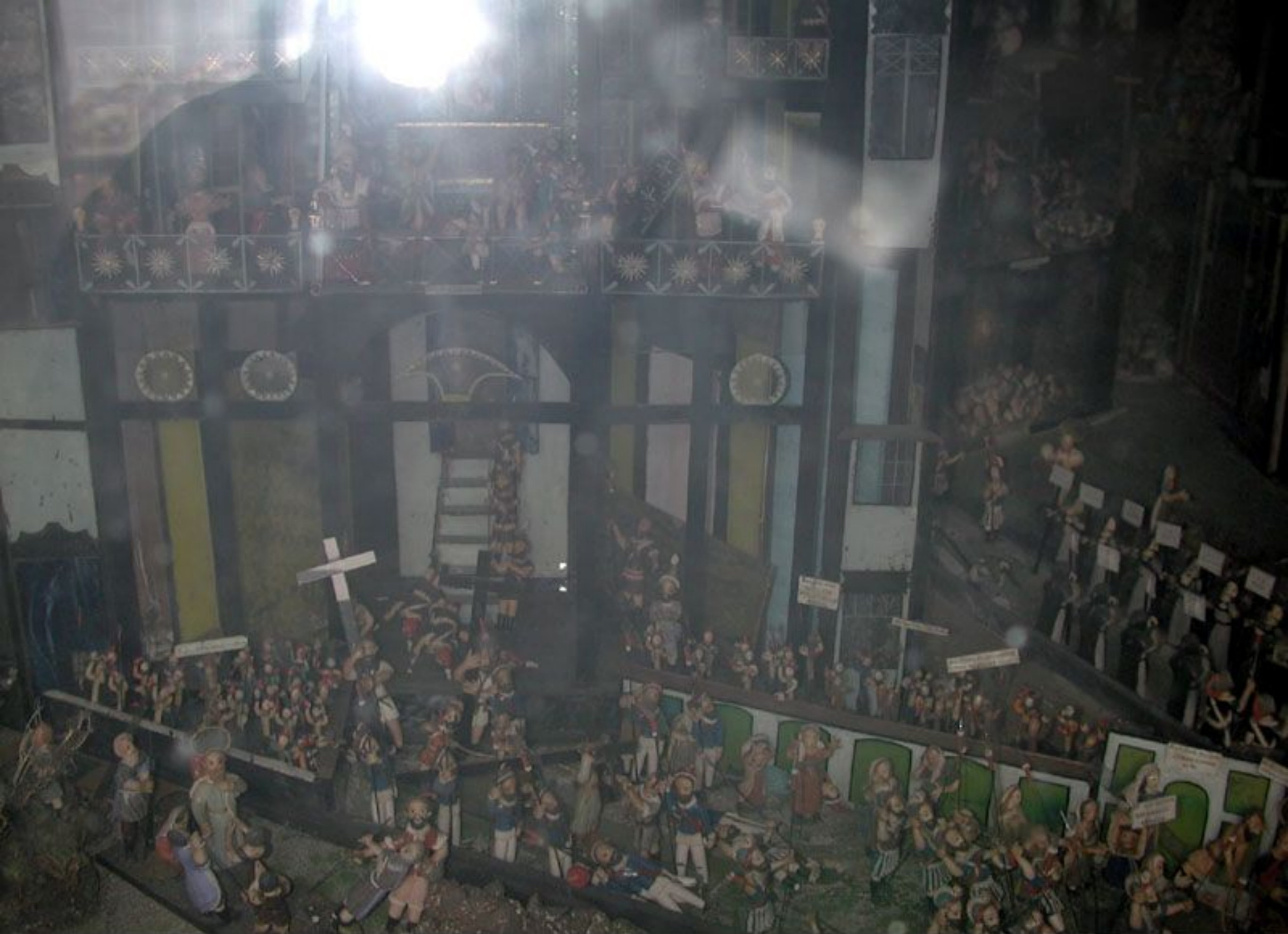
Presépio de Ribeira Grande Matriz