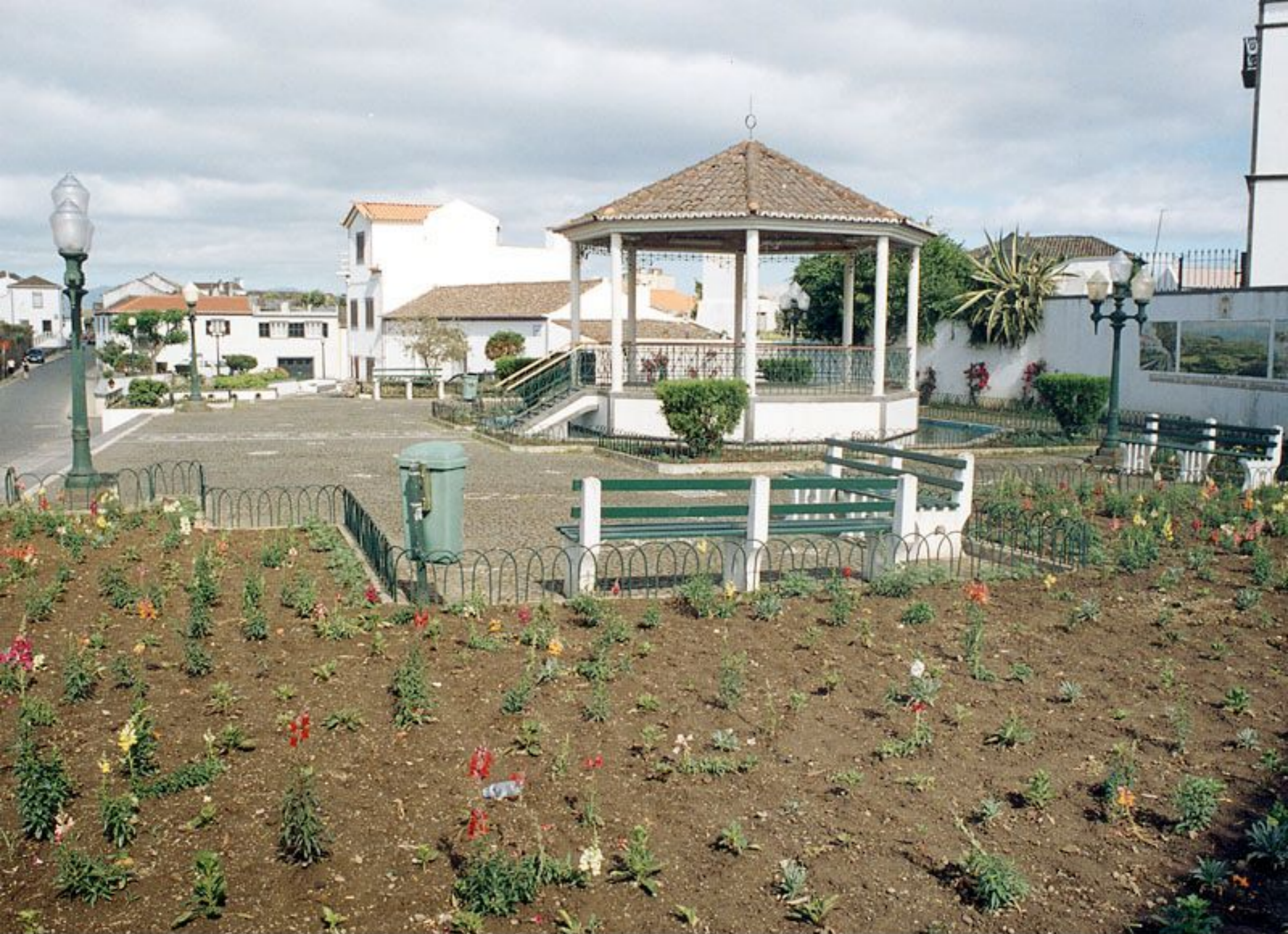
Jardim e Coreto da Ribeirinha