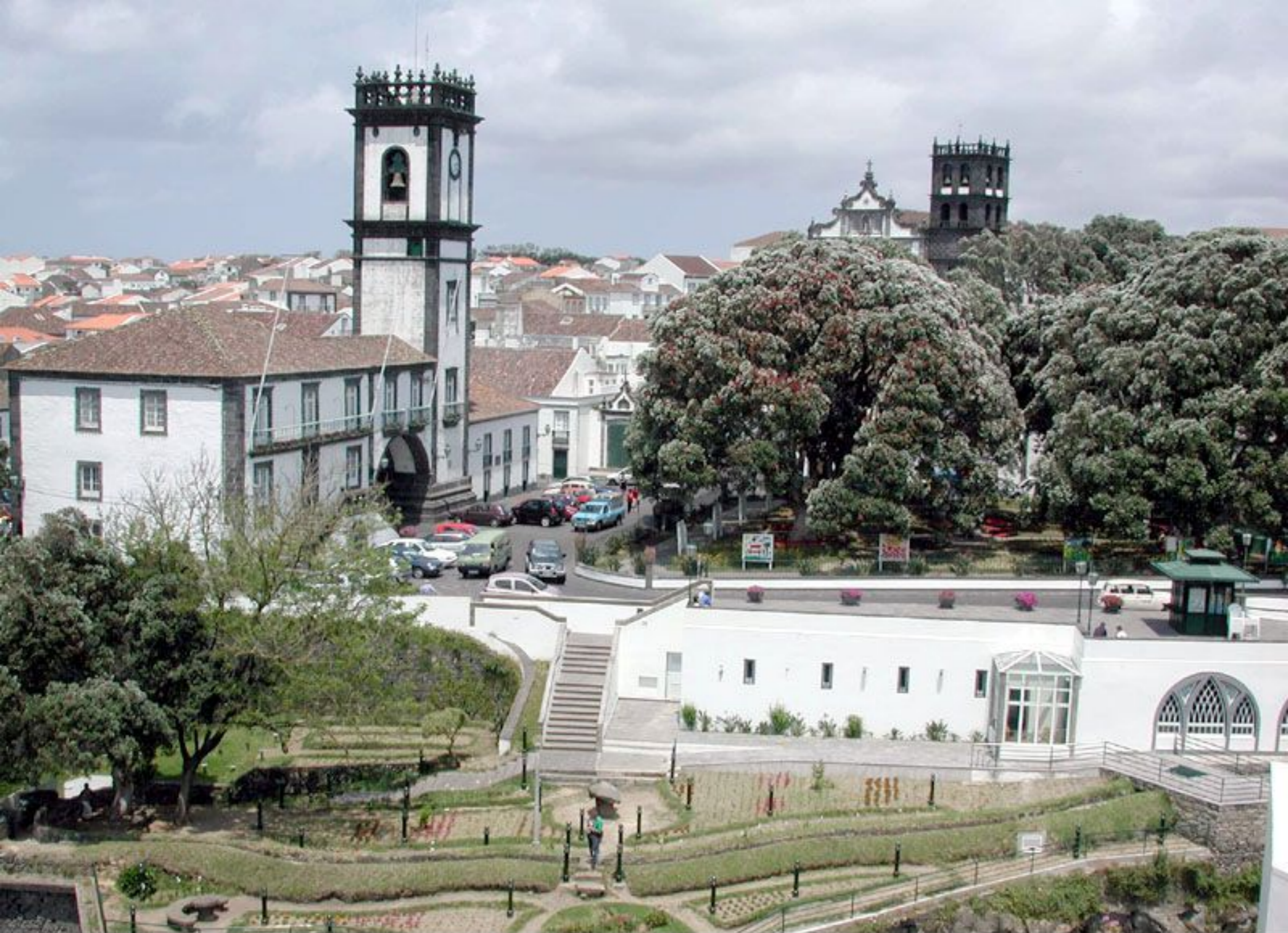
Vista Panorâmica do Jardim Paraíso Infantil e da Câmara Municipal de Ribeira Grande