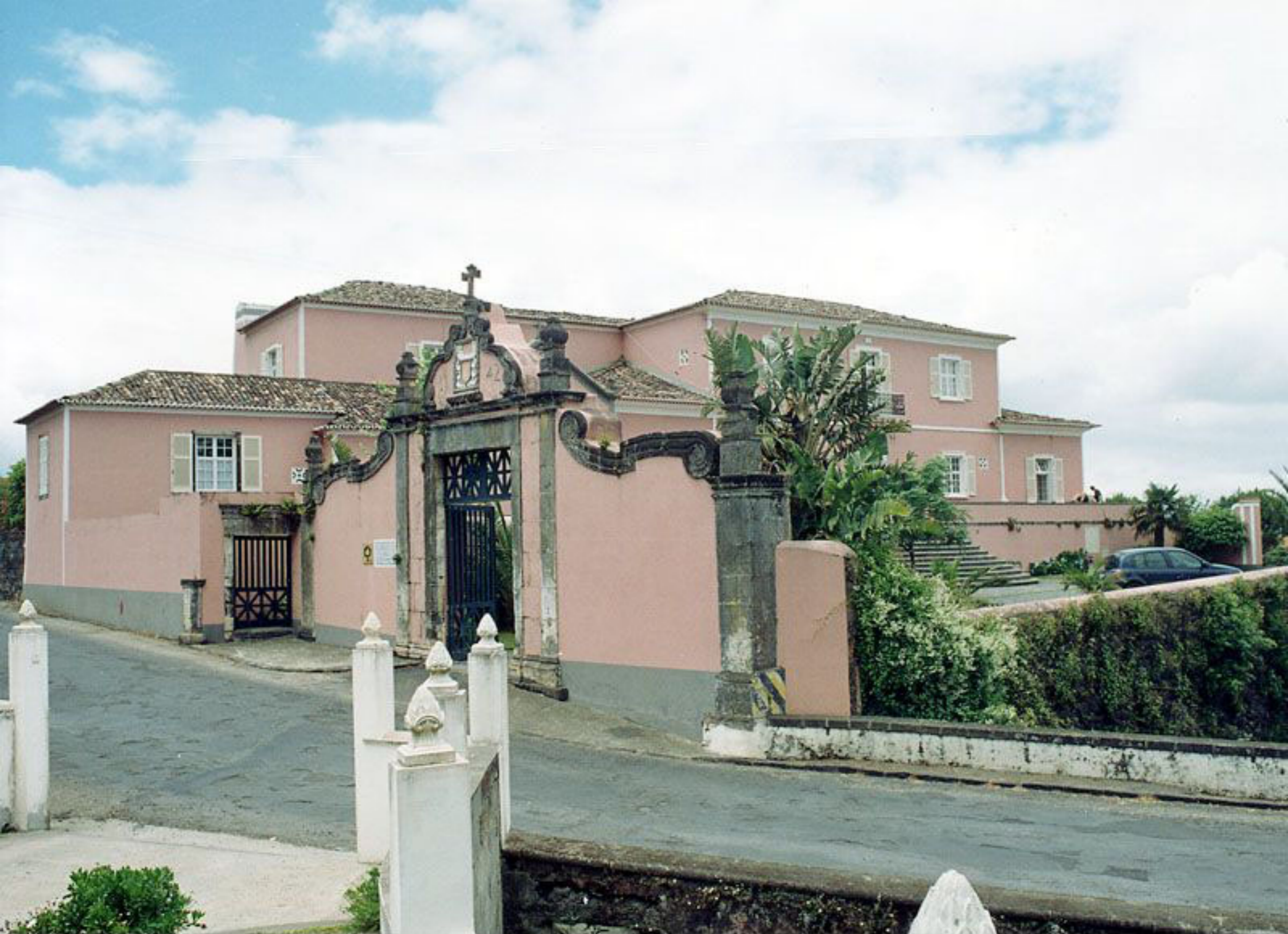
Solar de Lalém