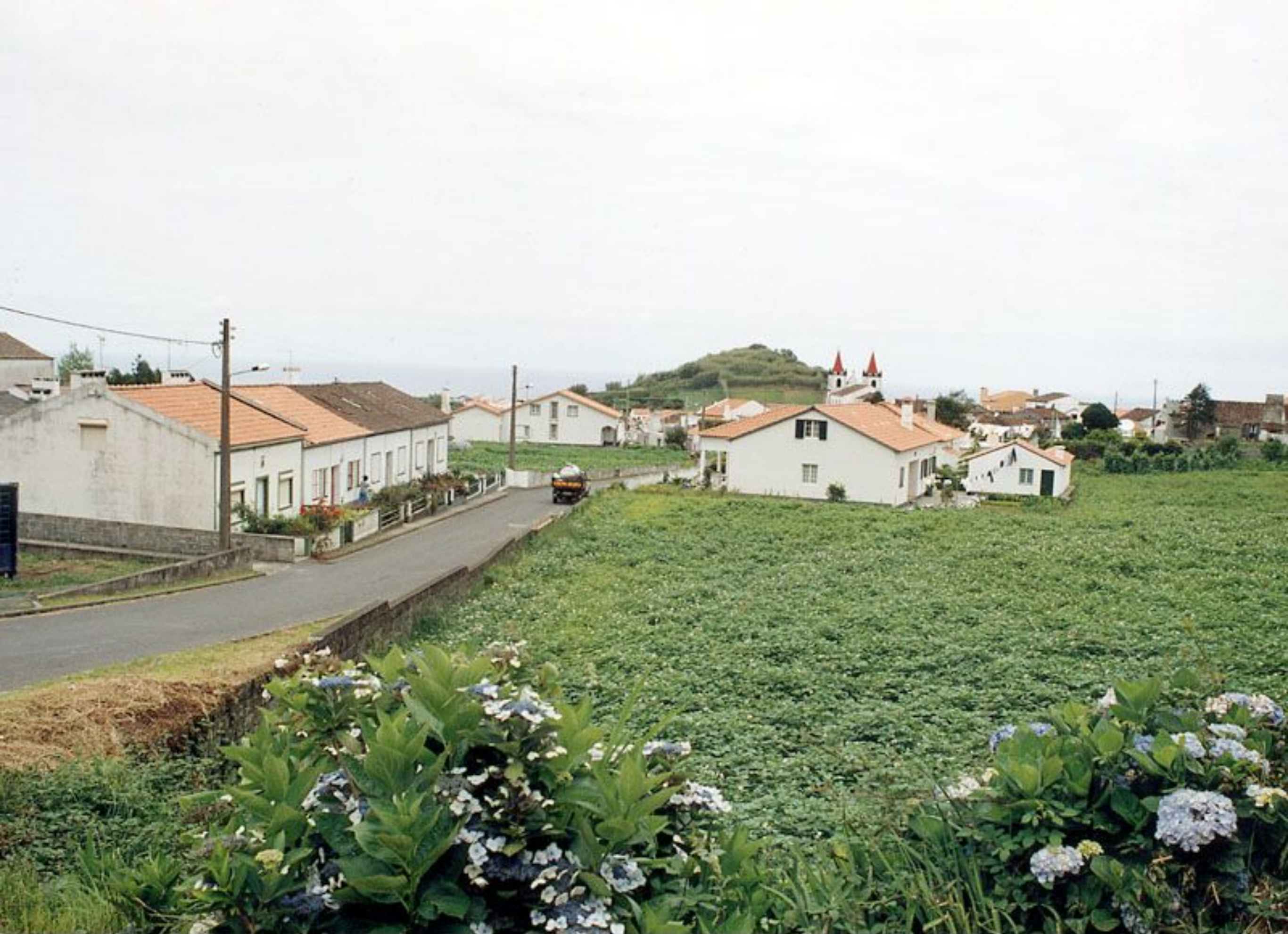
Vista Parcial de São Brás