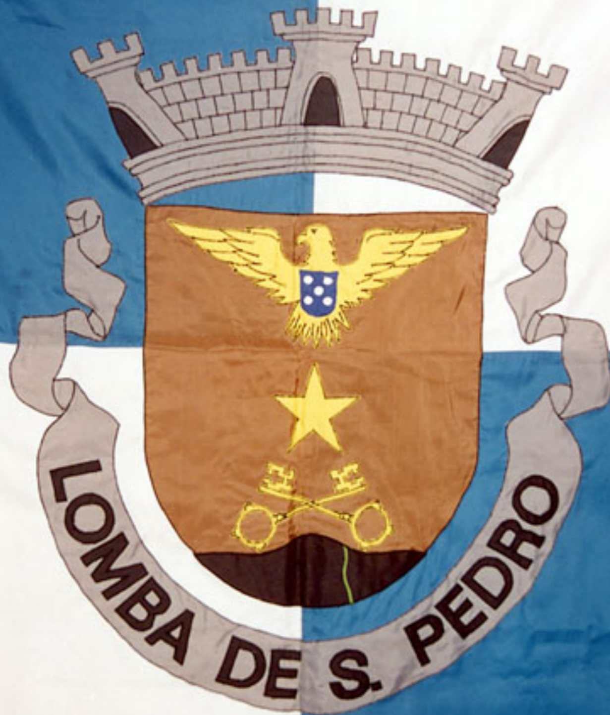
Brasão da Freguesia