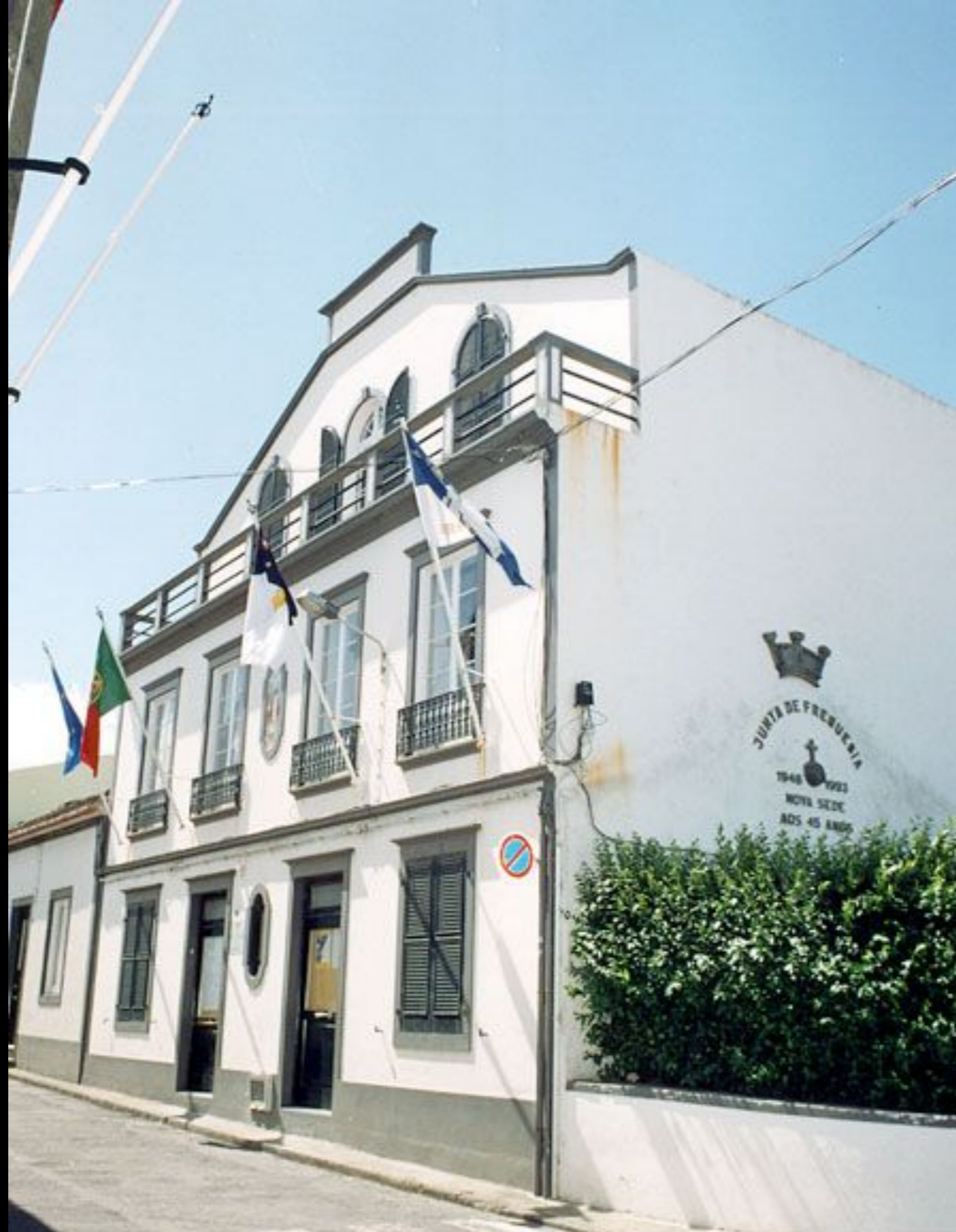
Sede da Junta da Freguesia de Ribeirinha