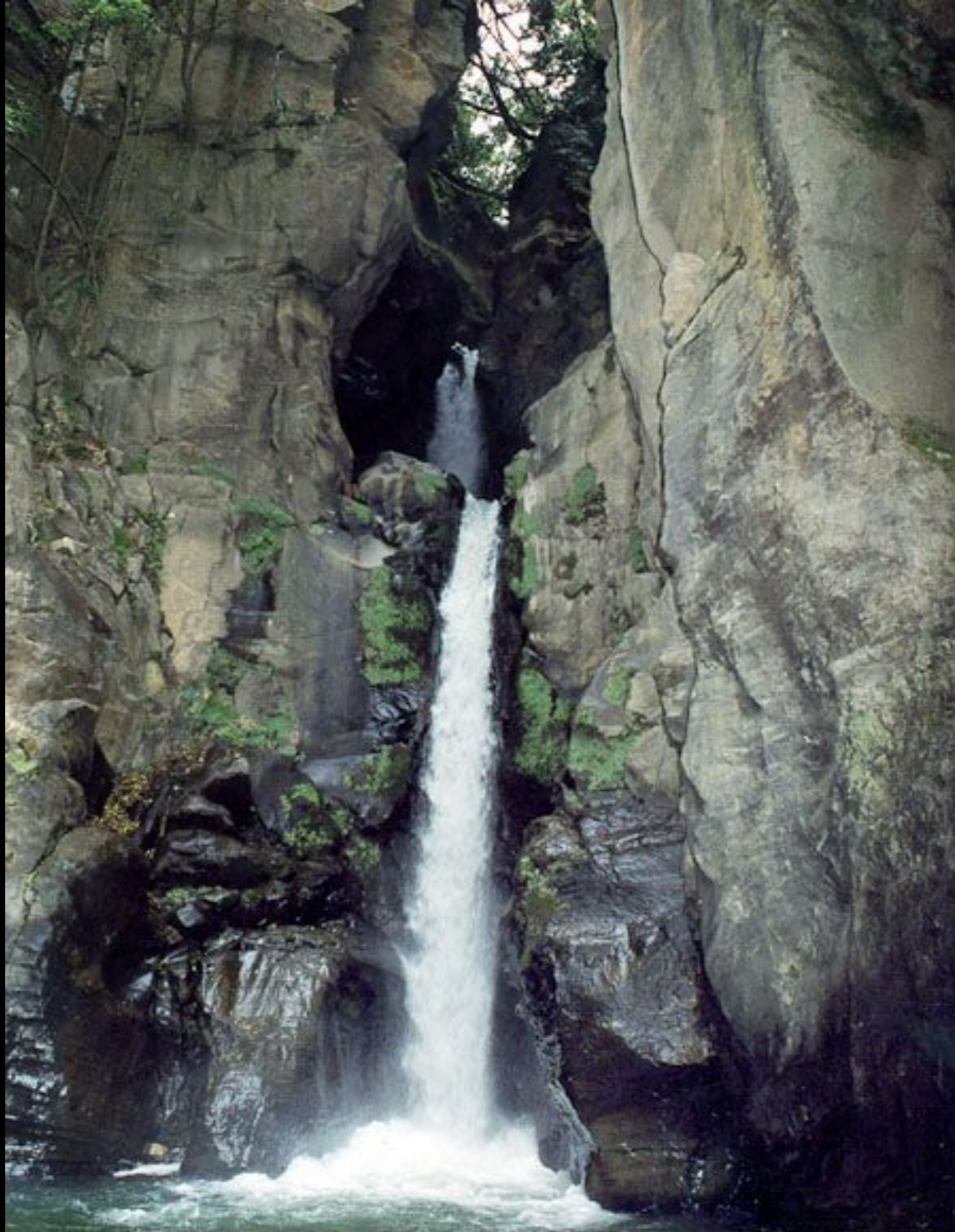
Queda de Água - Salto do Cabrito