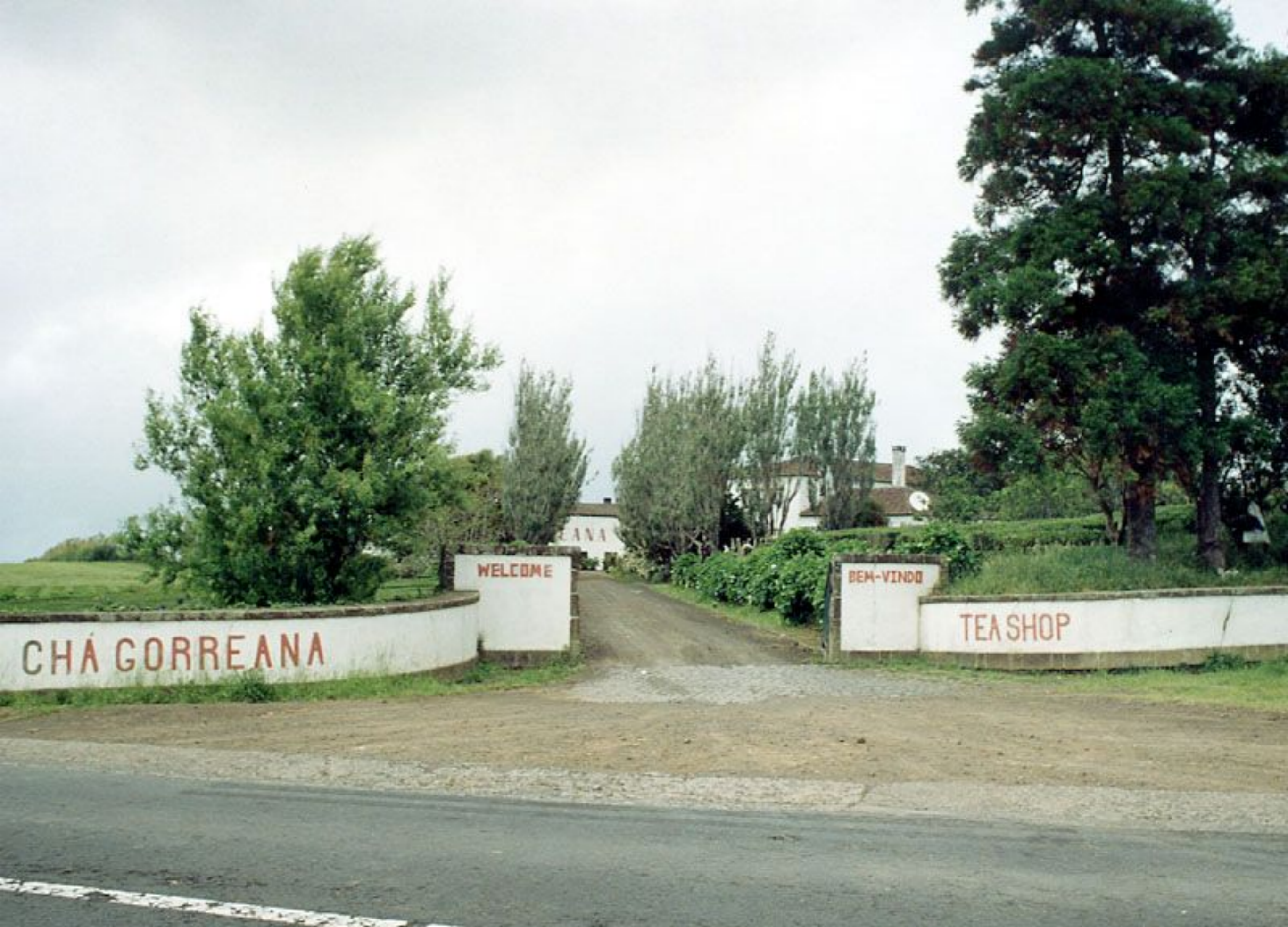
Fábrica "Chá Gorreana"