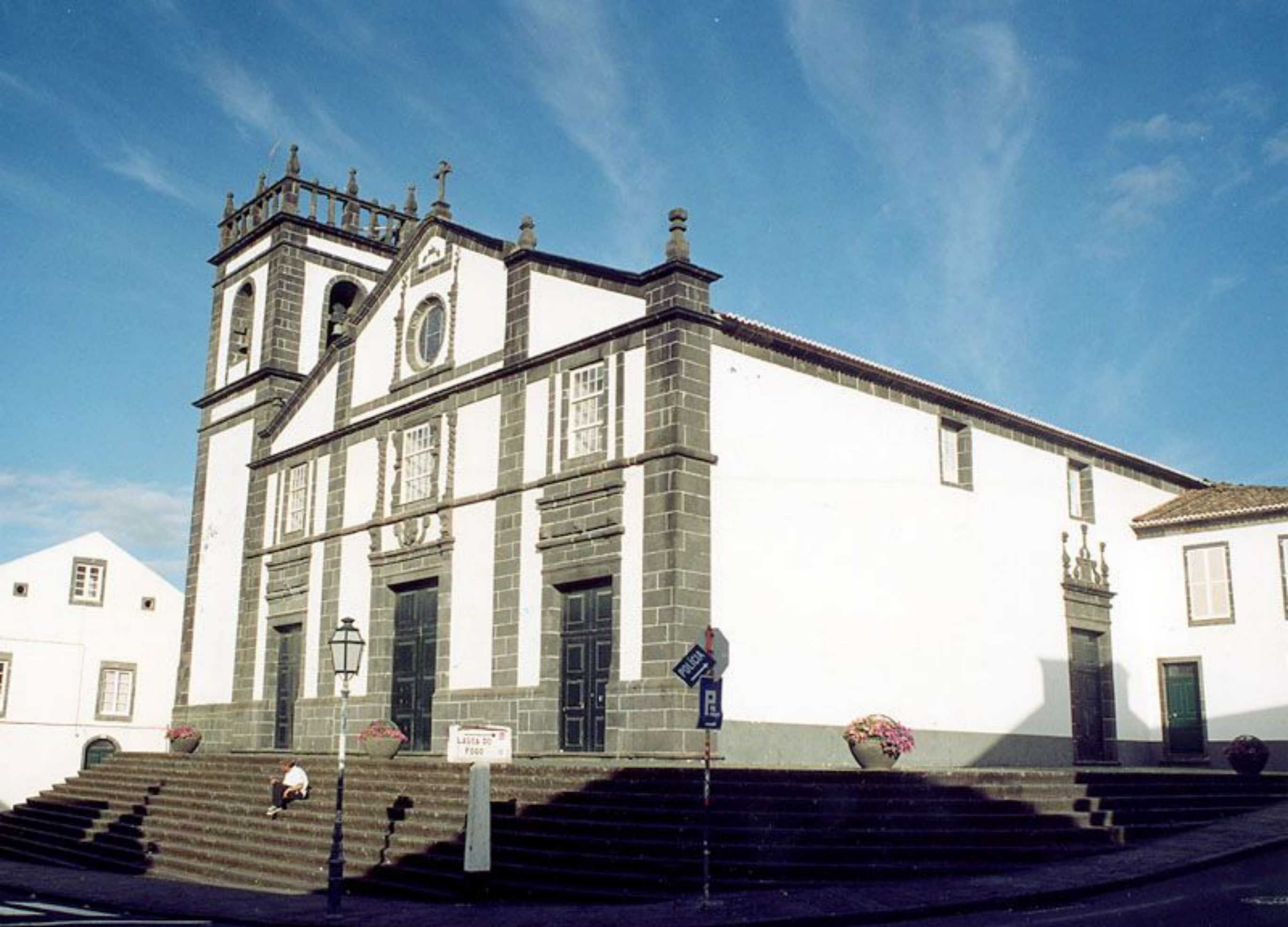
Igreja de Conceição