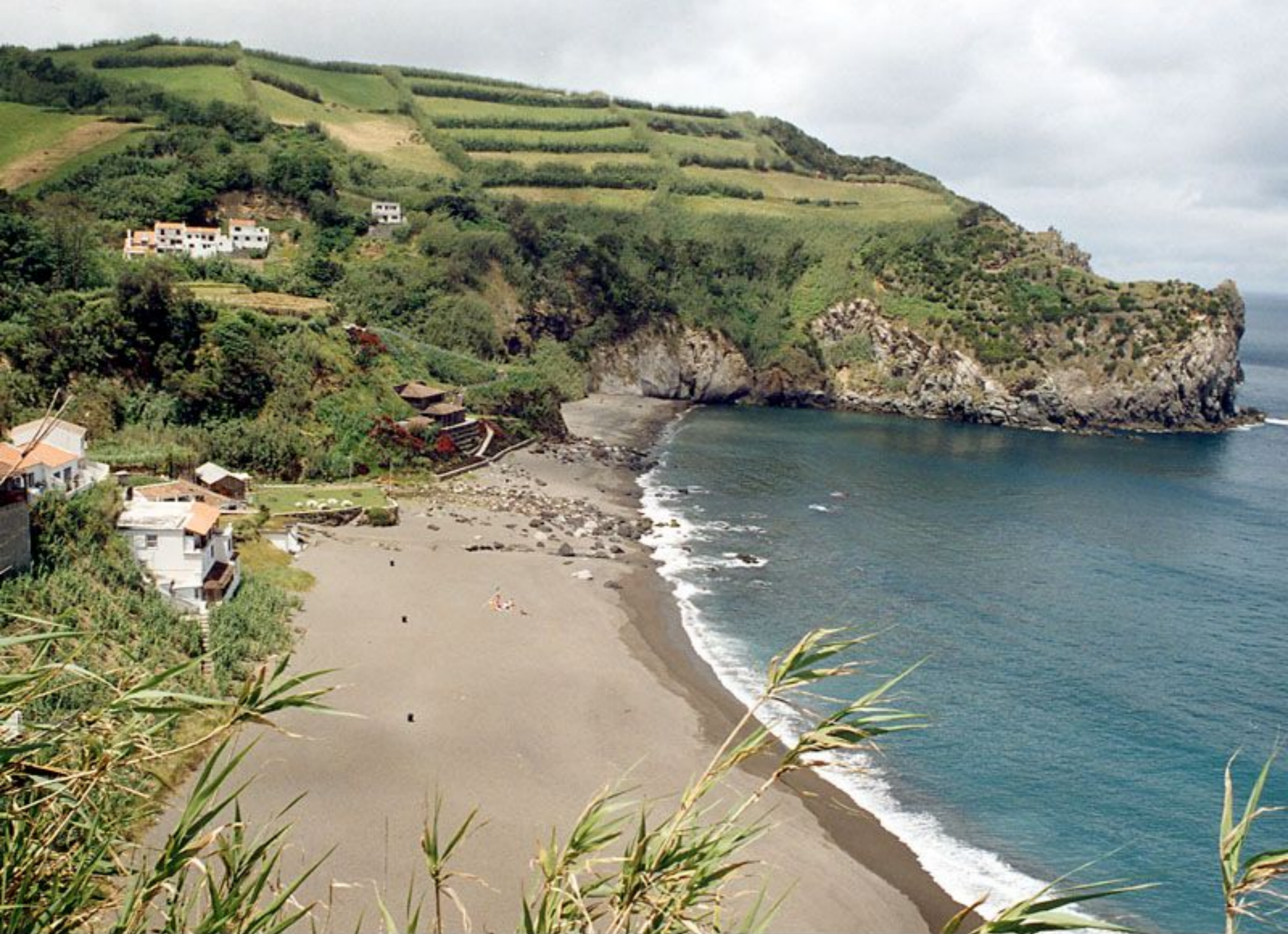
Praia dos Moinhos