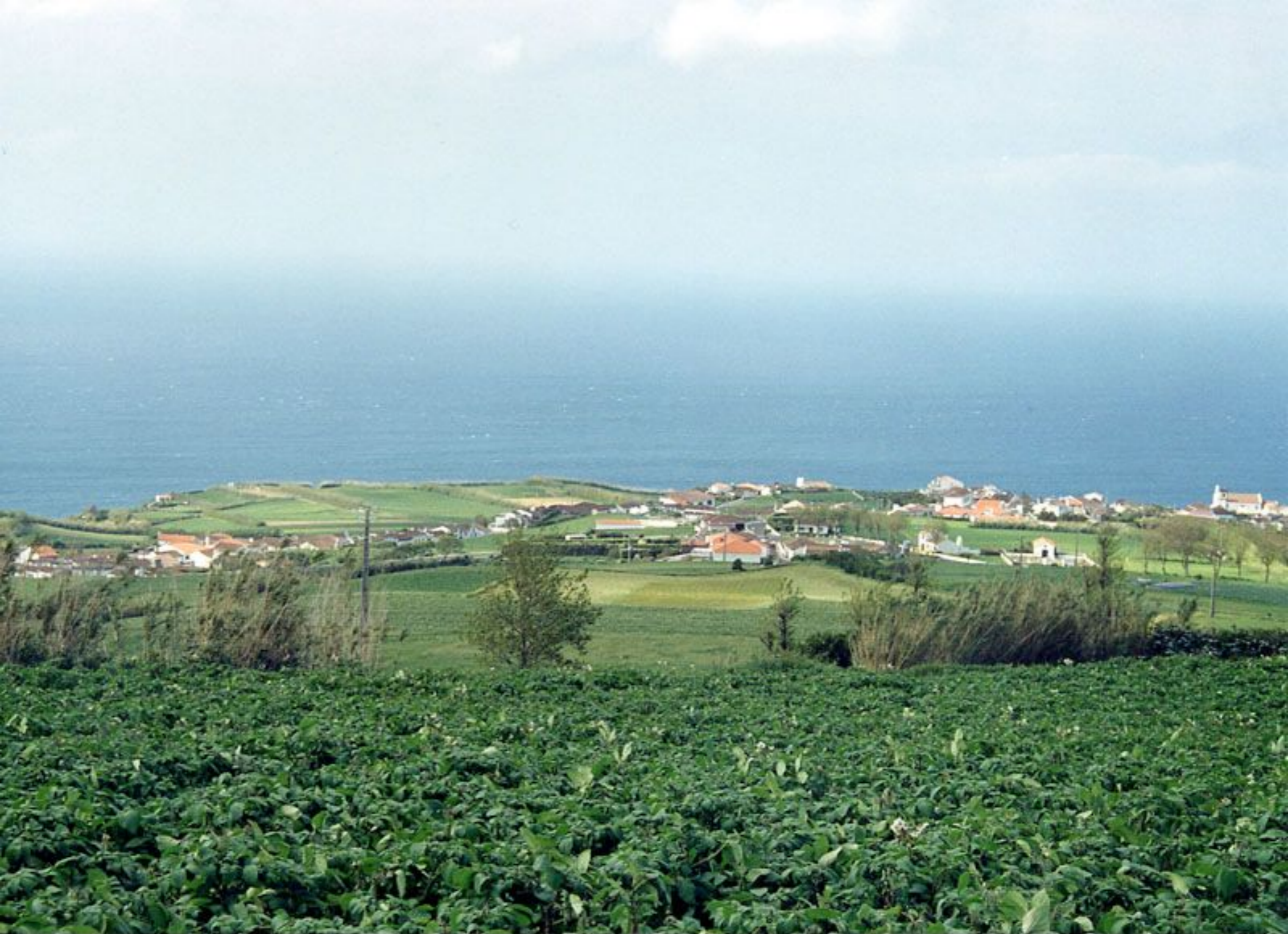
Vista Panorâmica da Santana