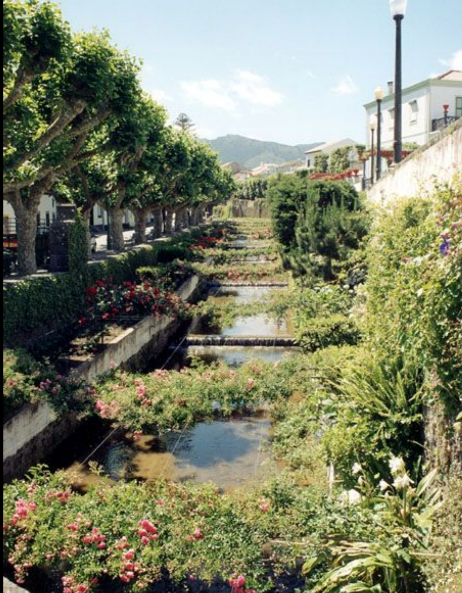
Ribeira da Ribeirinha