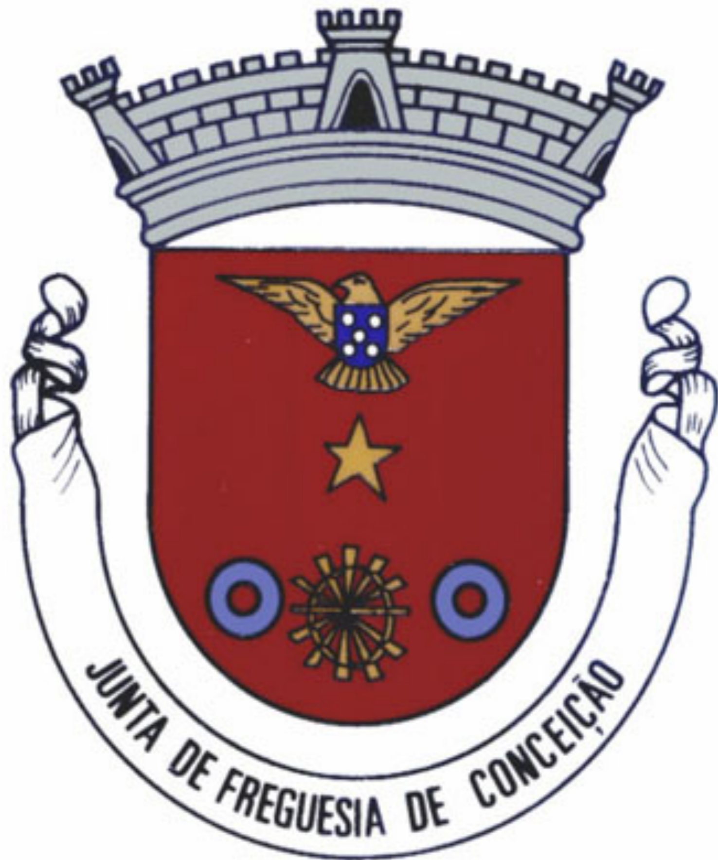
Brasão de Conceição