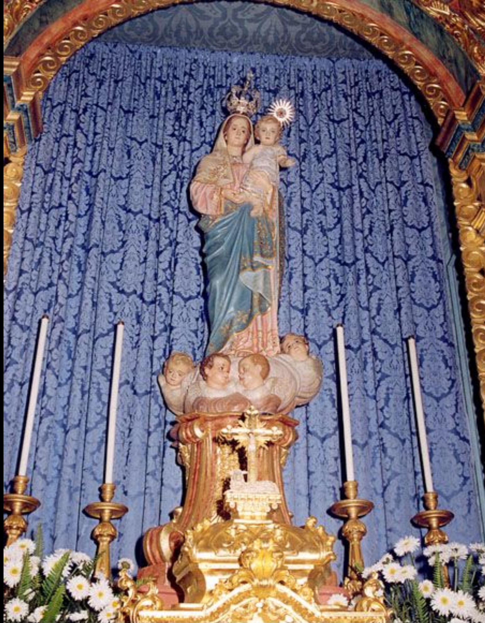
Nossa Senhora da Graça