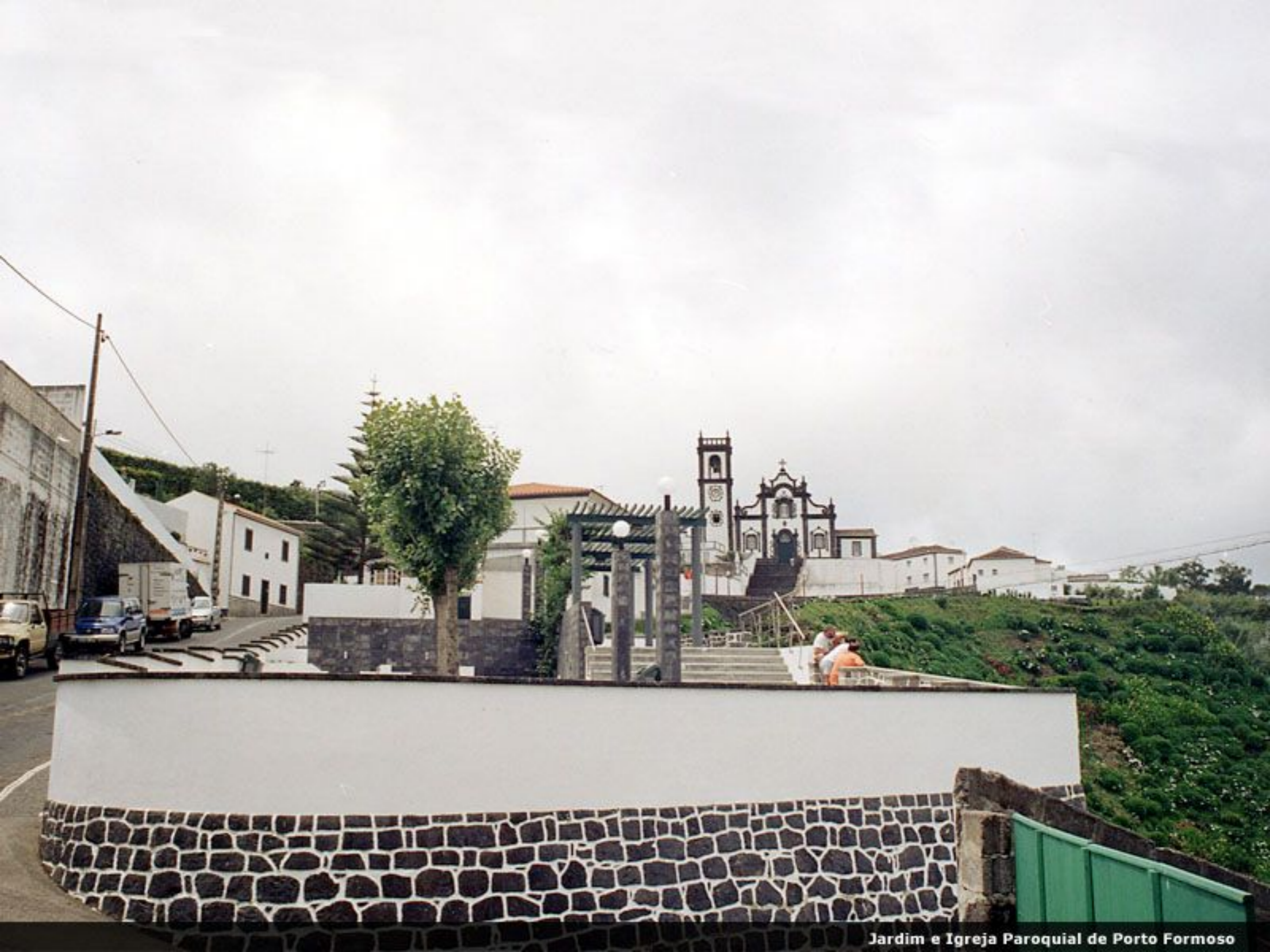
Jardim e Igreja Paroquial de Porto Formoso