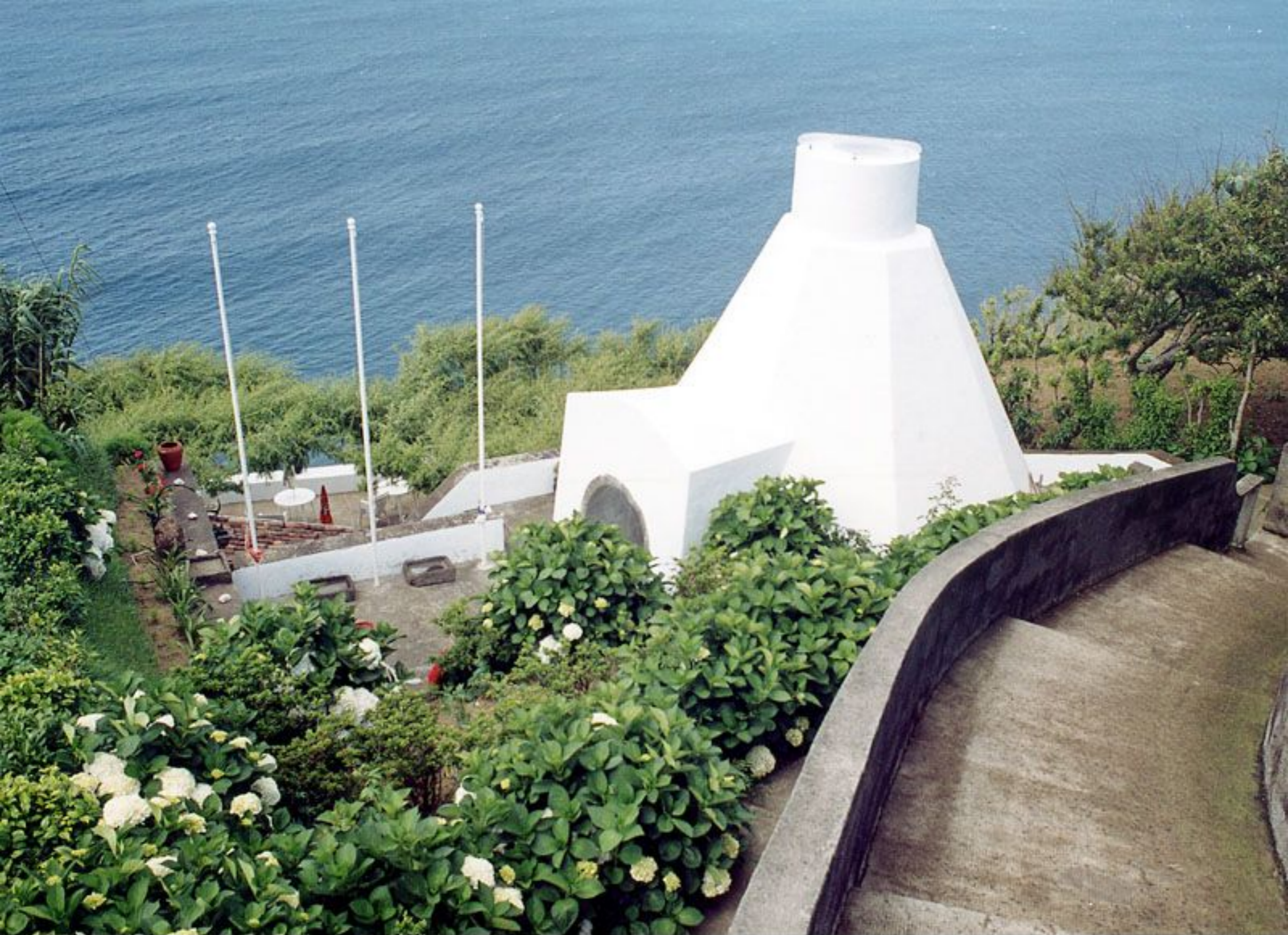
Forno de Cal