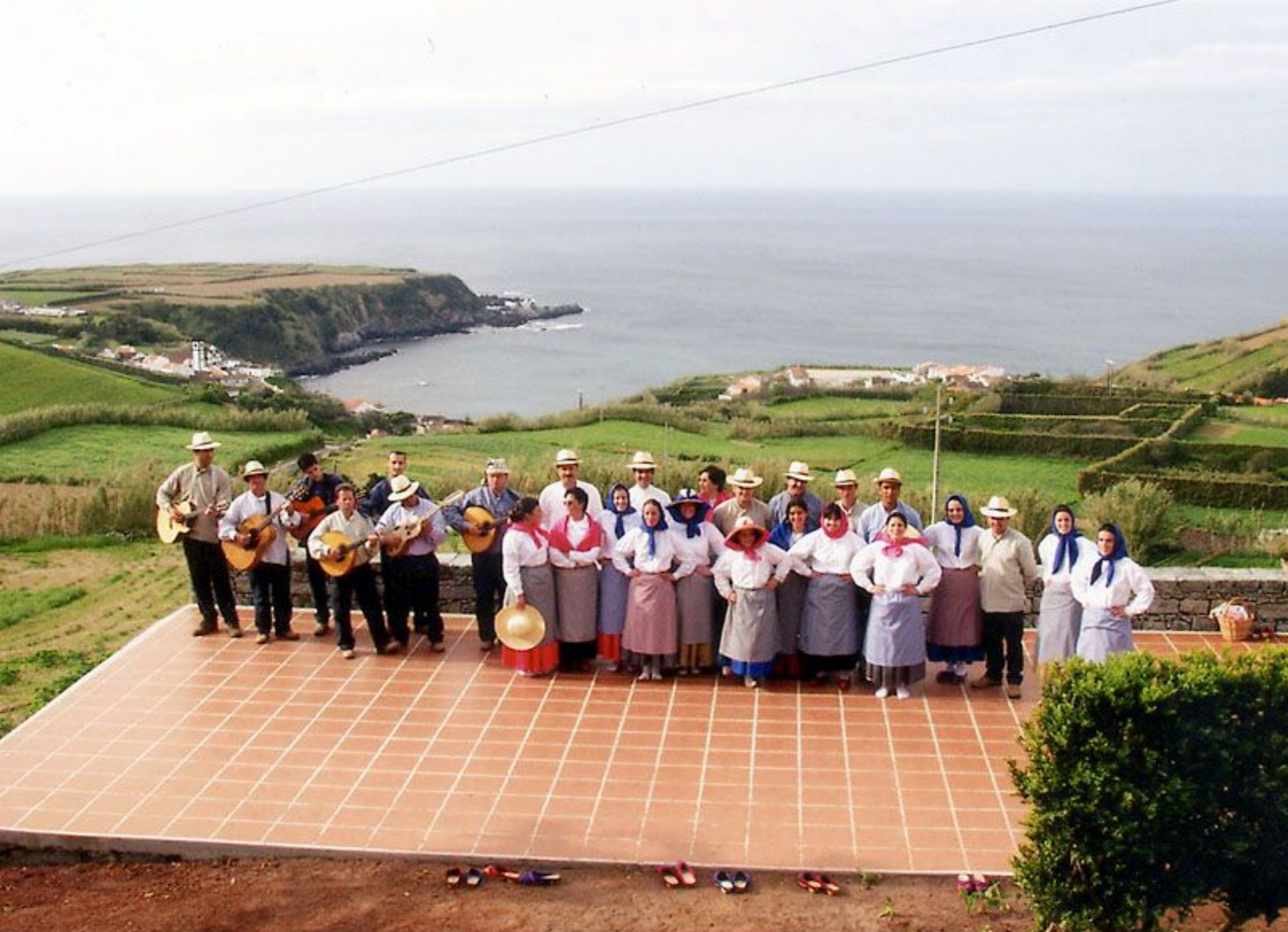
Grupo Folclórico da Casa do Povo de Porto Formoso