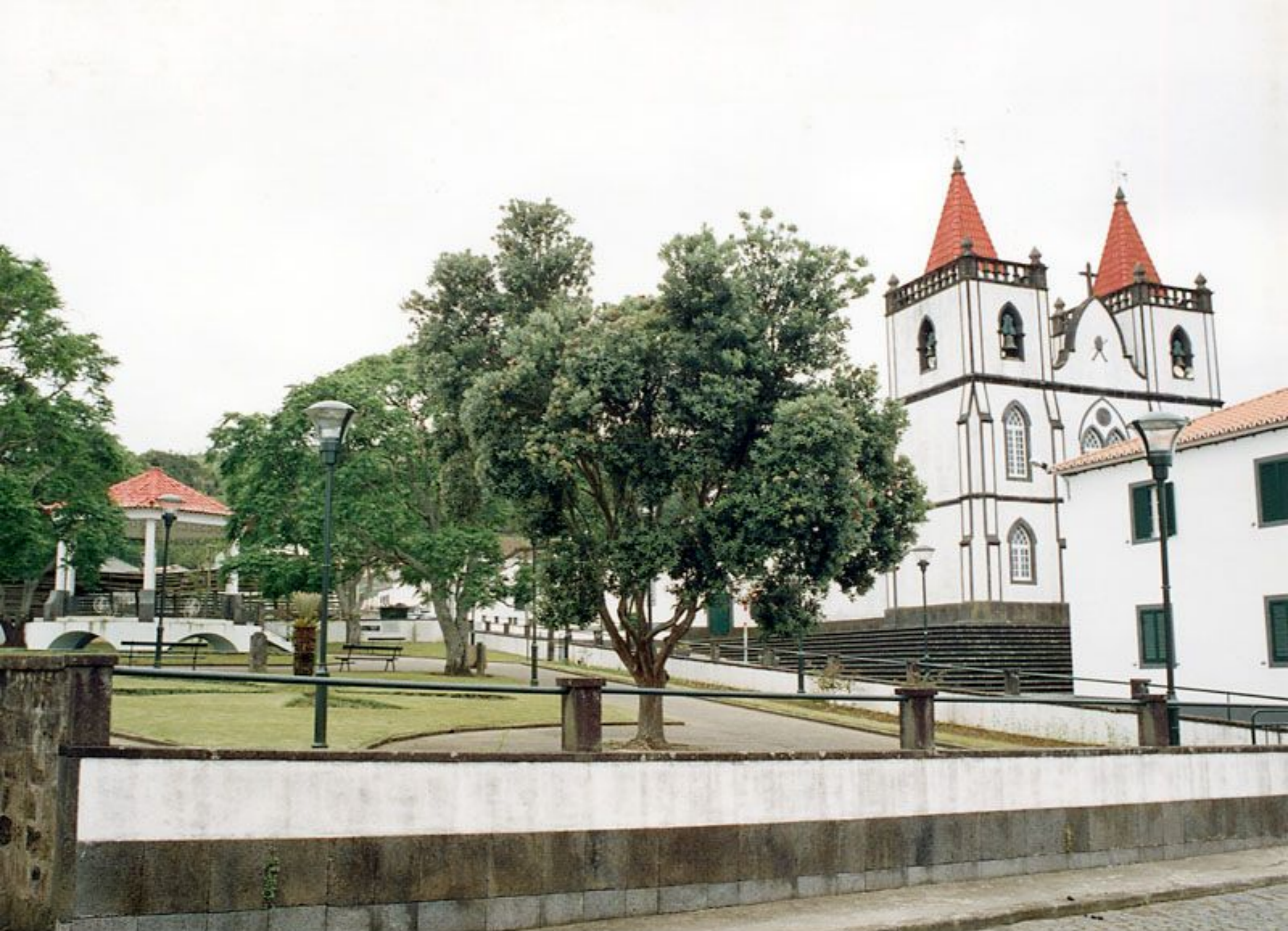
Jardim, Coreto e Igreja Paroquial