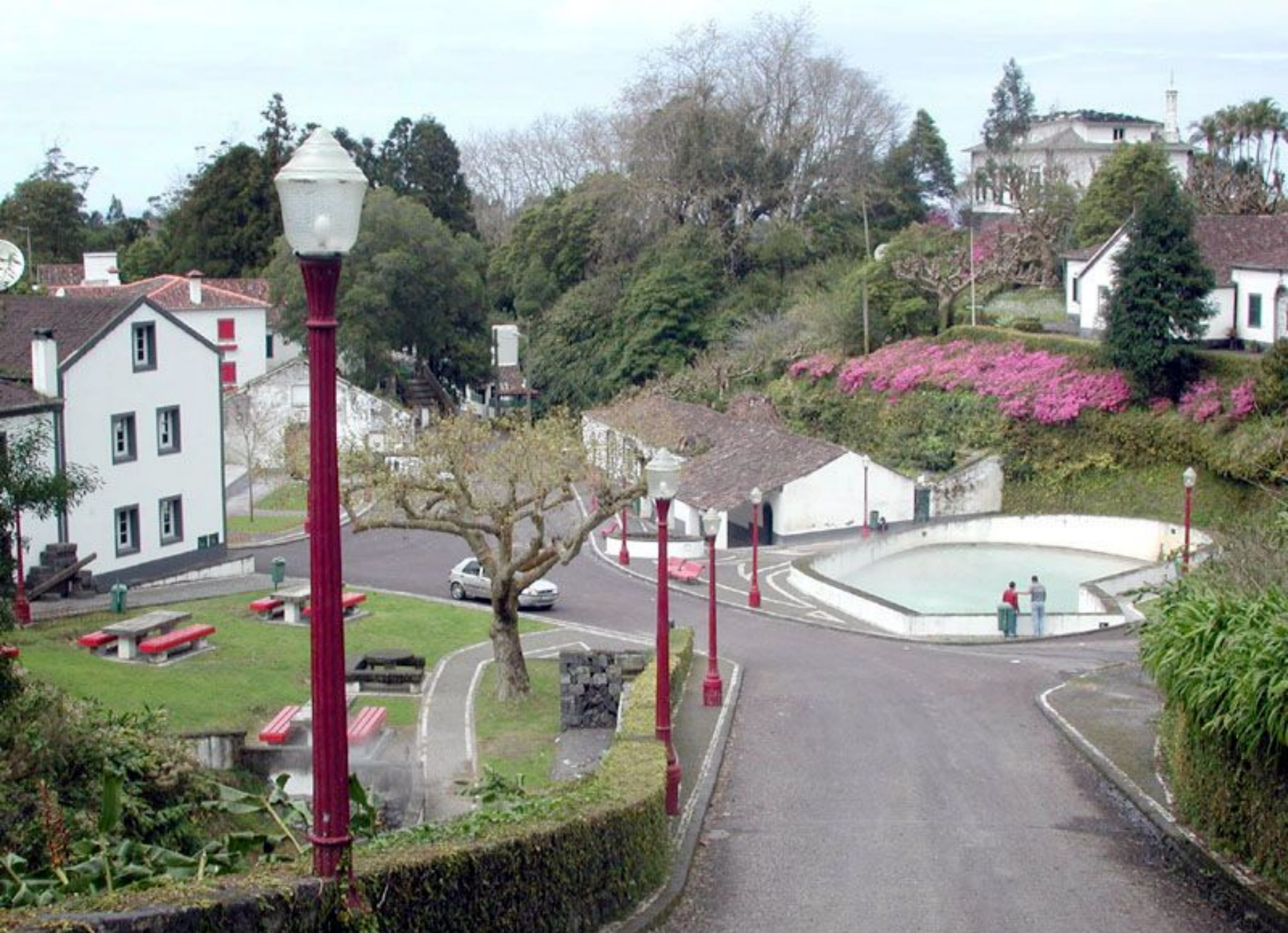
Caldeiras de Ribeira Grande