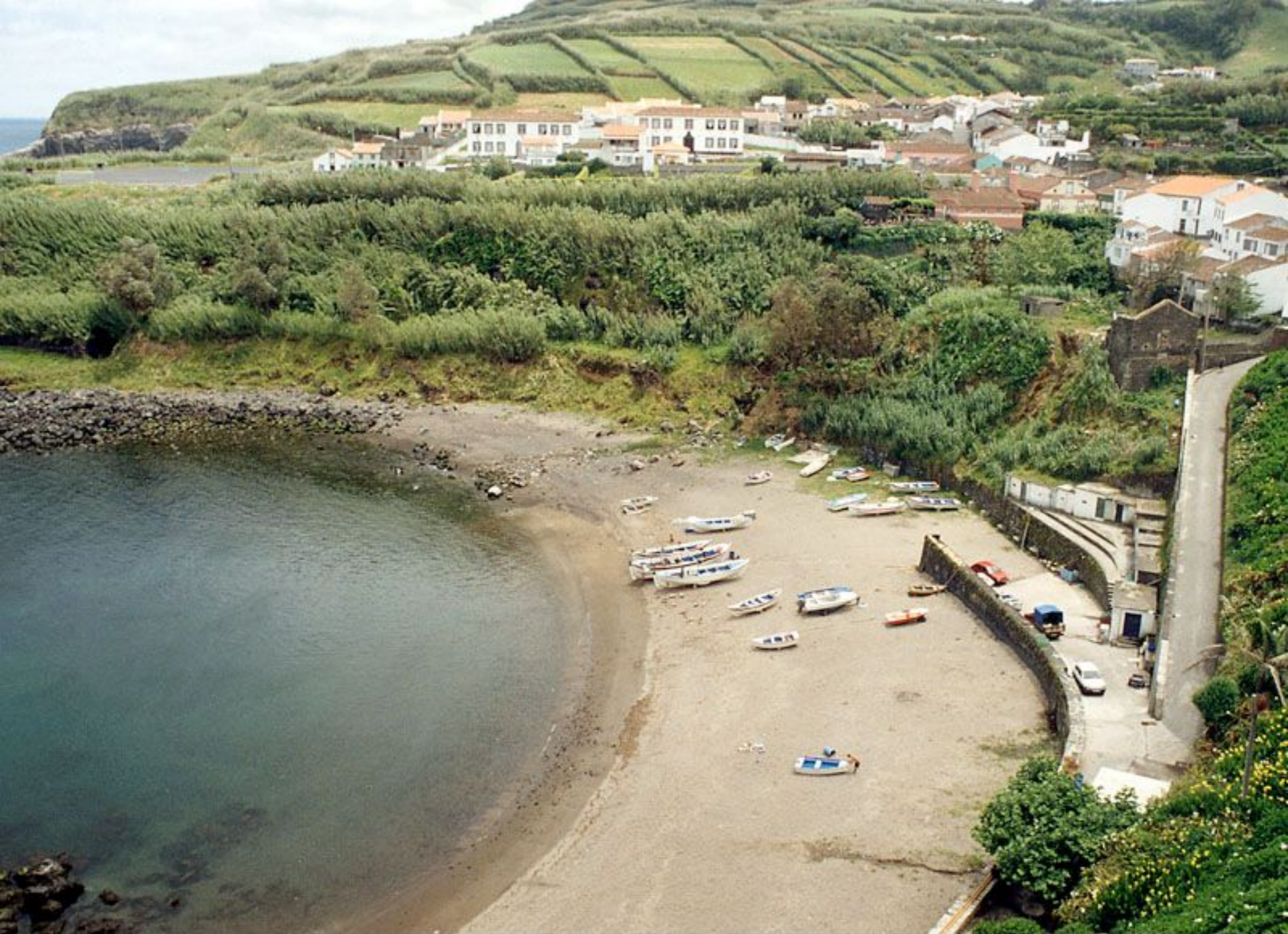
Porto de Pesca