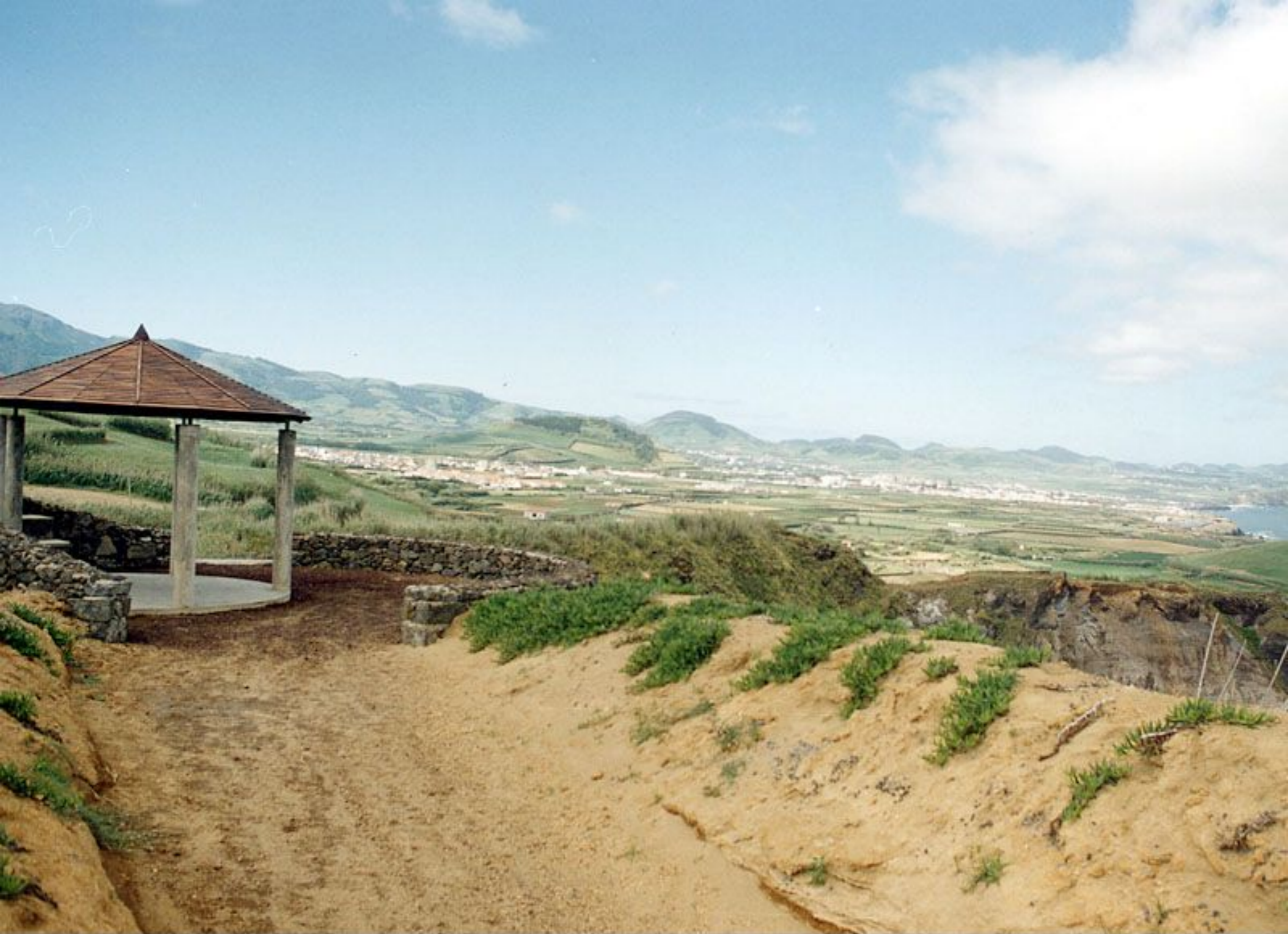
Miradouro Vigia das Baleias