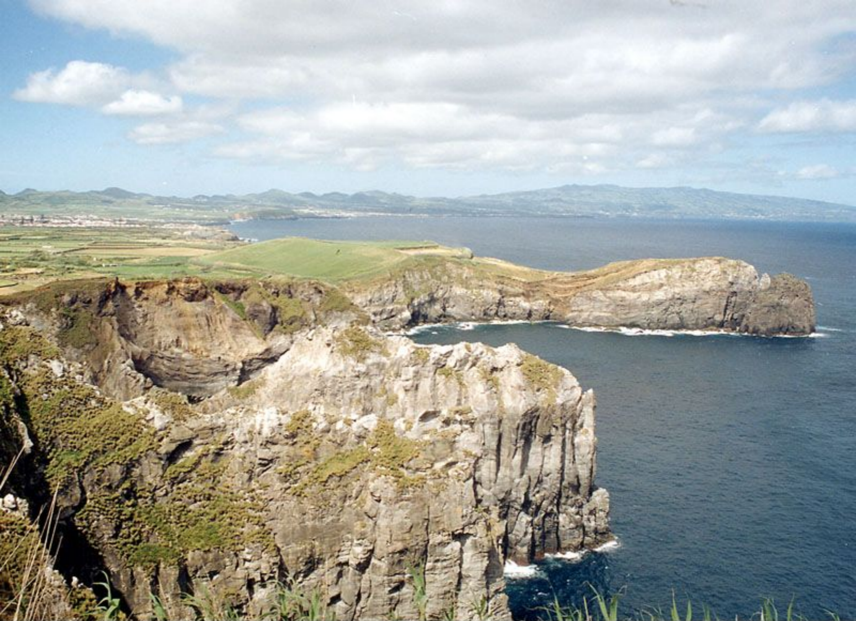
Vigia das Baleias