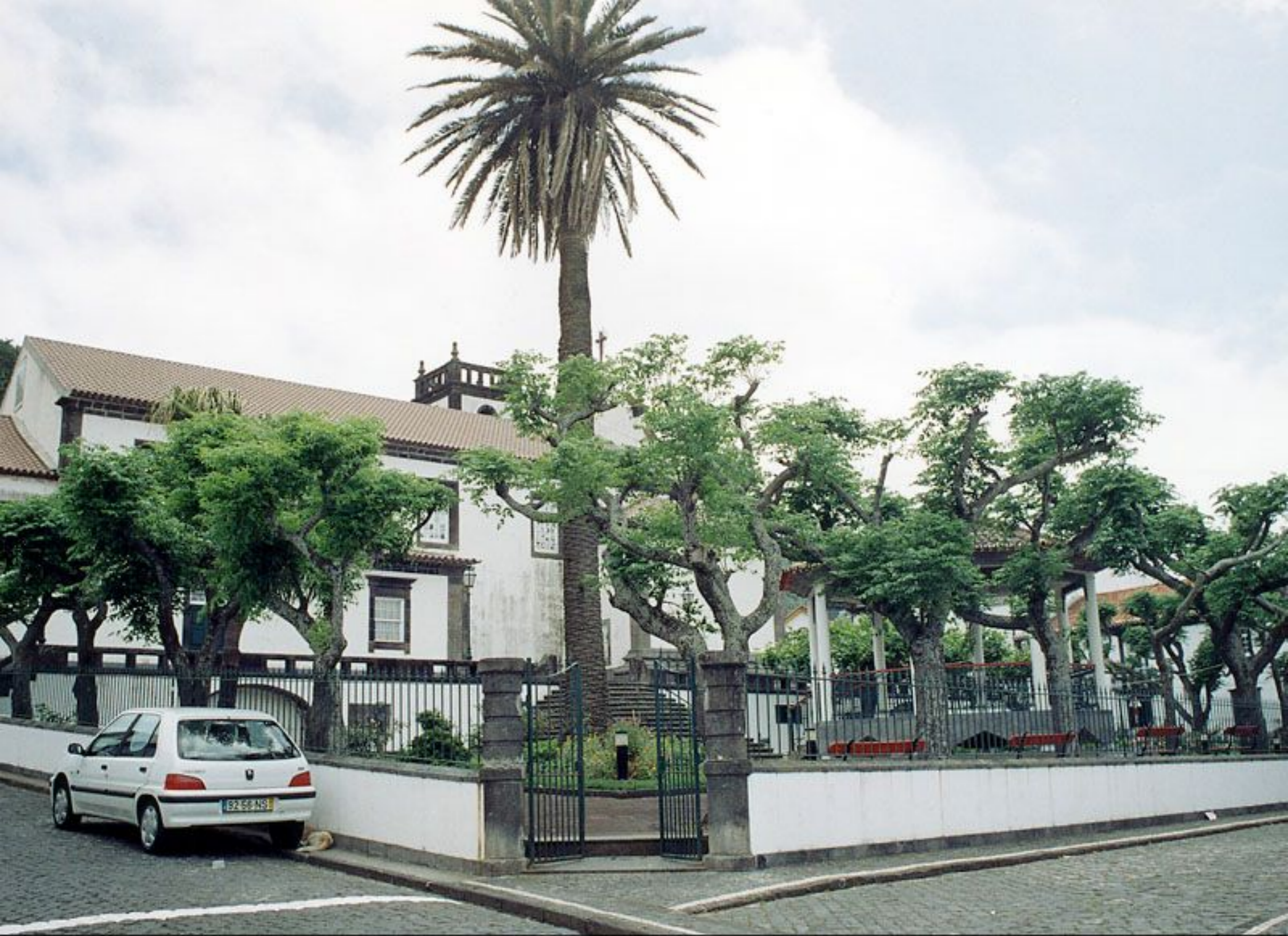
Jardim da Igreja