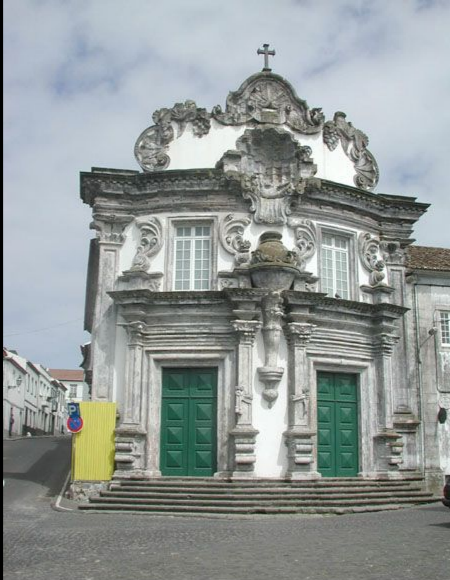
Igreja do Espírito Santo