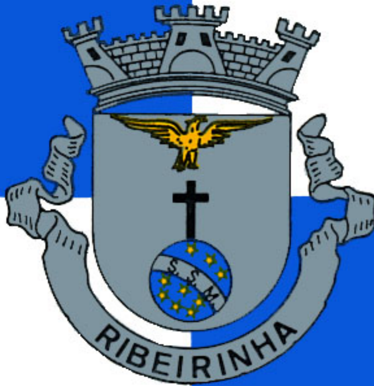
Brasão de Ribeirinha