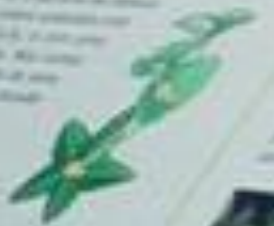
Nome científico: Passiflora ligularis Nome popular: Passiflora