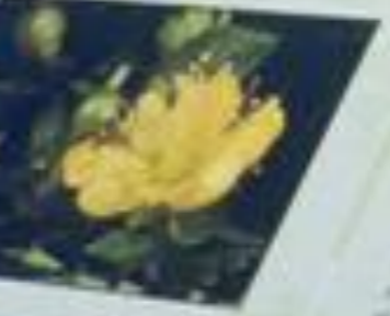
Nome científico: Passiflora ligularis Nome popular: Passiflora

Este Parque Protegido de Interesse Regional (PPRI) foi criado em 2002, com o objetivo de proteger e conservar o valor paisagístico, cultural e histórico da região. O Parque abrange uma área de 1.200 hectares, localizados no município de São Paulo, no Estado de São Paulo. O Parque é composto por duas áreas: o Barreiro da Faneca e a Costa Norte. O Barreiro da Faneca é uma área de terra vermelha, com uma paisagem única e bela. A Costa Norte é uma área de mata atlântica, com uma paisagem verde e bonita. O Parque é um local ideal para o turismo e o lazer, oferecendo uma experiência única para todos os visitantes.