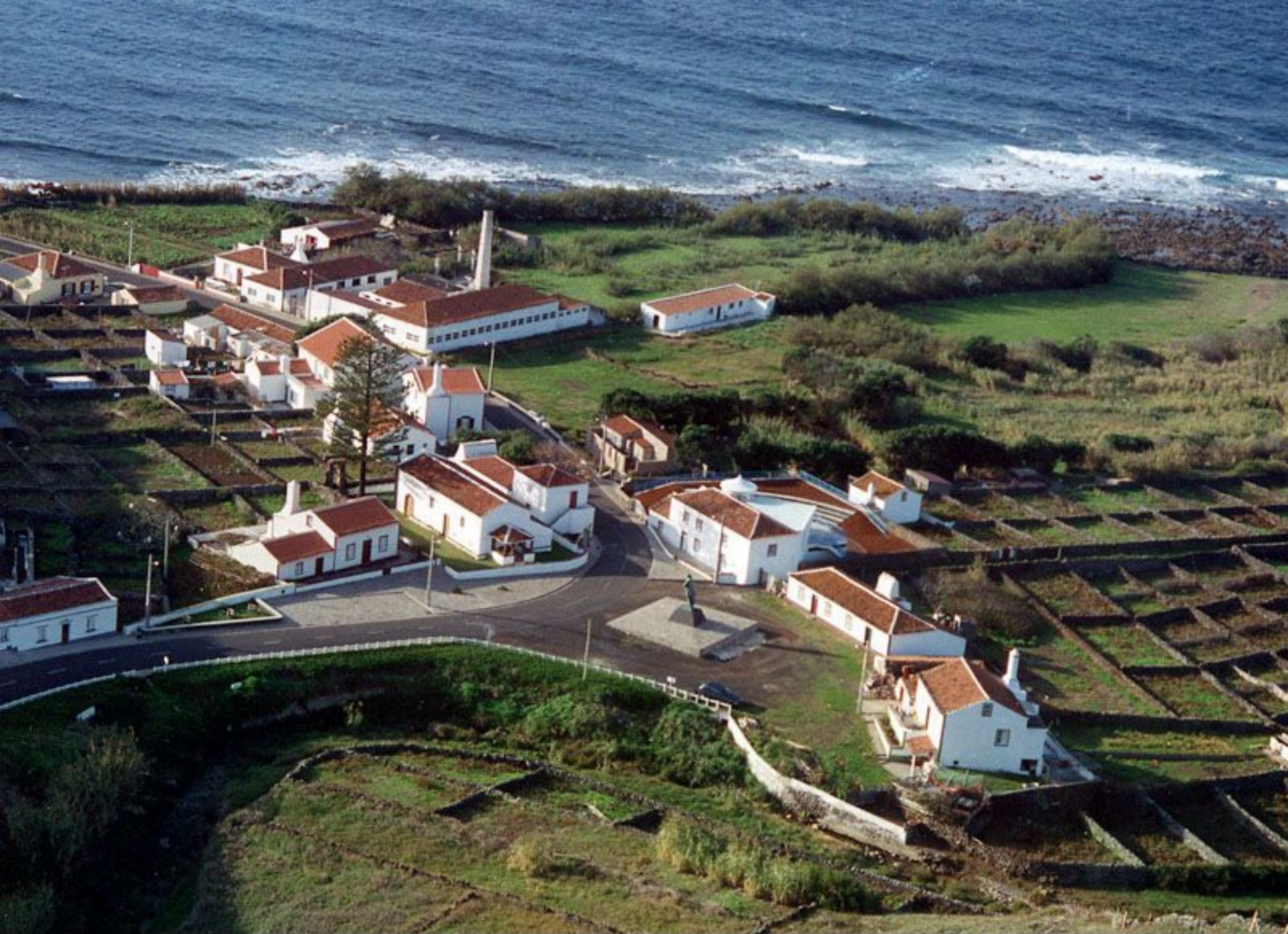
Vista Panorâmica de Anjos