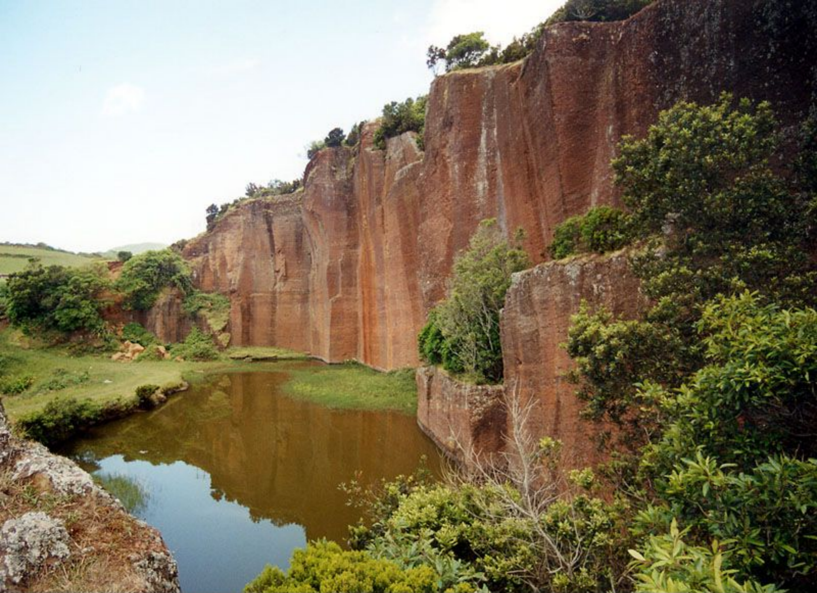
Poço da Pedreira