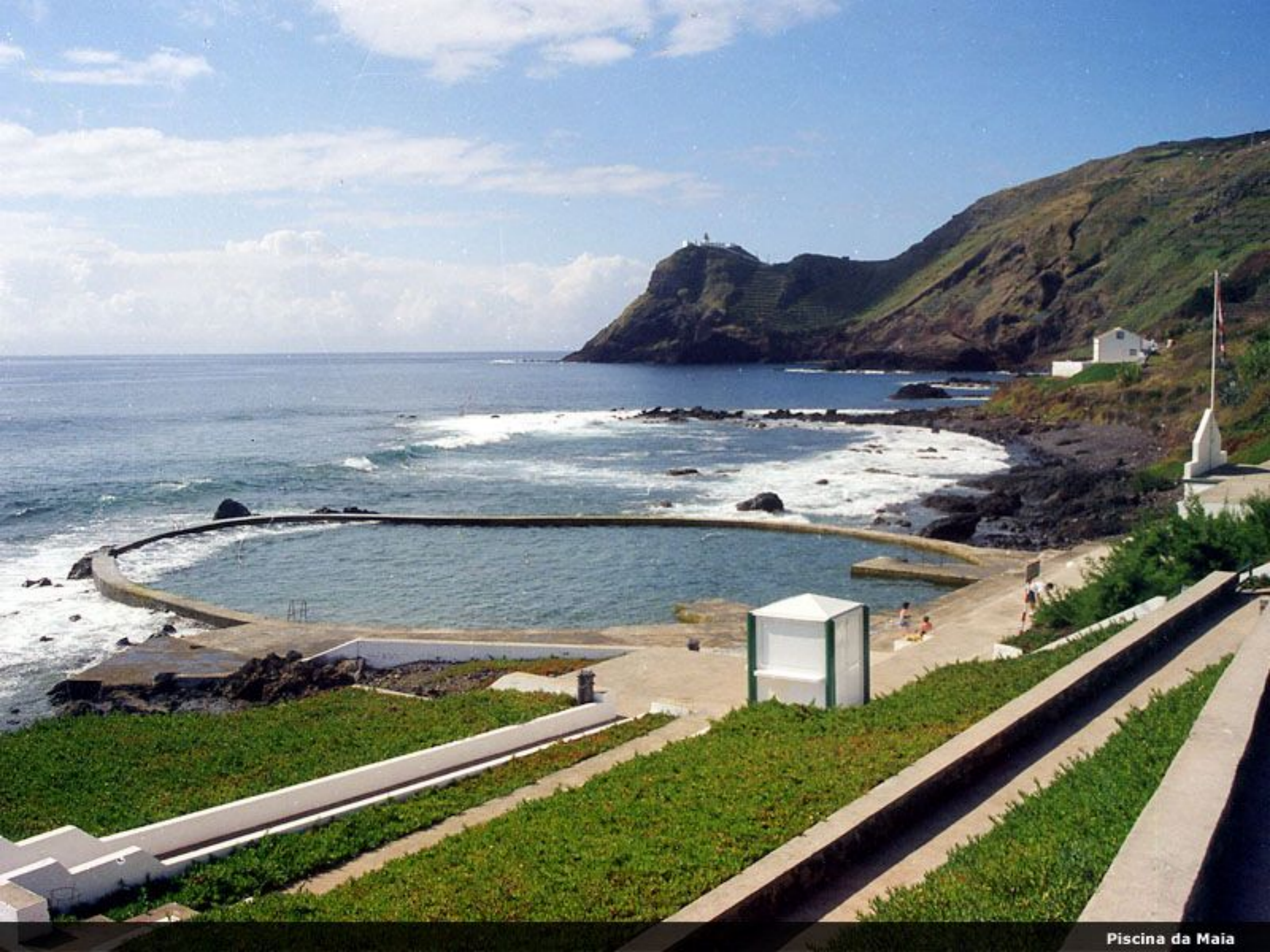
Piscina da Maia