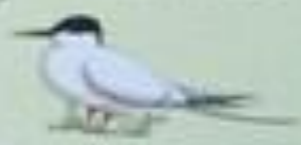
Nome científico: Sterna bergii Nome popular: Sterna

Este Parque Protegido de Interesse Regional (PPRI) foi criado em 2002, com o objetivo de proteger e conservar o valor paisagístico, cultural e histórico da região. O Parque abrange uma área de 1.200 hectares, localizados no município de São Paulo, no Estado de São Paulo. O Parque é composto por duas áreas: o Barreiro da Faneca e a Costa Norte. O Barreiro da Faneca é uma área de terra vermelha, com uma paisagem única e bela. A Costa Norte é uma área de mata atlântica, com uma paisagem verde e bonita. O Parque é um local ideal para o turismo e o lazer, oferecendo uma experiência única para todos os visitantes.