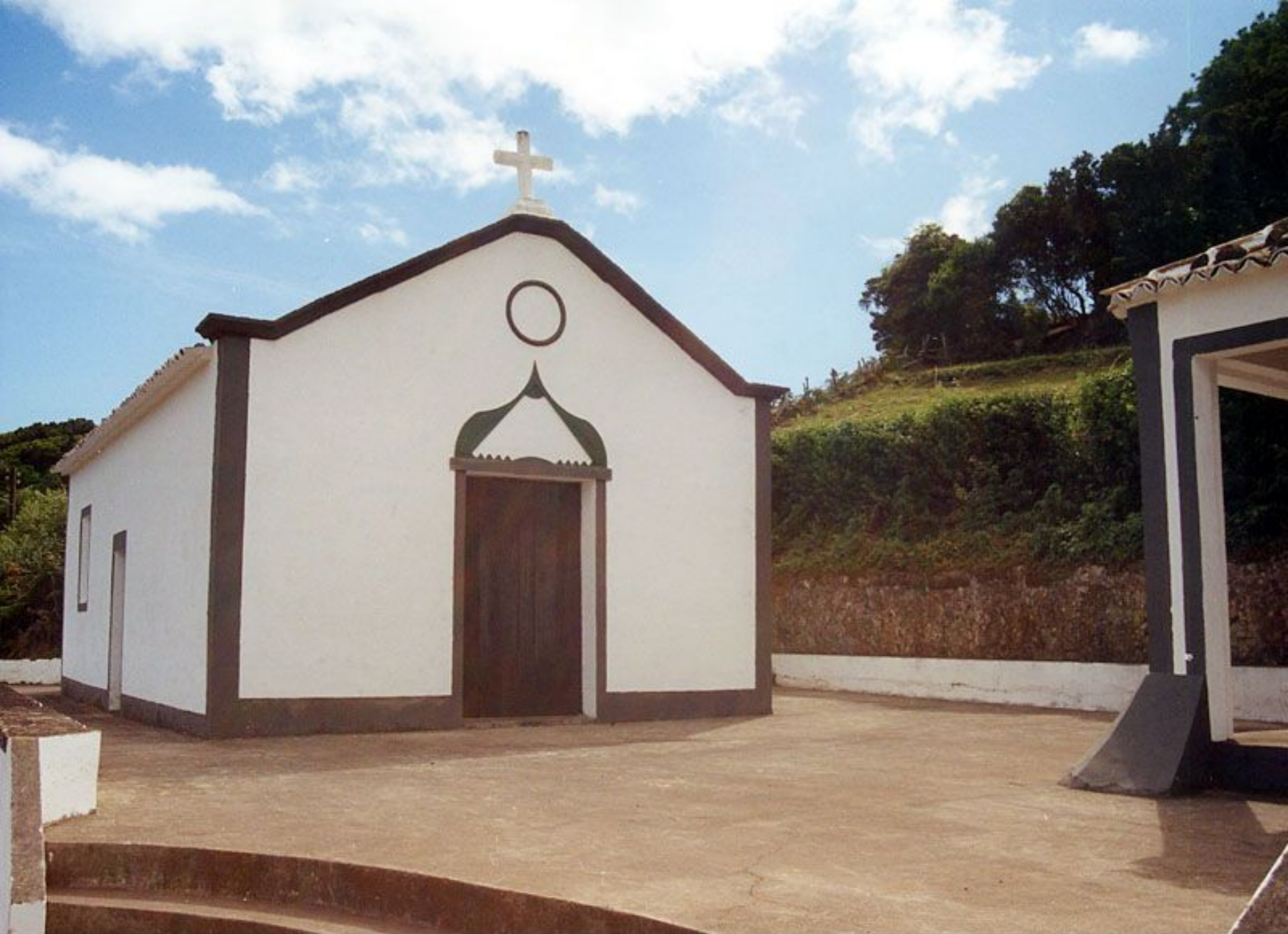
Ermida de Nossa Senhora da Glória - Lugar da Glória