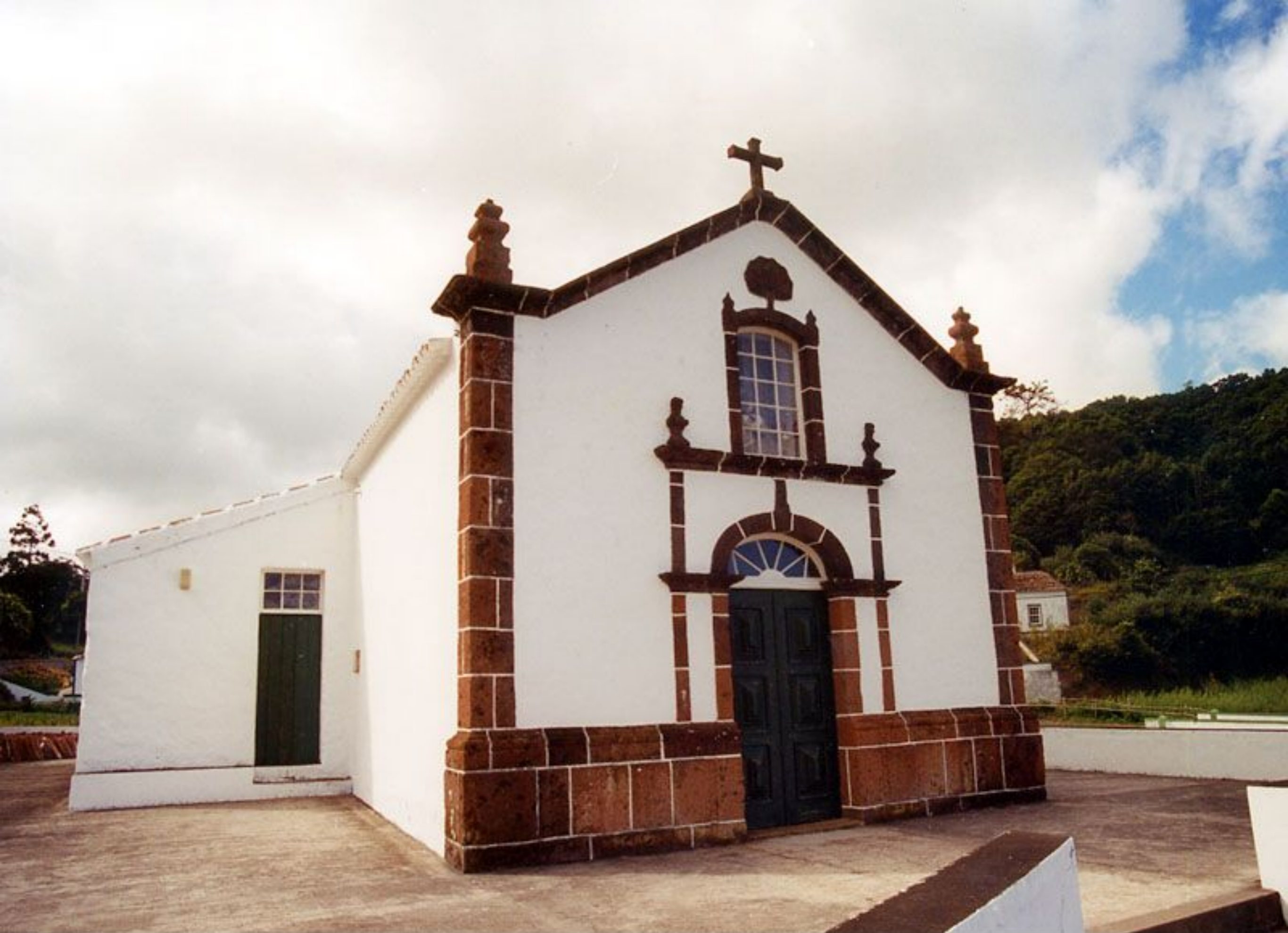
Ermita de Santo António - Lugar de Santo António