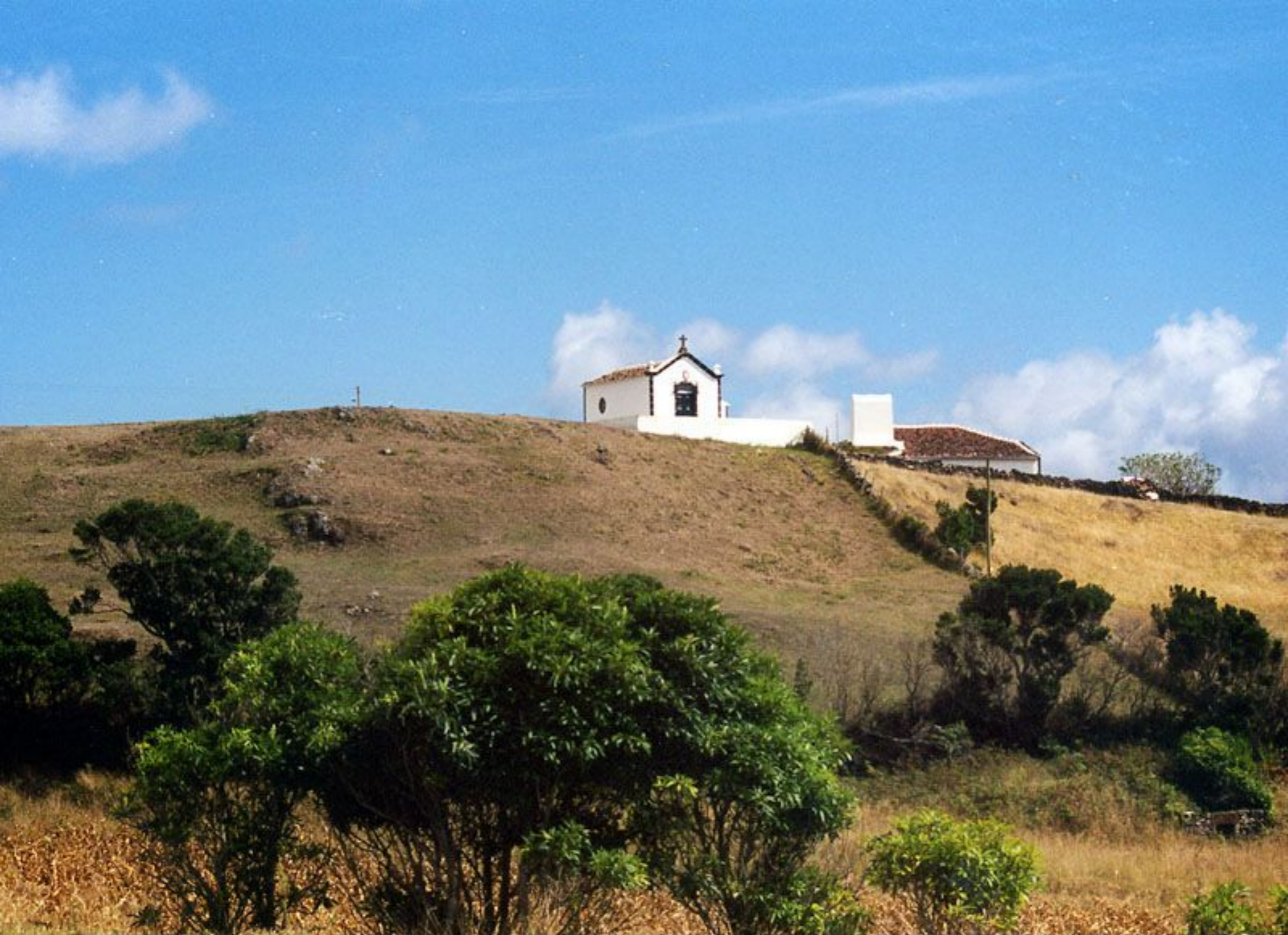
Ermida de Nossa Senhora da Boa Morte - Lugar de Panasco