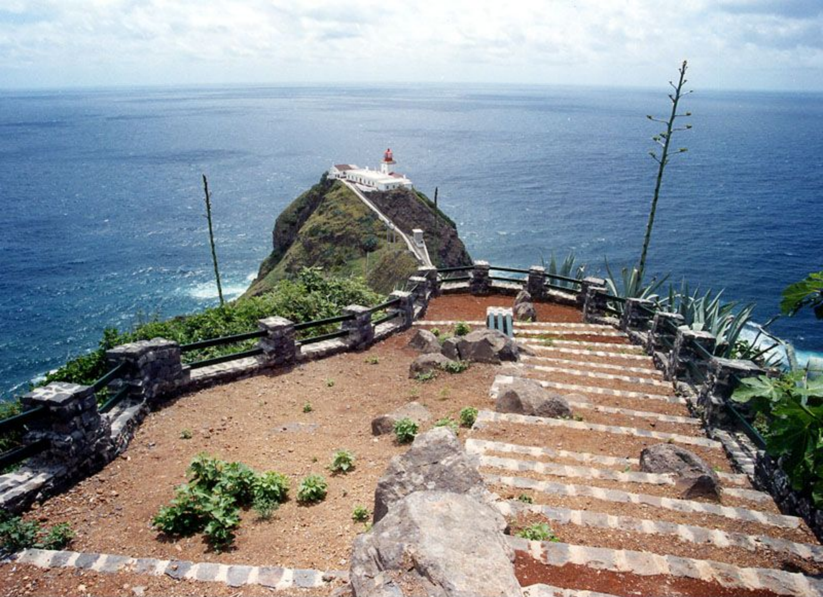
Farol de Gonçalo Velho - Maia