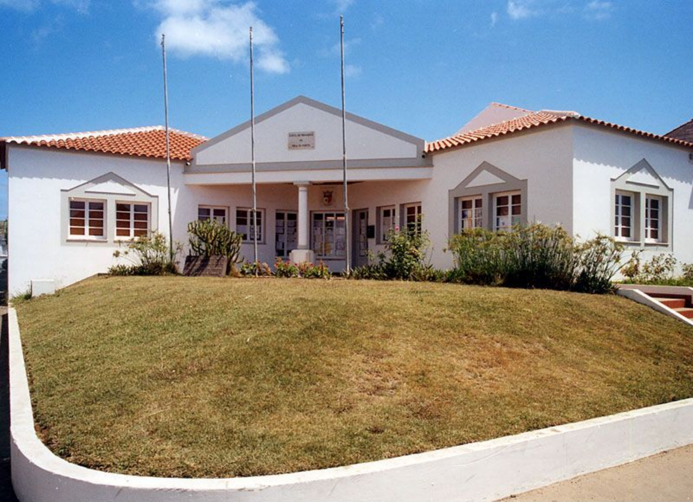
Sede da Junta de Freguesia de Vila do Porto