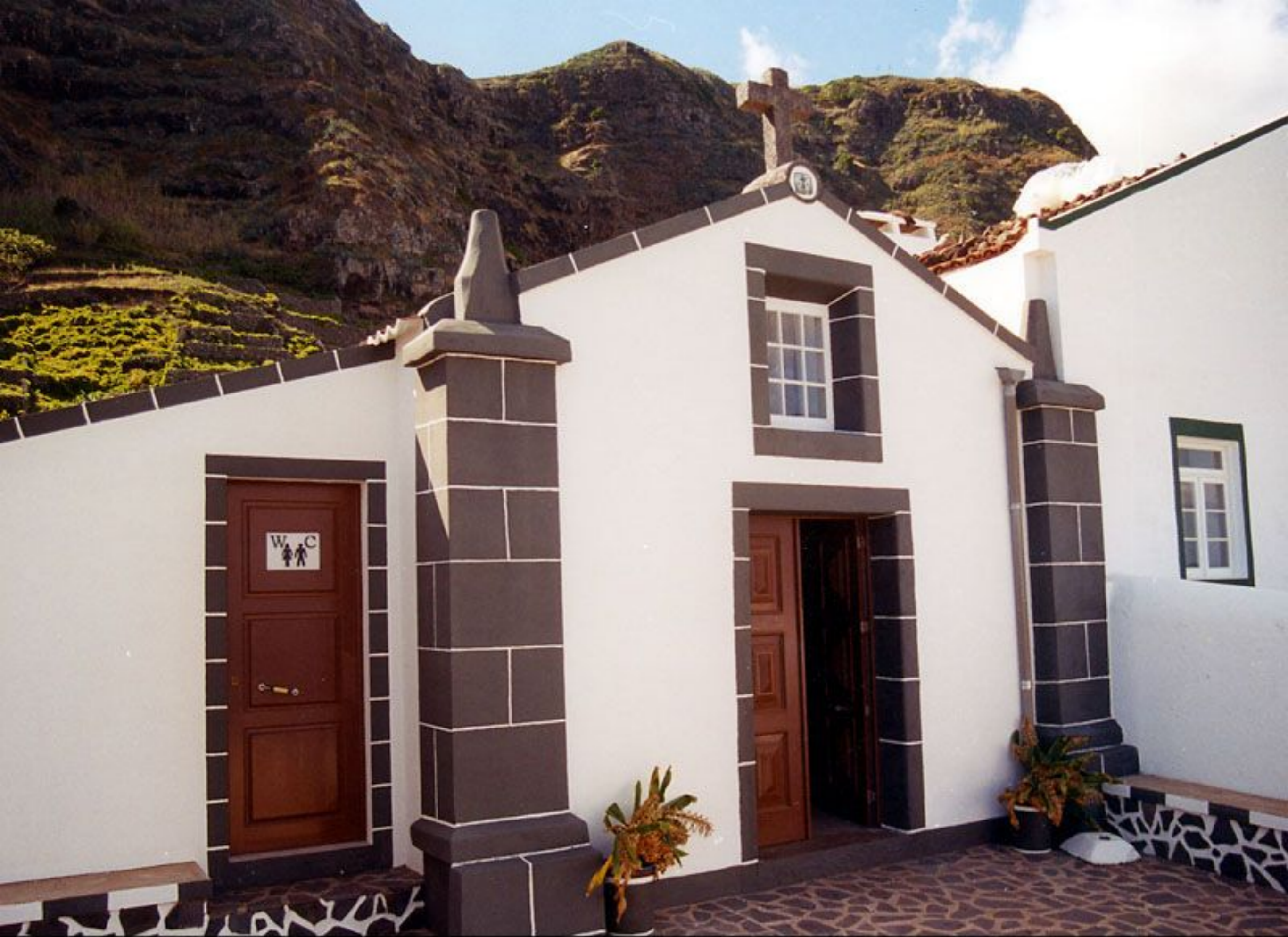
Ermita de Nossa Senhora dos Prazeres - Lugar da Maia