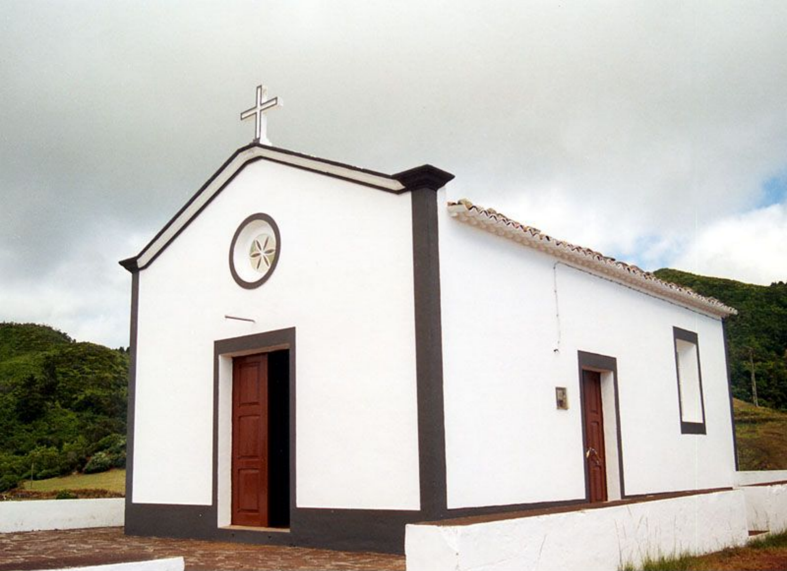
Ermida de Nossa Senhora da Piedade - Lugar de Malbusca