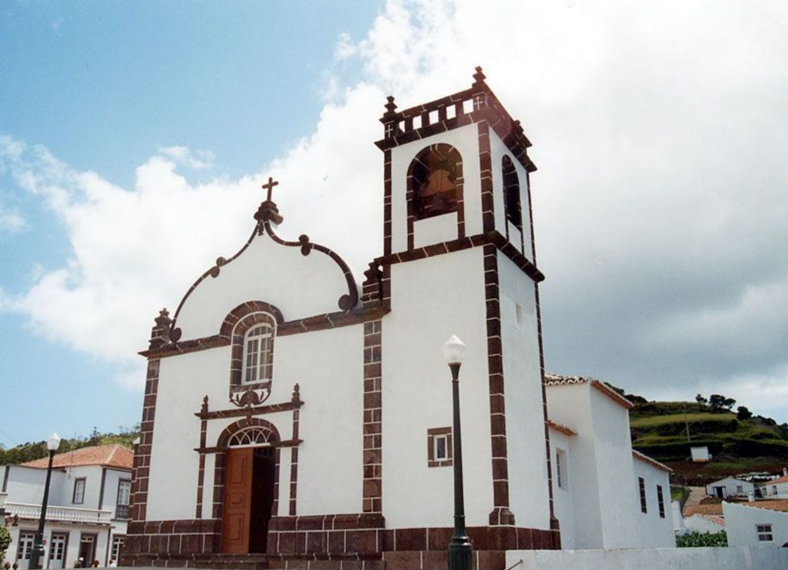
Igreja Paroquial de Santa Bárbara