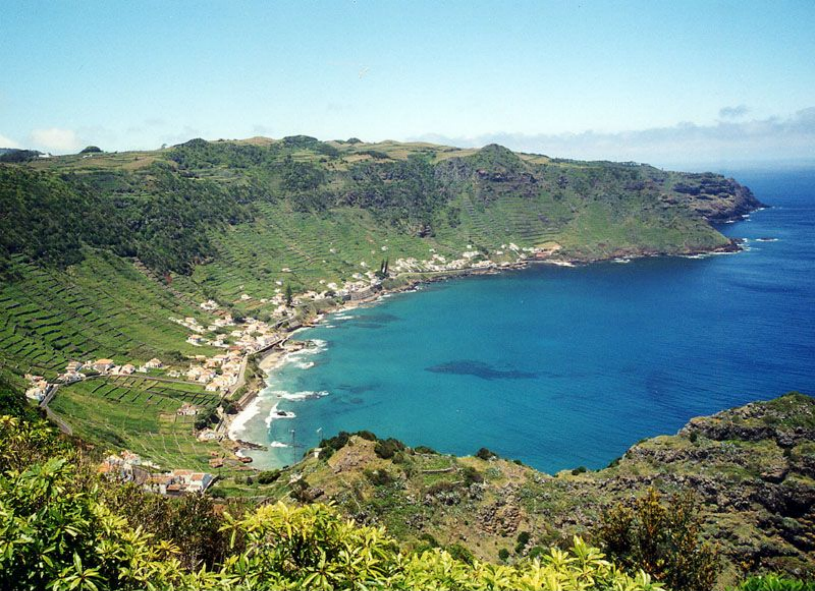
Vista Panorâmica de São Lourenço