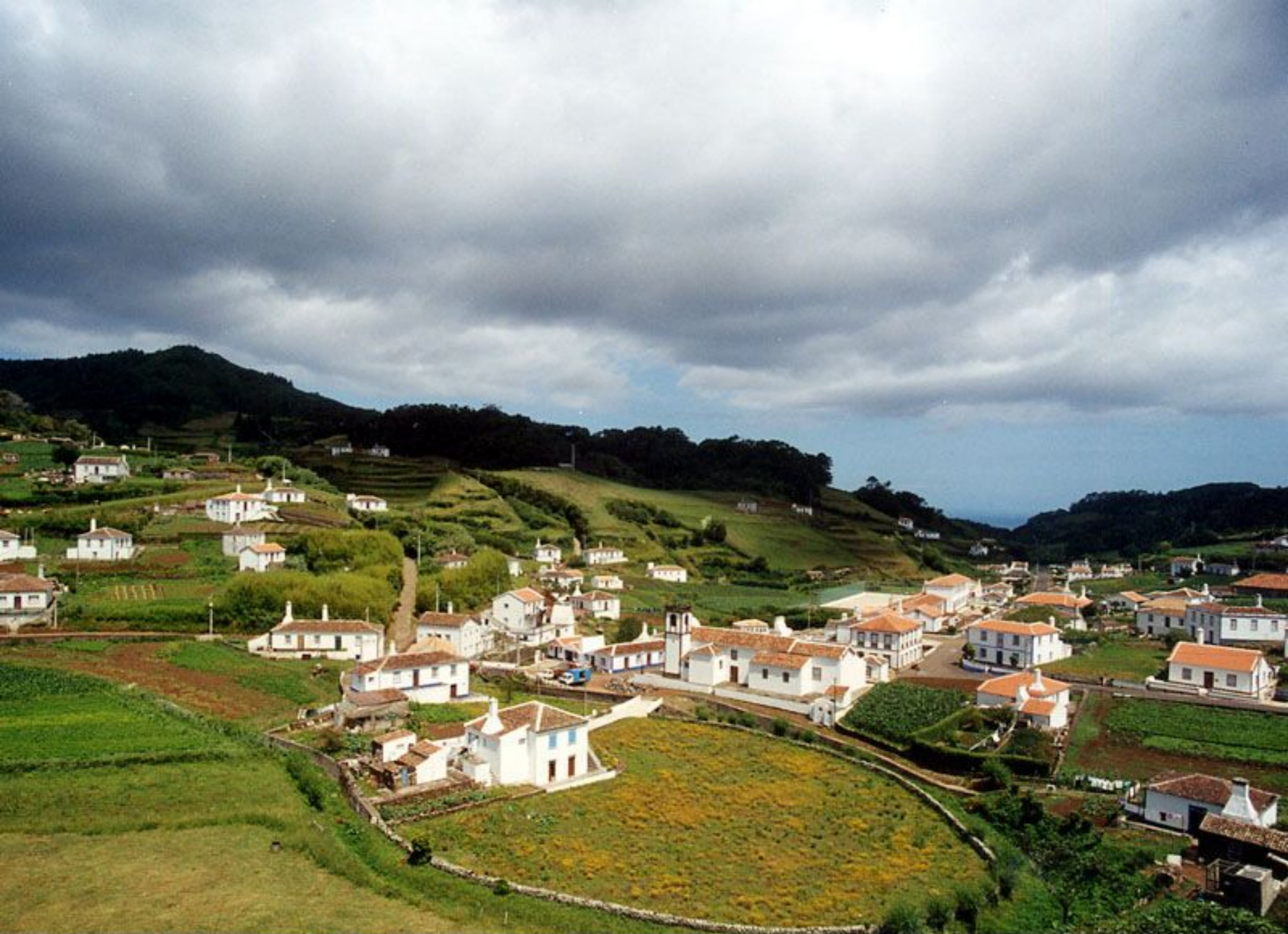
Vista Panorâmica de Santa Bárbara