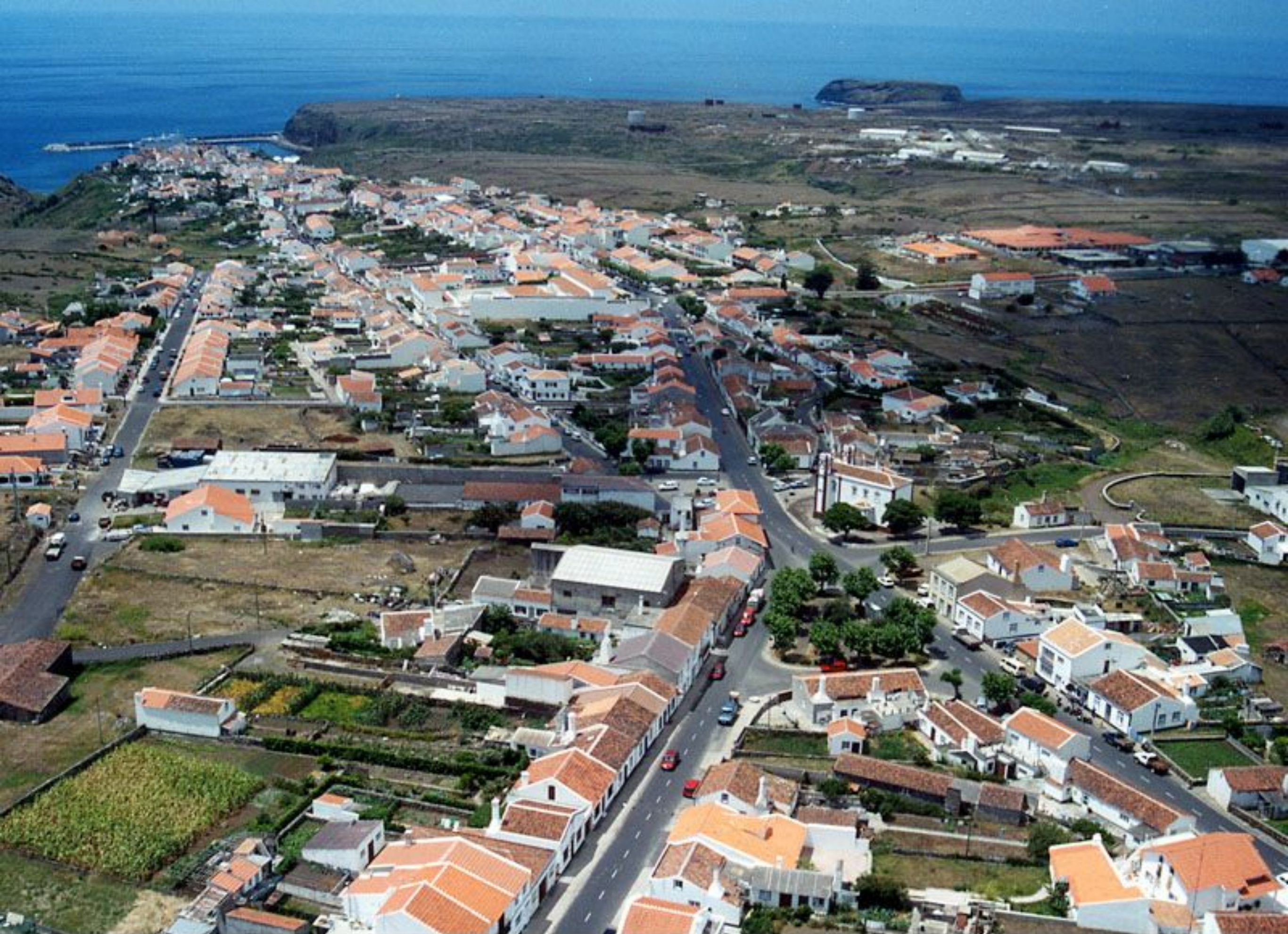
Vista Panorâmica de Vila do Porto