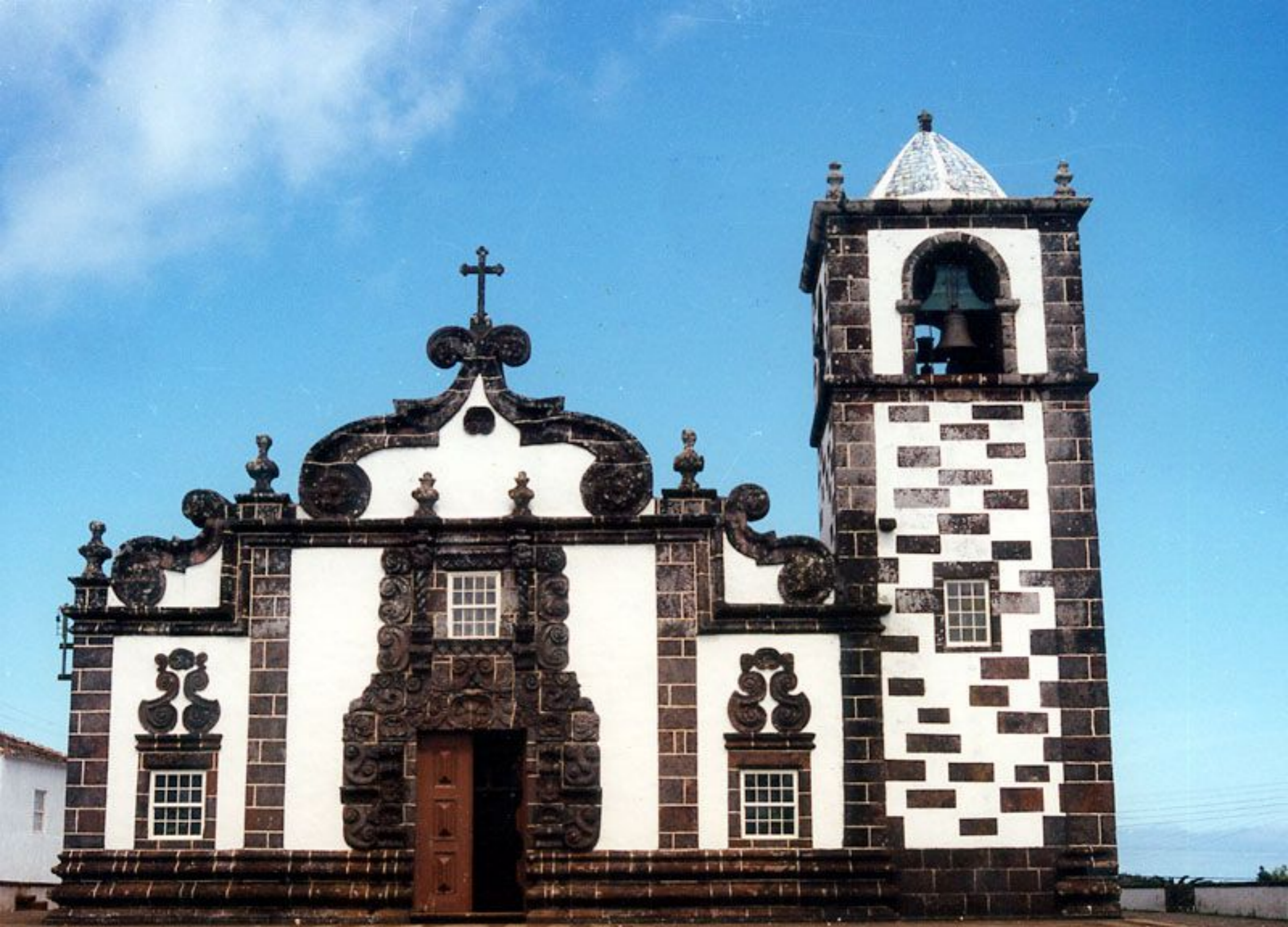
Igreja Paroquial de Nossa Senhora da Purificação