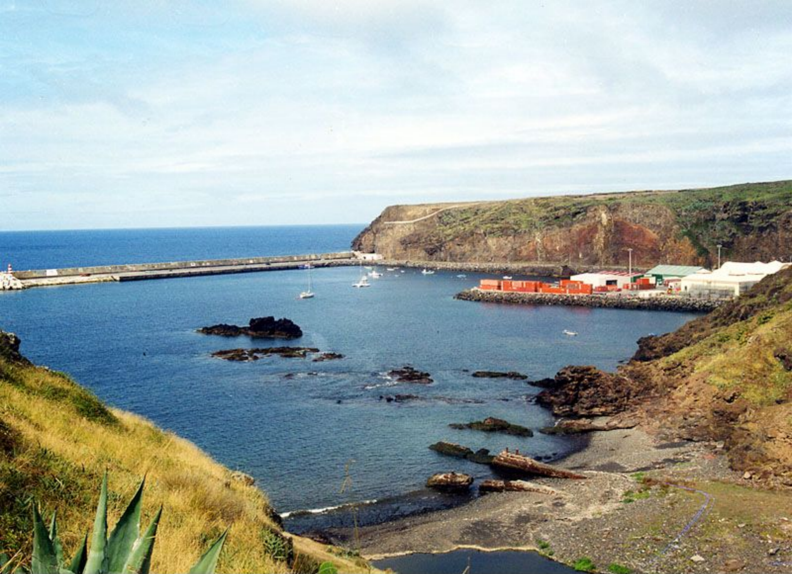
Porto de Vila do Porto