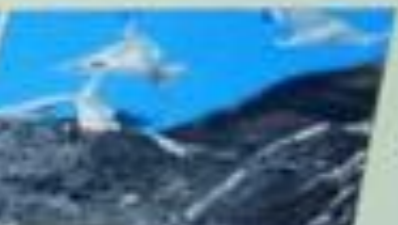
Nome científico: Fregata aquila Nome popular: Fregata