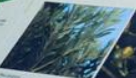
Nome científico: Passiflora ligularis Nome popular: Passiflora