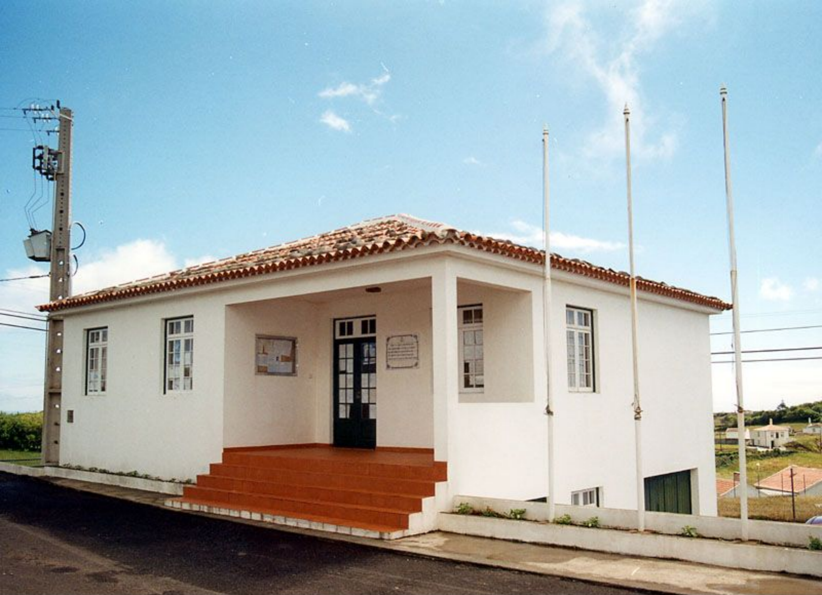
Sede da Junta de Freguesia de Santo Espírito