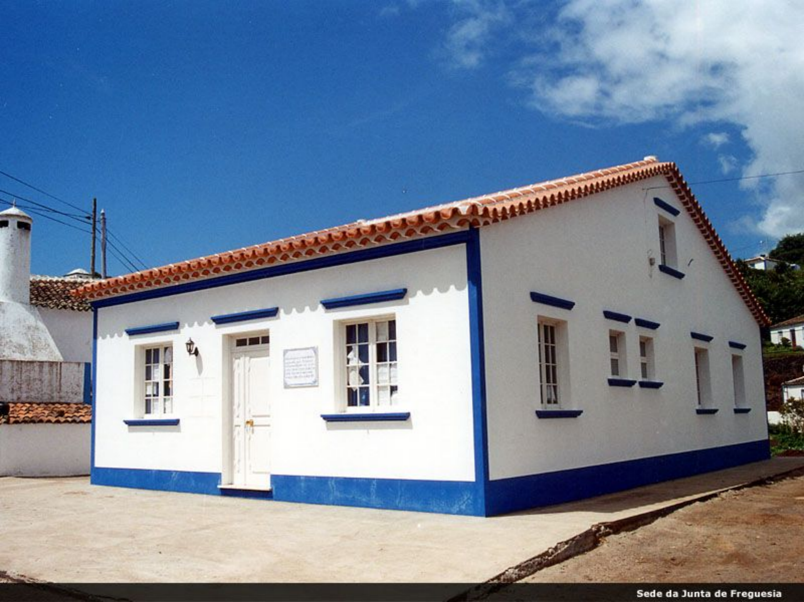
Sede da Junta de Freguesia