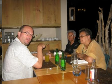
LOMBA DA MAIA 2016

Mais recentemente, tem-se dedicado ainda ao estudo de aspetos da literatura de viagens anglófona novecentista sobre os Açores e à investigação sobre o papel da Galiza dentro da Lusofonia. Pertence a um número considerável de associações e agremiações científicas de relevo nacional e internacional, tendo recentemente sido eleito como Sócio-Correspondente Estrangeiro da Academia das Ciências de Lisboa.