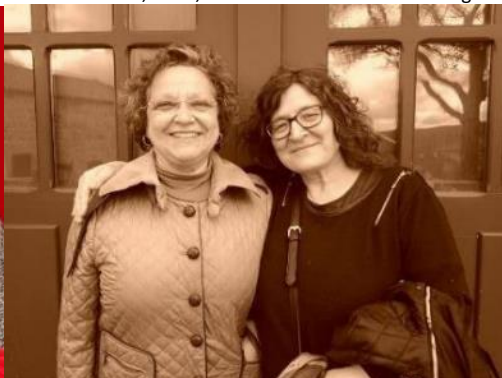
Montalegre 2016 MONTALEGRE 2016