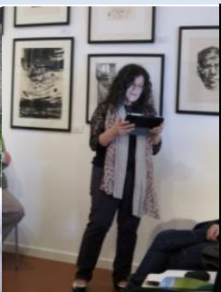
LAGOA 2012 - VILA DO PORTO, STA Mª 2011