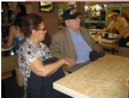
HONG KONG 2011