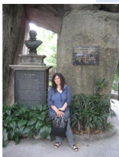
Gruta de Camões MACAU 2011