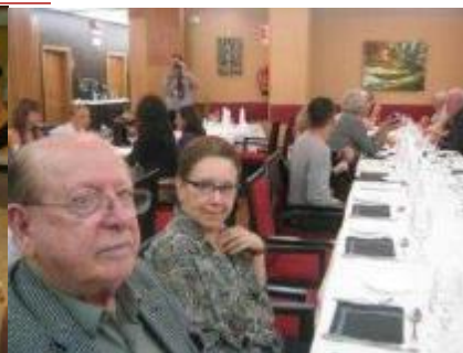
OURENSE, GALIZA 2012

Professor de Filologia Românica do Instituto de Letras da UERJ, de 1962 a 1992.