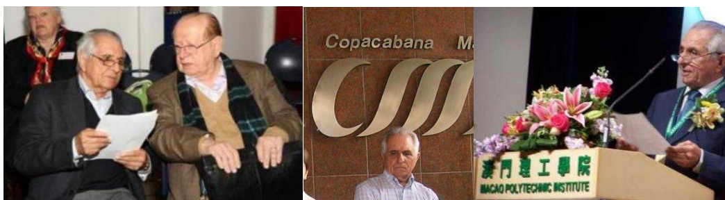
RIO DE JANEIRO 2010

É SÓCIO FUNDADOR DA AICL. PRESIDE À ASSEMBLEIA-GERAL. TOMOU PARTE EM TODOS OS COLÓQUIOS DESDE 2007.