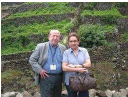
SANTA MARIA 2011