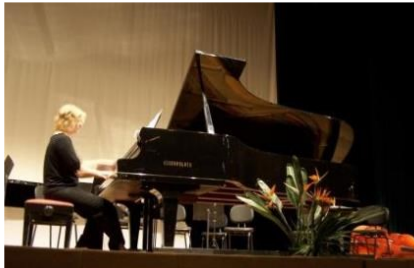
COM A UDESC NO 13º COLÓQUIO EM FLORIPA, SANTA CATARINA 2010