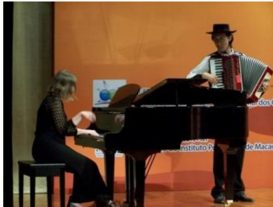
15º COLÓQUIO COM ALUNOS CHINESES DO IPM (MACAU) 2011

Em janeiro e em maio de 2006 acompanhou o grupo vocal Quatro Oitavas em duas digressões ao Uruguai e ao Brasil a convite da Direção Regional das Comunidades. Desde 1989 é professora de Piano e Análise e Técnicas de Composição no Conservatório Regional, desempenhando desde 2004 o cargo de Presidente do Conselho Executivo do Conservatório de Regional de Ponta Delgada. Em 2010 foi a pianista convidada dos colóquios para o XIII Colóquio Anual da Lusofonia em Florianópolis, Santa Catarina, Brasil, onde deu um concerto acompanhada da Orquestra (de cordas) da UDESC. Em 2011 acompanhou o 15º Colóquio a Macau onde atuou com artistas chineses em execução de obras açorianas.