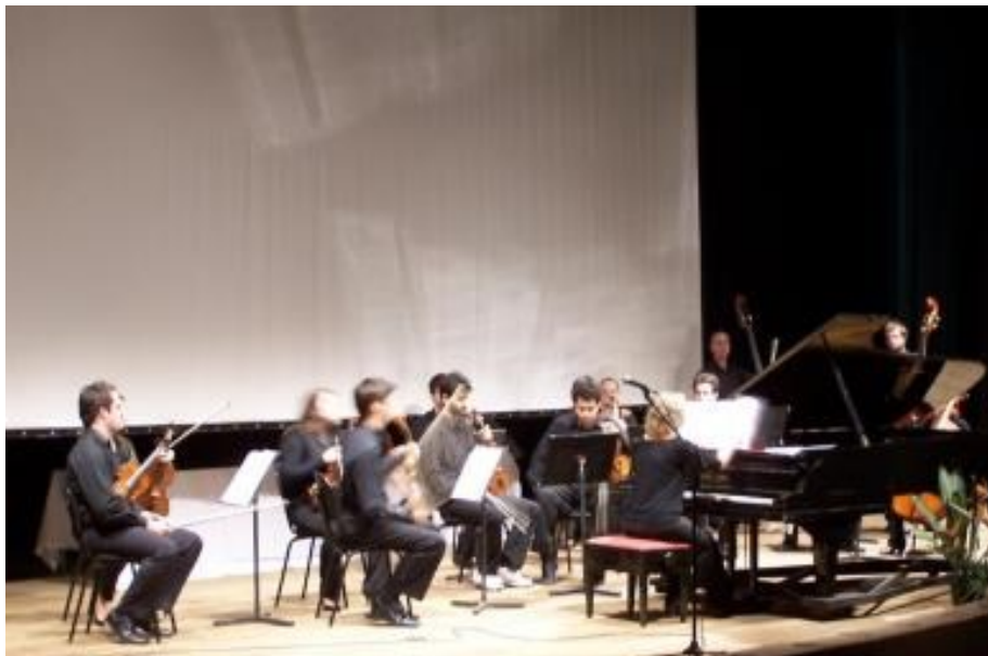
COM A UDESC NO 13º COLÓQUIO EM FLORIPA, SANTA CATARINA 2010