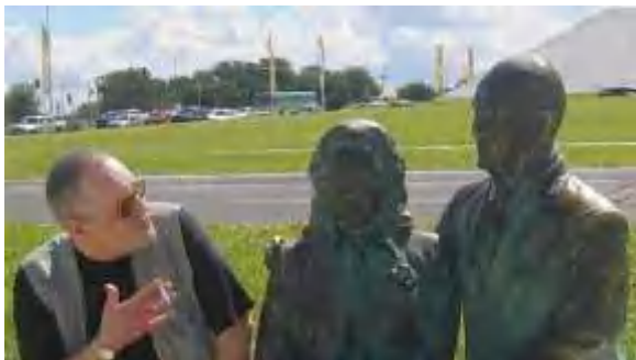
BRASÍLIA 2010 MONUMENTO A JUSCELINO E SARAH KUBITSCHKE DE OLIVEIRA

Publicou, aos 23 anos, poesia "Crônicas do Quotidiano Inútil (vol. 1)". Em Timor (1973-1975) foi Editor-Chefe do jornal local (A Voz de Timor). Em 1976 desempenha funções executivas na Companhia de Eletricidade de Macau